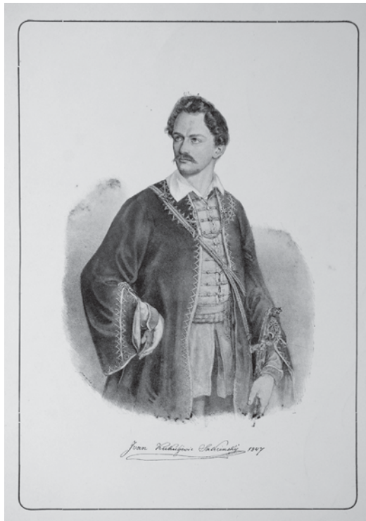
Portret Ivana Kukuljevića iz 1847.