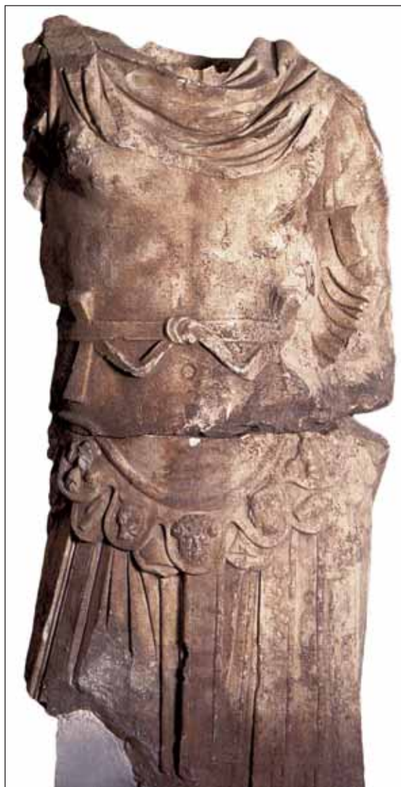
Sl. 2. Pula, Agrippina mlada

obogaćivale svakodnevnicu pojedinca ili zajednice.