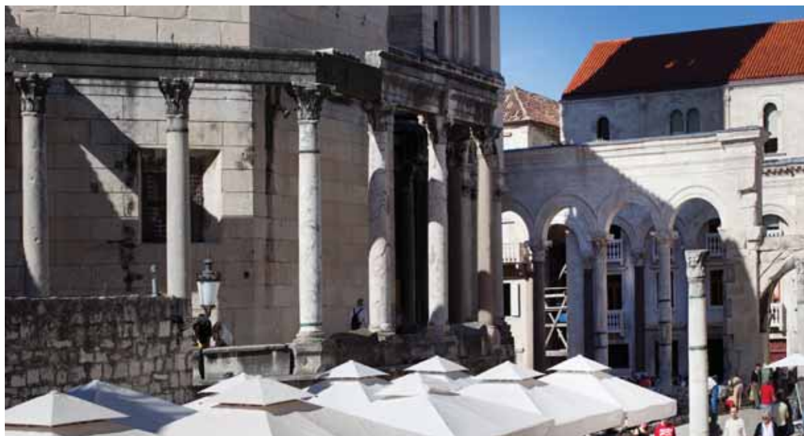
Sl. 1. Stupovi Mauzoleja i Peristila Dioklecijanove palače

Arhitektonski redovi carda i decumanusa nisu sačuvani, no na osnovi pronađenih elemenata moguće ih je rekonstruirati. 3