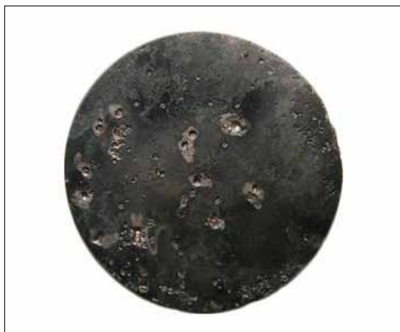
Sl. 4. Balzamariji

Od dvije pronađene kovanice jedna je s prikazom portreta cara Domicijana ( Titus Flavius Domitianus ), a druga s prikazom cara Hadrijana ( Publius Aelius Hadrianus ) na aversu. Oba su prikazana u profilu, Hadrijan s bradom, dok je prikaz Domicijana lošije sačuvan, pa time i teže prepoznatljiv. Revers im je nečitak. Obje kovanice su brončane, a nominalna vijednost im je as. 15 (sl. 7a, b, c, d) Važnost njihova pronalaska očituje se u dataciji cjelokupne grobne cjeline, ali govori o upotrebi Domicijanovoga asa i u periodu vladavine Hadrijana.