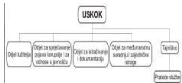
Shema 1. Struktura ustroja USKOK-a

USKOK je osnovan iz razloga što postojeća mreža državnih odvjetništava i njihova nadležnost za postupanje u slučajevima koruptivnih kaznenih djela i kaznenih djela iz sfere organiziranog kriminala nije bila adekvatna u borbi protiv korupcije s obzirom na veliku opasnost i izuzetno štetna djelovanja takvih oblika kriminaliteta.