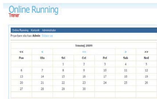
Slika 6. Odabir odgovarajućeg dana u dnevniku

popunjavanje skladišta podataka te bolja i preciznija dubinska analiza.