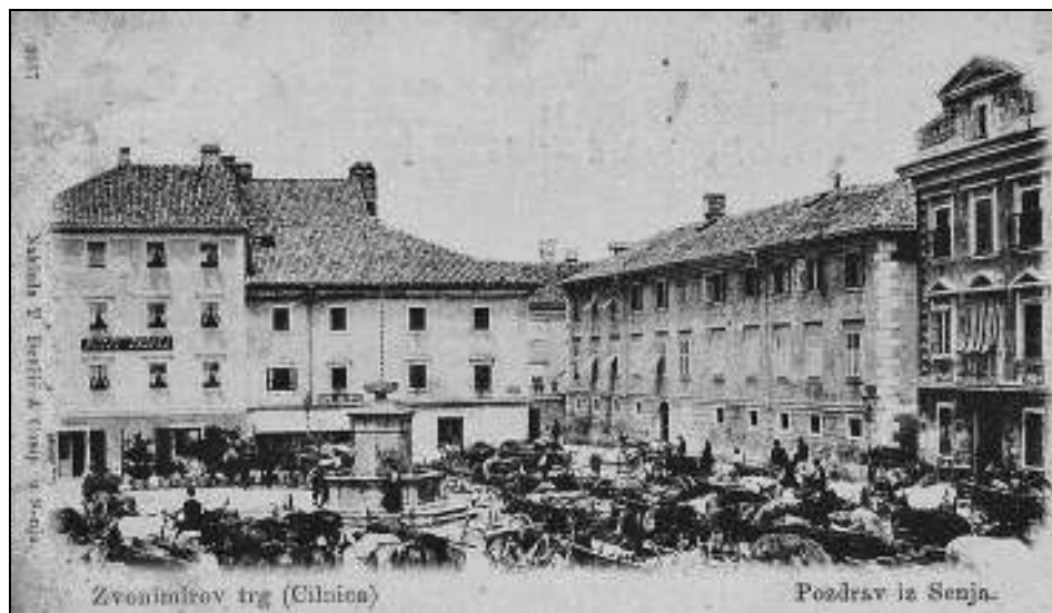
Sl. 2. Zvonimirov trg, danas trg Cilnica, početkom 20. st., (arhiva Gradskog muzeja Senj)

U popisu vojne posade tvrđave Otočac iz 1540. godine nalazilo se ime Jurja Krayatscha (Krajača) s mjesečnom plaćom od 8 forinti. 12 U popisu vojne posade Senj iz 1551. godine Krajači se više ne spominju, dok se u popisu vojne posade tvrđavnog haramijskog naselja Otočac Krajači spominju i 1540. i 1551. godine. Stjepan Pavičić tvrdi da se možda neki njihov predak preselio iz Otočca u Senj, bilo zbog obnašanja vojničke službe ili iz sigurnosnih razloga. 13 Dolaskom u grad Senj istaknuli su se u pomorskim, brodovlasničkim i trgovačkim poslovima, pa je u njihovu grbu prikazan lik srednjovjekovnog trojedrenjaka, što je doista i simbol brodarske tradicije još iz krajeva odkuda su doselili Krajači, tj. iz stare hrvatske Goričke županije. U privatnom arhivu grofa Kulmera u Cerniku bilo je pohranjeno staro rodoslovlje obitelji Krajač bez ikakve oznake godina.