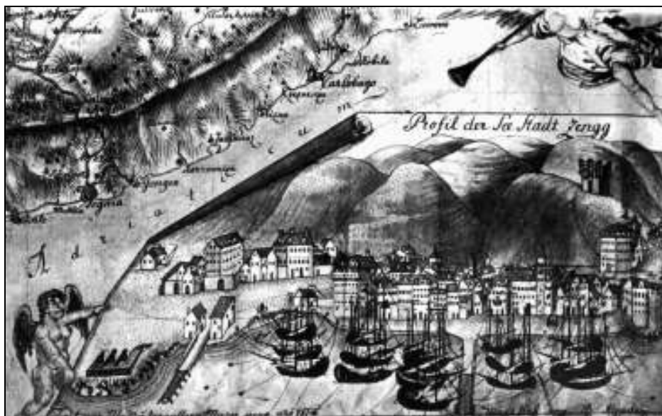
Sl. 4. Plan Senja iz 1814. (Austrijski državni arhiv Beč).

U drugoj polovici 17. st. Krajači se više ne spominju u povijesnim dokumentima u koprenom dijelu Hrvatske, ali se ubrzo pojavljuju u selu Ladviću kod Crikvenice, na bivšim frankopanskim imanjima.