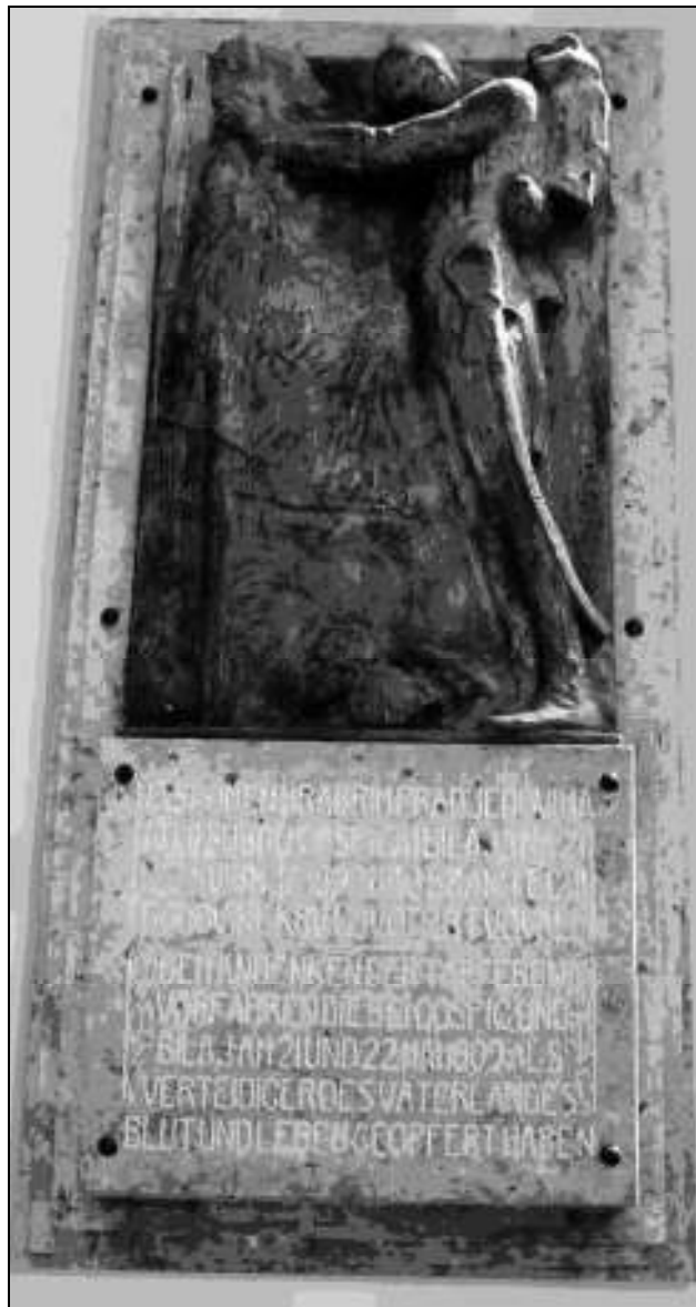
Sl. 9. Spomenik poginulim braniteljima u bitci kod Bilaja u gospičkoj katedrali: "U SPOMEN HRABRIM PRADJEDOVIMA KOJI SU KOD GOSPIČA I BILAJA NA 21. I 22. SVIBNJA 1809. GODINE KAO BRANITELJI DOMOVINE KRV I ŽIVOT ŽRTVOVALI", ( Hrvatski vojnik , broj 257)