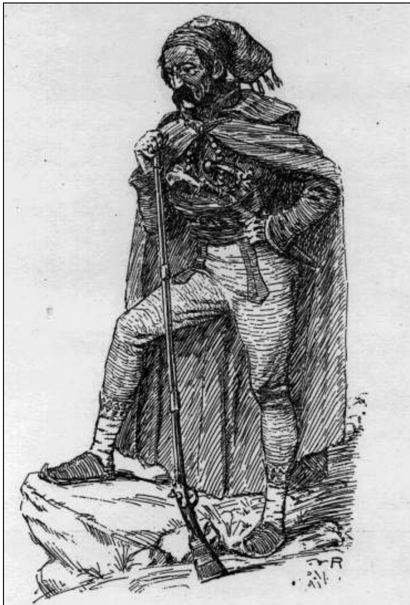
Sl. 8. Izgled habsburškog ratnika iz tog vremena (Milan VOJNOVICH, Bojevi u Lici, u ostaloj Hrvatskoj i Dalmaciji u godini 1809. , Zagreb, 1907.)