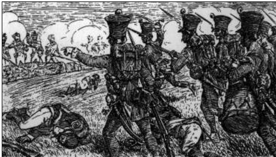
Sl. 1. Juriš u borbi (Milan VOJNOVICH, Bojevi u Lici, u ostaloj Hrvatskoj i Dalmaciji u godini 1809. , Zagreb, 1907.)

Naime, još od 1805., poslije habsburškog poraza kod Austerlitz, Austrija je mirom u Požunu (današnjoj Bratislavi) nekadašnju mletačku pokrajinu Dalmaciju prepustila Napoleonu, a on ju je priključio svom satelitskom Talijanskom Kraljevstvu. Ondje je bilo stacionirano oko 12000 - 15.000 francuskih vojnika zajedno s 1.000 lokalnih pandura i Nacionalnom gardom. Većina ovih snaga nije bila okupljena na jednom mjestu već je raspršena po garnizonima u Dubrovniku, Herceg-Novom, Kotoru i Zadru. Dio ratnih operacija u tijeku rata iz 1809. godine odvijat će se i na hrvatskim prostorima, kuda se iz Dalmacije prema Beču probijao francuski XI. korpus pod zapovjedništvom generala Marmonta. Tako će i Lika biti poprištem jedne vrlo teške i krvave operacije koja je doslovce devastirala ovo područje. Lika je u to vrijeme imala oko 40.000 stanovnika. 2