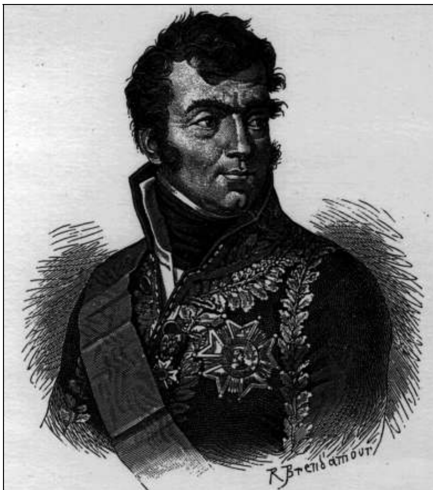
Sl. 3. General Marmont (Milan VOJNOVICH, Bojevi u Lici, u ostaloj Hrvatskoj i Dalmaciji u godini 1809., Zagreb, 1907.)

zatražio pojačanja, osobito snaga iz Senja kao i iz drugih okolnih područja. Nadređeno zapovjedništvo mu je odobrilo pričuvne bojne iz banskih pukovnija iz Gline i Petrinje koje su stigle u Otočac 9. svibnja. Jedna bojna upućena je kao pojačanje bojniku Šljivariću u Obrovac, a druga je zadržana na Zrmanji. Sada se moglo razmišljati o nastavku prodora prema Kninu čime bi Francuzima oduzeli operativnu osnovu za napredovanje prema Lici.