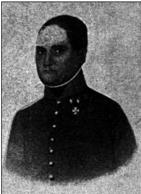
Sl. 7. Satnik Ivan Marojević (Milan VOJNOVICH, Bojevi u Lici, u ostaloj Hrvatskoj i Dalmaciji u godini 1809. , Zagreb, 1907.)

Marmont, koji je također razmišljao o povlačenju, pa čak i o mogućoj predaji, zbog velikih gubitaka i nedostatka hrane i streljiva, u okruženju neprijateljskog krajolika i stanovništva, nije mogao vjerovati kada je vidio da su se Austrijanci povukli. Odmah je zaposjeo Gospić i za protivnikom poslao samo lake postrojbe do Perušića. Za dalje trenutno nije imao snaga. Do 22. svibnja izgubio je 1.581 pripadnika, tako da je operativno spao na oko 6.000 uporabljivih ljudi. 15