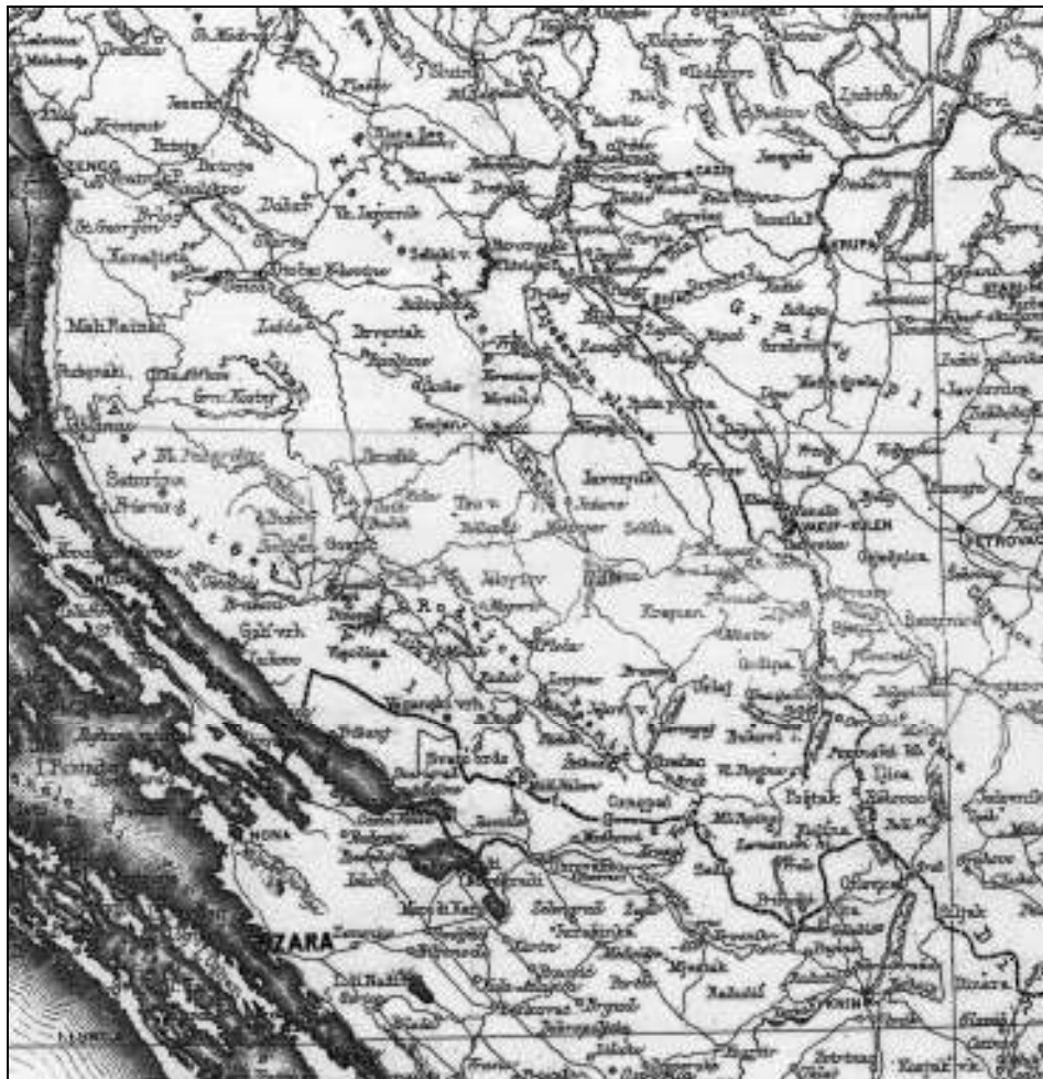
Sl. 2. Operativni prostor Marmontovog pohoda (Milan VOJNOVICH, Bojevi u Lici, u ostaloj Hrvatskoj i Dalmaciji u godini 1809. , Zagreb, 1907.)

Nakon neuspjeha kod Obrovca, Ervenika i Žegara Marmont usmjerava napade 30. travnja na vrlo važan kameni most kraj Kravibroda, gdje ih Prva lička bojna bojnika Kapchermenta junački odbija. U nastavku borbi Marmont usmjerava diviziju Montrichard na habsburško lijevo krilo, sastavljeno uglavnom od Slunjana koje u početku uspijevaju potisnuti i osvojiti dio njihovih položaja. Pregrupiranjem snaga pod satnikom Hrabovszkim i njihovim