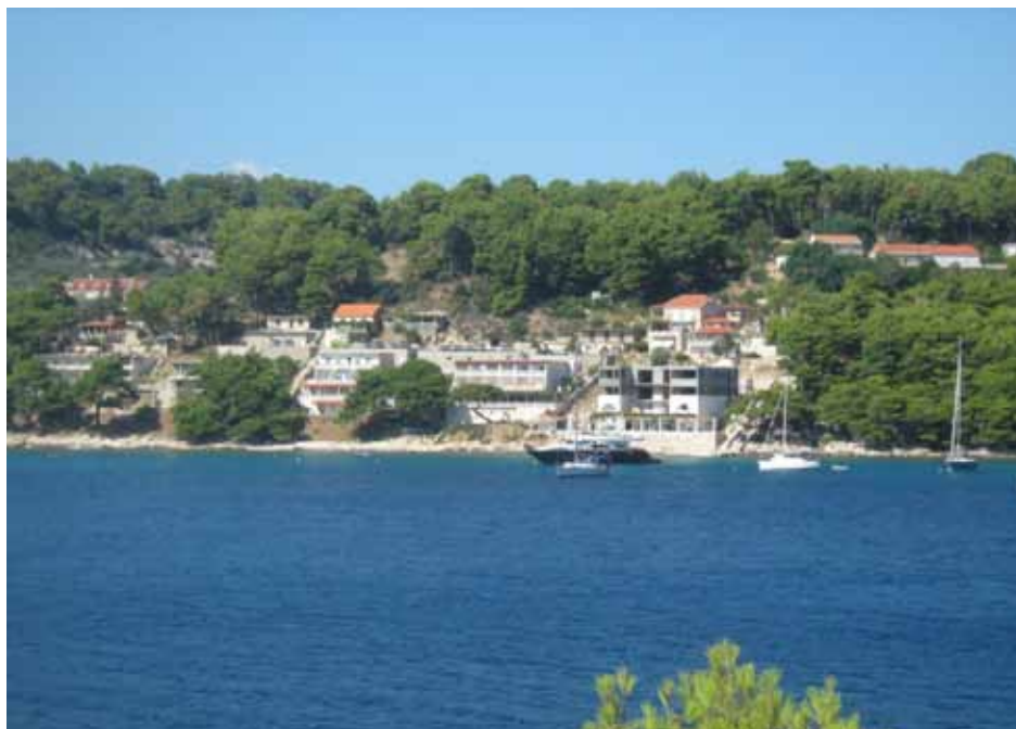
Sl. 3. Saplnara – primjer degradacije okoliša neplanskom gradnjom neprilagođenom lokalnim graditeljskim elementima (snimljeno: kolovoz 2011.)

Stanovnici smatraju da najveći problemi proizlaze iz neriješenih vlasničkih pitanja te nekvalitetnih i nedovoljno jasnih zakonskih propisa. Razvoj turizma, prema njihovu mišljenju, ponajprije potiče obnovu starih i napuštenih objekata, što dovodi do promjene izgleda naselja. S druge je strane NP „Mljet” u njihovoj percepciji subjekt koji značajno utječe na kontrolu gradnje, za što se izjasnilo dvije trećine ispitanika, dok ih polovina smatra kako Park tek otežava mogućnosti gradnje, ali ne utječe na izgled naselja i gradnju u skladu s tradicijom. Važno je istaknuti da dio ispitanika misli da je zabrana ili otežana mogućnost gradnje zapravo negativna jer stvara probleme za mlade koji bi htjeli ostati na otoku, ali se istovremeno odvojiti od roditelja. S druge pak strane NP „Mljet” drži da sadašnje restrikcije treba postrožiti jer se novi objekti grade unatoč zakonskim odredbama, a često morfološki i arhitektonski nisu usklađeni s ostatkom naselja. Posebni je problem nedosljedna i nepravovremena provedba zakona.