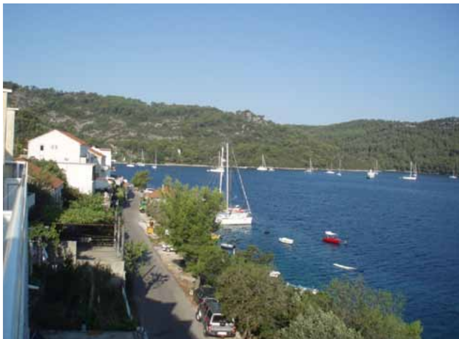
Sl. 4. Polače – uzurpacija obale i nautički turizam bez adekvatne infrastrukture (snimljeno: kolovoz 2011.)

Iako žive od turizma, stanovnici su itekako svjesni njegovih negativnih učinaka. Tako polovina ispitanika smatra da turizam utječe na snažnije onečišćenje okoliša otoka povećanjem količine otpadnih voda i krutog otpada te pojačanim onečišćenjem mora.