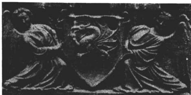
Sl. 3. — Donji dio grba I. Lenkovića iz 1552. s pročelja bivše crkve sv. Franje

6. Osim gradske i općinske kancelarije, te kaptola, u Senju je, kao i u većini primorskih gradova, djelovala i glagoljska kancelarija u kojoj su se sastavljale isprave na hrvatskom jeziku, a pisale na glagoljici. Glagoljski su notari imali isti položaj i radili na isti način kao i notari gore spomenutih kancelarija.