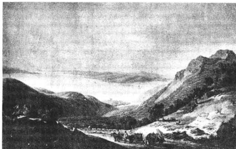
Sl. 6. – Pogled s prijevoja Vratnik na cestu Jozefinu i Senjsku dragu prema slici Fr. Jaschkea 1807. g.