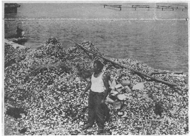
Slika 6. "Groblje" praznih ljuštura kamenice