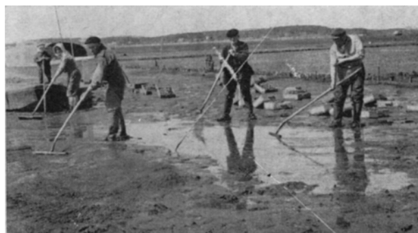
Slika 2. Uzgoj kamenica na dnu

U svijetu se, općenito, na dva načina uzgajaju kamenice. Prvi od njih, uzgoj na morskom dnu, primjenjuje se u sjevernim morima s velikim oscilacijama plime i oseke. On je neusporedivo jeftiniji od drugoga, tzv. mediteranskog načina. Kamenice koje se polože na dno prekrivene pijeskom, uzgajaju se do tržne veličine bez ikakvih dodatnih materijalnih ulaganja. Pritom, uzgajivač za vrijeme oseke odlazi na uzgajalište prikupiti štetočine (zvijezde, pužve) koji se hrane kamenicom, pa ih grabljama malo podigne iznad sedimenta (slika 2.).