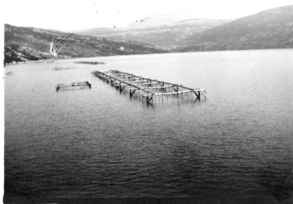
Slika 3. Mediteranski način uzgoja kamenica

Mediterranski način uzgoja primjenjuje se, naravno, u Sredozemlju, a odvija se između dna i morske površine (slika 3.).