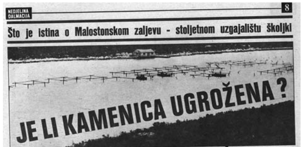
Slika 7. Je li kamenica ugrožena? "Nedjeljna Dalmacija"