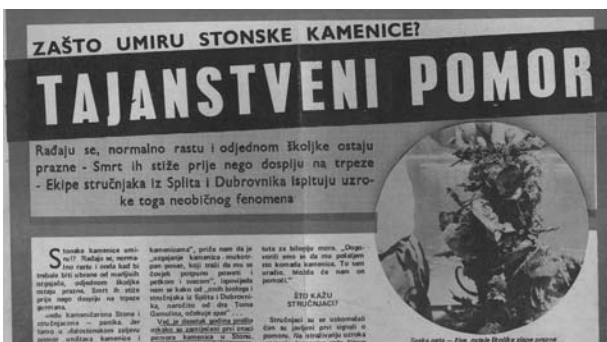
Slika 5. Tajanstveni pomor – Z. Reić, "Nedjeljna Dalmacija"