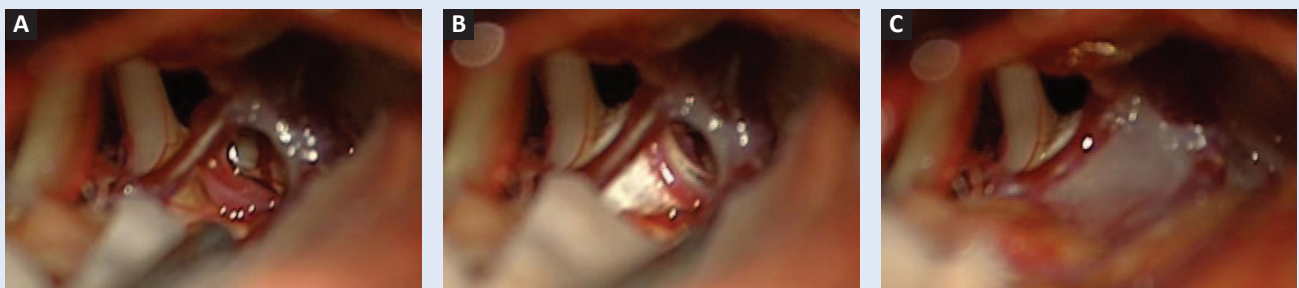
Slika 3. A) neurovaskularni konflikt s venom i manjom arterijom; B) vena i arterija odvojene od živca teflonskom spužvicom; C) fiksacija fibrinskim ljepilom (snimljeno operacijskim mikroskopom tijekom operacije) Figure 3 A) neurovascular conflict with a vein and minor artery; B) vein and artery separated from the nerve by teflon sponge; C) fixation by fibrin glue (pictures taken by operating microscope during operation)