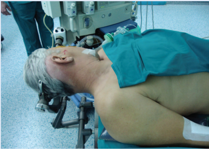
Slika 1. Smještaj bolesnika za mikrovaskularnu dekompresiju desnog trigeminusa (snimljen u operacijskoj dvorani prije operacije) Figure 1 Patient position for the MVD of the right trigeminal nerve (picture taken in the operating room before the procedure)

Kirurški pristup trigeminalnom živcu te njegovu disekciju i oslobađanje od kompresije prvi je opisao Walter Dandy 23 , dok je Janetta postavio temelje moderne teorije o neurovaskularnom konfliktu 24 . Danas se mikrovaskularna dekompresija trigeminusa smatra zlatnim standardom i metodom izbora liječenja kod bolesnika s neuralgijom trigeminusa i dokazanim neurovaskularnim konfliktom, jer predstavlja jedino uzročno liječenje. Danas samom operacijskom liječenju obično prethodi neroradiološka obrada, posebno snimanje MR-om takozvane CISS sekvencije u kojoj se može vizualizirati neurovaskularni konflikt. Intraoperacijski nalazi još više podupiru hipotezu o neurovaskularnom konfliktu kao uzroku neuralgije, najčešće je krvna žila koja komprimira živac gornja cerebelarna arterija koju autori