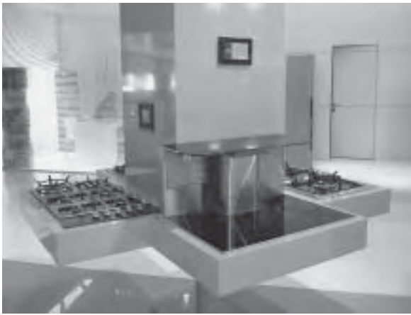
Slika 16. Novi koncepti kuhinjskih uređaja i pratećih elemenata, tvrtka Nardi