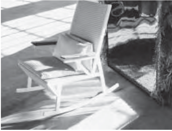
Slika 8. Stolica-ljuljačka Vieques , dizajn Patricia Urquiola, proizvođač Kettal

Od kada se dizajn etablirao kao neizostavan argument dobrog proizvoda koji povećava konkurentnost, proizvođači na sajmovima ističu autore svojih noviteta. Dizajnerski proizvod postaje razlog da se svaka tvrtka prezentira u punom sjaju. Tako proizvođači/ izlagači uz pomoć potpisa dizajnera ističu svoj proizvod uzdižu ga na pijedestal u punom sjaju, a sebe pokušavaju etablirati „uspješnijima“. Tako već godinama imena dizajnera koja su zabilježena ispod samog proizvoda (ili sad već obilježavaju i zidove!) postaju zaslužna za uspjeh, sjaj i nadmetanje među tvrtkama. Dizajneri postaju medijske zvijezde u pravom smislu. No, je li to opravdano ili ne, najčešće nakon nekog vremena pokazuje samo tržište.