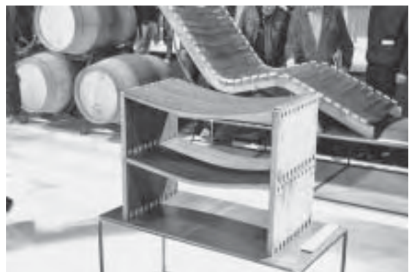
Slika 27. Koncept prenamjene gradbenih drvenih elemenata u novu oblikovnu funkciju

dim kreativcima koji su svojim radom već počeli stjecati utjecaj na međunarodnom tržištu- dizajnerima i umjetnicima iz drugih područja, te studentima dizajna kao jamstvu daljnjeg razvoja i održanja kvalitete i dizajna.