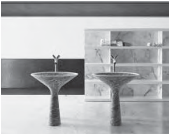
Slika 17. Skulpture u kupaonici, kolekcija Dry , dizajn Enzo Berti, tvrtka Kreoo by Decormarmi

Istraživanje novih materijala, ali i primjena starih u novome površinskom ruhu te nenadmašni oblici i konstrukcije vode konačnom cilju – ugodni i opuštanju u oazi čistih mirisnih snova. Napredak u kiparstvu pridonio je široj upotrebi prirodnog kamena, što se ogleda i na području kupaoničkog namještaja, s vrlo visokom kvalitetom završne obrade. Odličan je primjer tvrtka Kreoo (sl. 17). Dizajn i obrtništvo tako su spojeni u vrhunske proizvode, a sve je podržano najnovijim tehnologijama.