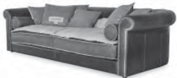
Slika 6. Trosjed Alfred , dizajn Draga Obradovic i Aurel K. Basedow, proizvođač Baxter