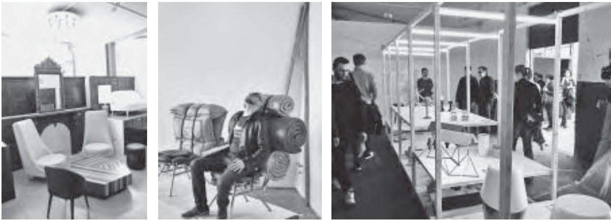
Slika 23. Atmosfera u zoni Ventura Lambrate