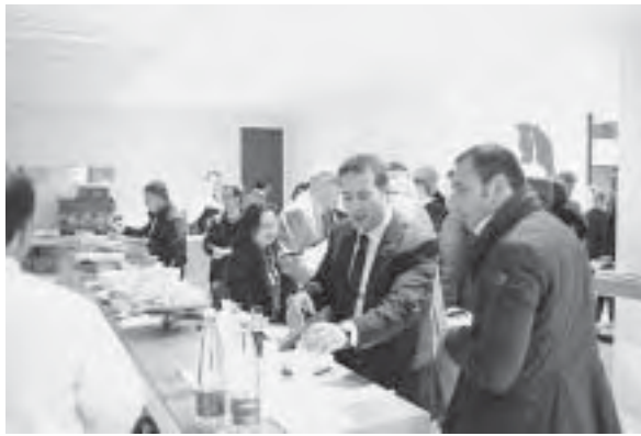
Slika 11. Atmosfera u paviljonima Eurocucine

ma kao važan estetski detalj istaknuli zdrave kvrge, male pukotine te nehomogenost građe drva. S obzirom na to da prevladava cjelovito drvo, cilj mnogih dizajnera bio je naglasiti i istaknuti spojeve i vezove. Nezaobilazni dio svake kuhinje je okov (svakoj kuhinji daje neku drugu eleganciju) i elektronika koja korisniku olakšava upotrebu.