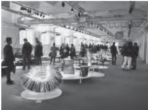
Slika 1. Atmosfera izvan sajma, zona Tortona

Neke su značajke i dalje u trendu i, odlično su vidljive u spomenutim paviljonima. Bijela ili svijetla pastelna boja (krem, siva), bijelo obojena stakla ili pastelne tkanine i koža neizostavni su na većini elemenata namještaja, bez obzira na to je li riječ o komodama ili blagovaoničkim stolovima, ojastućenom namještaju (sl. 2), kuhinji, spavaćoj sobi (sl. 3), dnevnom boravku ili nekom drugom prostoru u stanu.