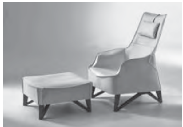
Slika 2. Ojastučena garnitura Mobius , dizajn Asnago, proizvođač Giorgetti