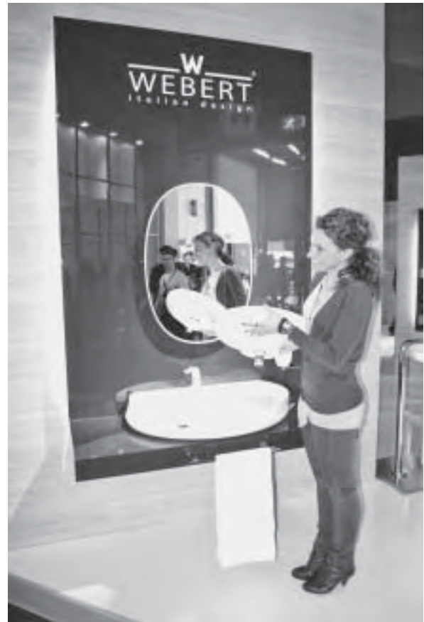
Slika 18. Novitet tvrtke Webert: umivaonik se odvaja od postolja, što olakšava održavanje.

Salone Satellite je, kao i svake godine, bio posvećen mladim dizajnerskim nadama, mlađim od 35 godina te je privukao pozornost brojnih proizvođača, a ove je godine u dva paviljona ugostio mnoge profesionalne di-