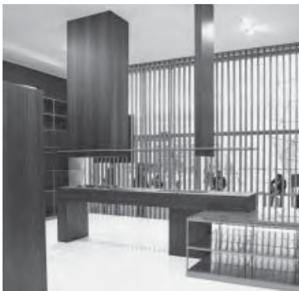
Slika 12. Profinjena elegancija suvremene kuhinje

U paviljonu posvećenome tehnologijama u kuhinji izlagali su svi važniji europski proizvođači bijele tehnike, kućanskih aparata ali i okova, koji su nezaobilazan dio svake suvremene kuhinje (sl. 15). Za srednju klasu kućanskih aparata ušteda električne energije i vode vrlo je bitna, pa su aparati energetske visoko štedljivi, nasuprot luksuzu u kojemu taj parametar i ne