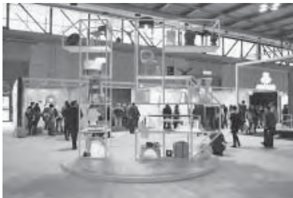
Slika 20. Instalacija police u obliku broja 15, s prikazanim najuspješnijim proizvodima posljednjih 15 godina Salone Satelitea

Na Salone Satellite osobita se važnost pridaje kvaliteti obrazovanja pa su tradicionalno pozvane brojne škole iz cijelog svijeta. Ove se godine odazvalo 17 dizajnerskih škola, od kojih su neke sudjelovale prvi put. To su: American University of Sharjah, Ujedinjeni Arapski Emirati; Art Future design School iz Rusije; Centro de Investigaciones de Diseño Industrial iz Mek-