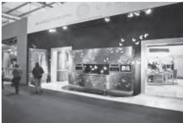
Slika 5. Izložbeni prostor tvrtke Bordington