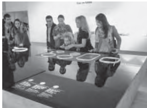
Slika 15. Noviteti na štandu tvrtke Elektrolux

Šum vode, miris drva i bilja protezao se duž dvaju paviljona posvećenih kupanju, čistoći, uživanju i opuštanju. Unatoč financijskoj krizi koja je proteklih godina oslabila brojne proizvođače i tržišta, sektor proizvodnje kupaoničkog namještaja nije previše osjetio recesiju. Kupaonice su zaista raskošnije nego ikada!