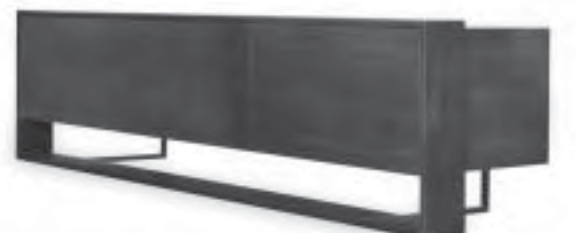
Slika 7. Radni stol i komoda iz kolekcije Bourgeois , dizajn Matteo Thun i Antonio Rodriguez, proizvođač Baxter