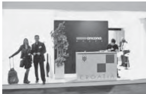
Slika 14. Tvrtka Ancona Đakovo na Eurocucini 2012

postoji. Uz novitete u kućanskim aparatima, izloženi su i novi koncepti njihova slaganja i oblikovanja kuhinjskog prostora (sl. 16).