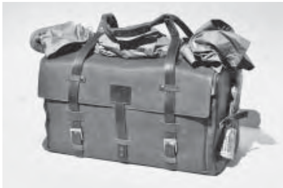
Slika 26. Torba Tovar dizajnerice Maje Mesić, proizvođača Galko, u sklopu izložbe Design Tourism: Croatian Holiday 2012

i uključivanju nekoliko zanimljivih već realiziranih proizvoda, izložba ima za glavni cilj pokrenuti raspravu na temu nužnosti povezivanja dizajna i turizma u zemlji, a dotiče se tema turističkog iskustva zemlje čija se ekonomija uvelike oslanja na tu gospodarsku granu, pitanja odnosa nasljeđa i suvremenosti, ponude i potrošnje identiteta, ali i sustavne strategije nasuprot stihijskom pristupu“ (više na: http://dizajn.hr/#/1028-dizajn-turizam-proizvodi-hrvatskih-dizajnera-na-venturi-lambrate/ ). Radovi 15 hrvatskih dizajnera i dizajnerskih timova na duhovite, inteligentne i polemične načine tematiziraju vezu dizajna i turizma, njegovih klišeja, konvencija, identiteta i potencijala. Primjer je i proizvod simboličnog naziva Tovar , autorice Maje Mesić, proizvođača Galko (slika 26), koji spaja tradicionalne elemente i idealno ilustrira promijenu uloga u metaforičkom ali i funkcionalnom smislu. Tovar nije samo torba, već spoj praktičnosti, izdržljivosti, otpornosti i funkcionalnosti i, moramo priznati, dobro bi nam došao na sajmu za pohranu i nošenje svih kataloga, časopisa, knjiga i CD-ova prikupljenih na sajmu!