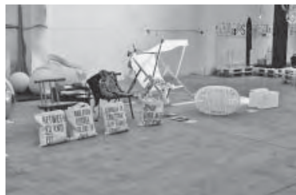
Slika 25. Hrvatski dizajneri na Ventura Lambrate , Design Tourism: Croatian Holiday 2012