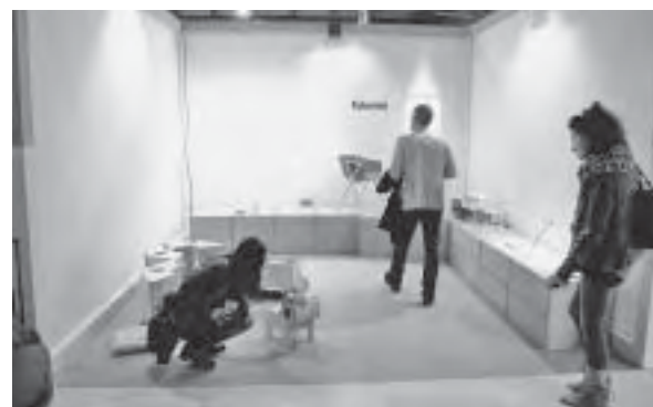
Slika 21. Atmosfera na Salone Sateliteu