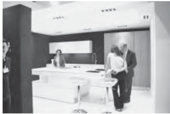
Slika 13. Izlagački prostor hrvatske tvrtke Ancona Đakovo, Eurocucina 2012