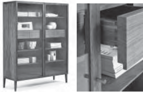
Slika 9. Vitrina Light , dizajn Matteo Thun, proizvođač Riva 1920.

Svake druge godine popularno zvani „kuhnjari“ i njihove tehnološke pratilje pod nazivima Eurocucina i