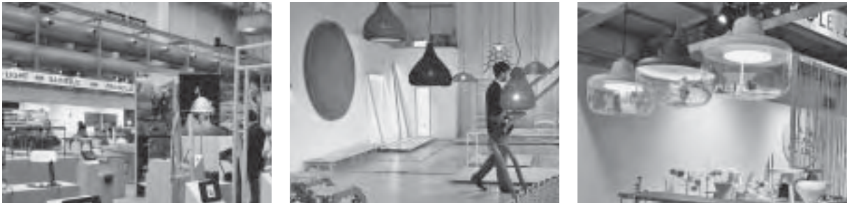
Slika 24. Atmosfera u zoni Tortone

strijsku zonu grada, ali i potaknulo novo zanimanje profesionalaca, novinara i javnosti za suvremenu dizajnersku produkciju. O utjecaju projekta Ventura Lambrate govori i činjenica da se u protekle tri godine iz Milana i Italije proširio i na Berlin, a uskoro će osvojiti i Belgiju.