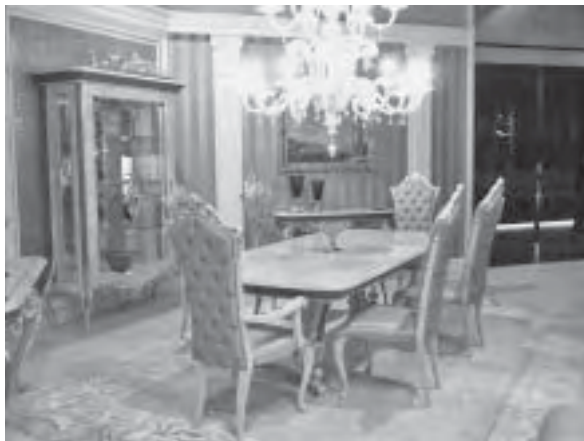
Slika 4. Blagovaonička garnitura, izlagač Turri, paviljon Classic

No da sve retro nije nužno u sukobu s dobrim ukusom, pokazali su pojedini elementi namještaja poput sofisticiranih i elegantnih elemenata iz kolekcije Bourgeois , radni stol i komoda tvrtke Baxter dizajnera Mattea Thuna i Antonia Rodrigueza (sl. 7).