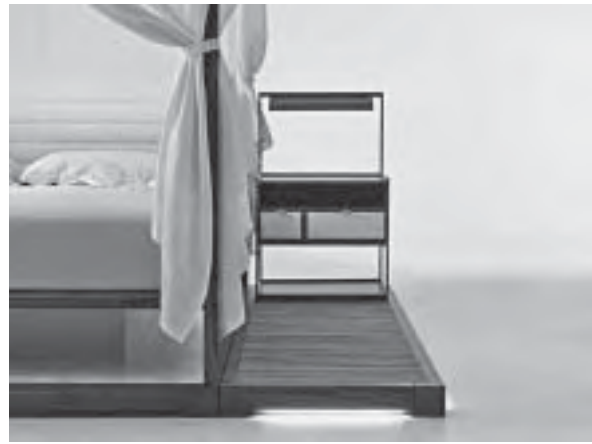
Slika 3. Profinjena elegancija spavaće sobe: krevet i noćni ormarić iz garniture IRA dizajnera Chi Wing Loa, proizvođač Giorgetti

Bijela je boja obvezno „začinjena“ toplim drvom (što je vidljivo na svim prikazanim primjerima, nap. a.), ovog puta isključivo mat površinske obrade. Najčešća je uporaba orahovine, nešto rjeđa hrastovine (natur, blago četkane) i egzota. Bukovine ili drva javora moglo se naći samo u tragovima.