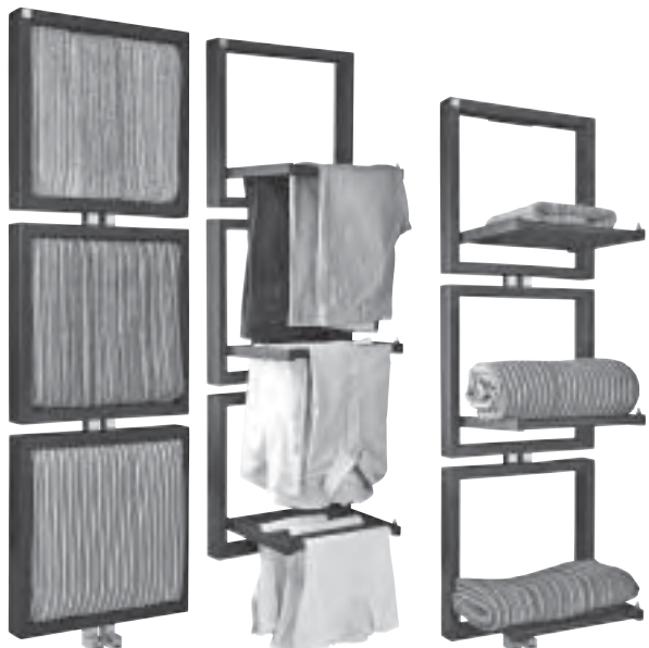
Slika 19. Funkcionalna skulpturalnost radijatora tvrtke Deltacolor

zajnere i fakultete dizajna iz cijelog svijeta. Okupio je, prema podacima Press centra, oko 750 najperspektivnijih međunarodnih mladih dizajnera, nudeći im mogućnost suradnje s proizvođačima. Ta izložba uvijek nastoji biti orijentirana prema budućnosti, a ove je godine imala temu Dizajn<->Tehnologija . Sukladno osnovnoj temi, prikazana je i glavna instalacija na izložbi koja je objedinila 15 interpretacija, rad 15 dizajnera- bivših i sadašnjih predstavnika Salone Satellite (sl. 20).