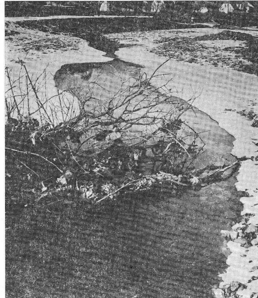
Otpadne vode suhe destilacije drveta »Velimir Jakić«

U čitavom sklopu otkrivanja zagađivača sliva rijeke Čehotine za nas je najinteresantniji lokalitet urbane sredine grada Pljevlja. Grad leži na tri rijeke: Čehotini, Vezičnici i Breznici i ima preko 15.000 žitelja.