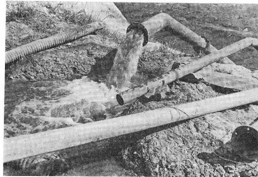
Otpadne vode iz rudnika Pljevlja