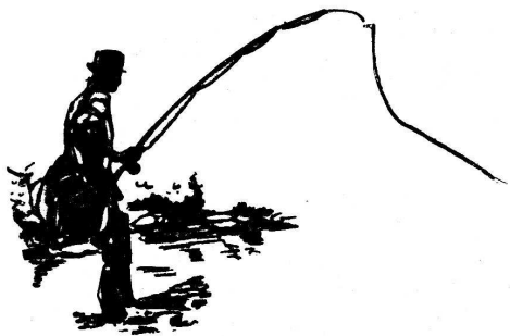
Cane Janičjević, Pljevlja