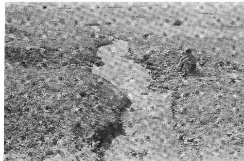
Kanal ugljenokopa koji utiče direktno u rijeku Čehotinu

Ekstremne temperature iznose u pojedinim mjesecima: minimalna 0,0°C i maksimalno 15,6°C u pomenutoj godini.