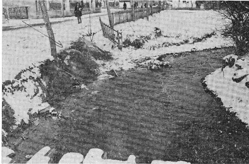
Smetice na rijeci Breznici iznad pekare