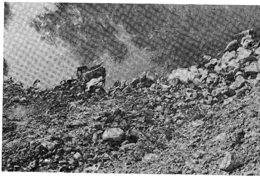
Smetlište na putu Pljevlja—Gradac poduzeća za komunalne poslove

Mehanička radionica i garaža je locirana na periferiji grada neposredno uz sam dnevni kop Rudnika uglja, na drugoj strani »Đuline guke« i sa desne strane toka rijeke Čehotine. Radionica i garaža je udaljena od radionice »Građevinara« oko 250 m i sa pomenutim radionicama spojena betonsko-kamenim kanalom.