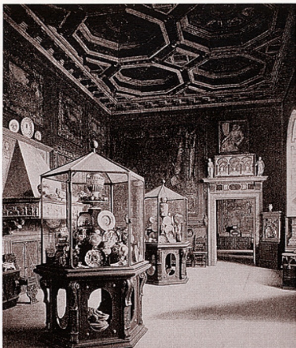
“Talijanska dvorana” bavarskog Nacionalnog muzeja.

bama posjetitelja, a ne nužno znanstvenika. Pokoja zajedljiva kritika o krivotvorenju povijesti mogla je umanjiti uspjeh izgradnje Muzeja. U njegovu daljnjem razvoju uklonjene su kopije; Seidlova arhitektura već za vrijeme Trećeg Reicha više nije odgovarala potrebama, te je postav reduciran. Nakon teških ratnih šteta prvobitna ideja o stalnom postavu Muzeja nije se više mogla pratiti. Treba nešto reći i o Deutsche Museum u Münchenu. Oskar von Miller, osnivač toga muzeja, razvio je svoju zamisao još posljednjih godina 19. stoljeća pod dojmom tehničkih muzeja u Londonu i Parizu. Skupljanje tehničkih naprava imalo je tradiciju i u münchenskom vladarskom domu sve od kasnoga srednjeg vijeka i renesanse. Neupitan optimizam i vjerovanje u napredak tehnološkog razvoja kao i mogućnost isticanja nacionalnih odrednica, poduprli su razmi-