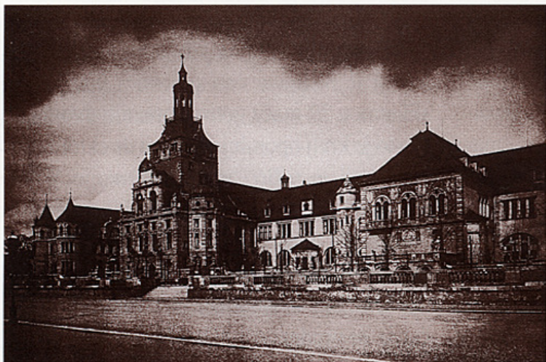
Dio bavarskog Nacionalnog muzeja.

prije toga imali prilike u starome Nacionalnom muzeju vidjeti svoju oglednu zbirku i povezati procvat bavarskoga obrtničkog staleža s Muzejom, koji je trebao postati spomenik umjetnosti i obrta u Bavarskoj. Narodnu umjetnost trebalo je predstaviti uz krajevsku.