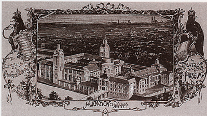
Prospekt iz 1906. Deutsches muzeja, München.

Bavaria is a region of Germany with almost 1200 museums, half of them founded in recent years. Such a great concentration draws its roots from the historical circumstances like the collections of the ruling house of Wittelsbach that led to the creation of museums, the cultural policy of Ludwig I and his heir Maximilian II, the influence of the Germanic National Museum in Nürnberg that later on became a model for many local museums. The author provides a broader explication of all these factors, and also explains the creation of the German Museum in Munich, the prototype of technical museums.