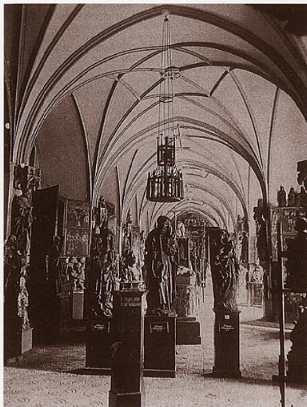
Crkvena dvorana u starom bavarskom Nacionalnom muzeju, Maximilianstrasse, München.

1. početak skupljanja novih tematskih zbirki obuhvaćenih oznakom Altertumer . U tome su sudjelovale bavarska Akademija za znanost, koja je od 1807. preuzela i arheologiju, po-