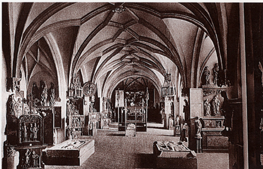
"Crkvena dvorana" bavarskog Nacionalnog muzeja.

Izložba je na taj način više odgovarala potre-