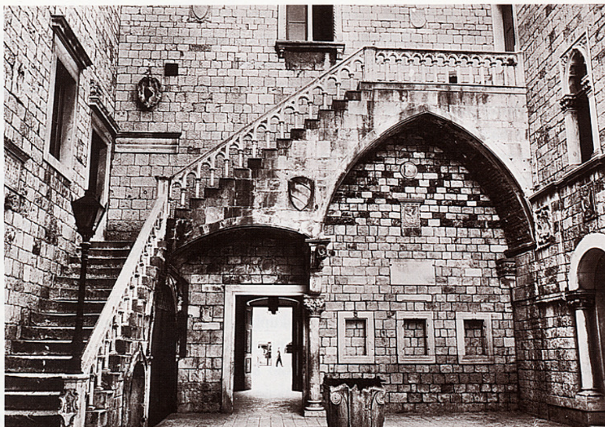
Dvorište Gradske vijećnice danas.

to veliki pomak. Domaći ljudi na čijim su se imanjinama nalazili istraživani lokaliteti našli su svoj interes u prodaji ulomaka. Svijest o tome kako se ulomci moraju sačuvati na mjestu nalaza, nažalost, tada još nije bila razvijena. Ipak, barem su bili novčano stimulirani tako da nisu imali razloga uništavati nalaze, što je inače, ako nije bilo materijalne stimulacije, bilo i te kako česta pojava.