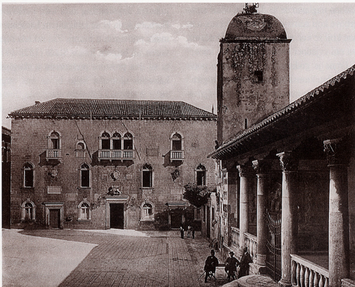
Trogirski trg, iz mape "Trogir" Ćirila Ivekovića, 1928.

Mnoge su se crkvice rušile, pojedine palače također, te se pojavila veća količina kamenih ulomaka koji su trebali biti negdje pohranjeni. Dvorišni dio Gradske vijećnice, mjesto vladanja i boravka kneza, tada samo gradonačelnika, činio se najprikladnijim za muzejsku zbirku grada - lapidarij. Općinska je uprava 1893. imala namjeru pokupiti sve grbove plemićkih obitelji grada i uzidati ih u dvorište palače za vrijeme njezine obnove. Don Frane Bulić(1846-1934) 54 kao glavni konzervator podržao je tu zamisao, ali je