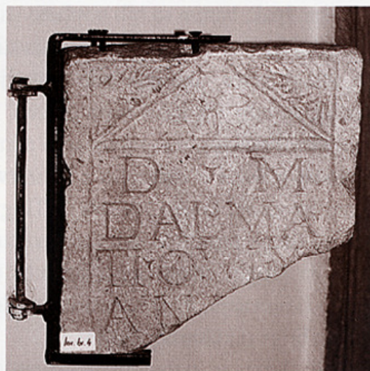
Isti natpis, danas u stalnom postavu Muzeja grada Trogira.

2 lire te od Ivana Bare nekoliko ulomaka za 96 lira. 45 Ni o njima se ne daju detaljniji opisi pa nam nije poznato o kojim je ulomcima riječ. Samo nam je na temelju spomenutih nacrti danas poznato koji se sve