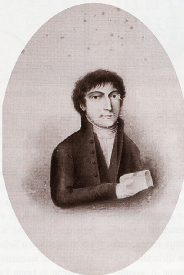
Ivan Luka Garagnin, akvarel na papiru, XIX. st.

rića za 48 lira. 34 Godine 1803, 17. siječnja, kupljena je i u Split prebačena jedna antička mramorna statua bez glave. Statua je plaćena 96 lira, prijevoz je stajao 12 lira, te je uz dodatne troškove isplaćeno je ukupno 108 lira. 35 Nažalost, opis otkupljenih ulomaka nije sačuvan tako da nam nije poznato o kojim je ulomcima riječ.