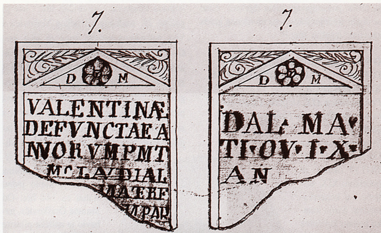
Nadgrobnni natpis korišten dva puta, iz crteža I. Danila, XIX. st., Muzej grada Trogira

Slijede navodi o tome kako je Ivan Luka godine 1805. službeno nastavio tu djelatnost. Glavnim nadzornikom za sve antičke spomenike i umjetničke predmete u Dalmaciji, kao i za sva iskopavanja, imenovan je 5. travnja 1805. Bilo je to u doba dok je Austrijom vladao Franjo I. Program rada što ga je dobio Garagnin obuhvaćao je sve njegove dužnosti, ulogu konzervatora, sporazume s vlasnicima, potrebu rekognosciranja terena, izradbu kataloga, zapošljavanje djelatnika i vođenje potrebne dokumentacije o svemu. 36 Navodi se kako su napuci bili donekle bliski današnjem shvaćanju muzejske djelatnosti, pa se može kazati da su zapravo počeci te djelatnosti. Arheološki lokaliteti štitili su se odlukom prema kojoj bi se zaustavljali radovi u polju ako bi se na tom tlu otkrili arheološki nalazi. 37 Dakle, to su i počeci konzervatorstva. Međutim, iz Lukine korespondencije očito je kako je bečku Vladu zanimalo samo skupljanje grade za njihove zbirke i otkup. Car je namjeravao sačuvati pokretne i nepo-