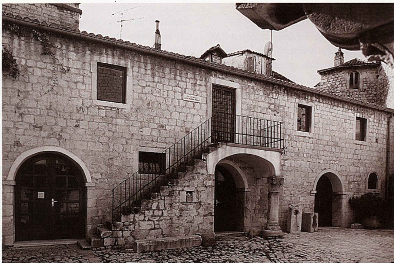
Lapidarij Muzeja grada Trogira.