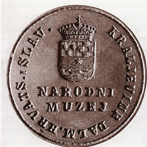
Pečatnjak Narodnog muzeja Kraljevine Dalmacije, Hrvatske i Slavonije, rabljen nakon 1868. g. (HPM/PMH 14731).

doslovnu gradu. Pritom su se kriteriji skupljanja temeljili na dobrovoljnim novčanim prilozima i poklonima rodoljuba te na odabiru nacionalno reprezentativnog kulturno-povijesnoga i prirodnog blaga 10 . (Najprije su nastale zbirke prirodnina, koje su sadržavale modele ili "tvorila" gospodarskih strojeva, rude, fosilne ostatke te primjerke flore i faune iz različitih hrvatskih krajeva. U sastav, pak, "starinarske" zbirke među prvim su predmetima ušli stari novac, gipsani odljevi medalja, pečatnjaci, arheološki predmeti te rijetki primjerci zemljovida i umjetničkih djela. Glasilo Gospodarskog društva "List mesečni" objavljivalo je od 1843. g. kao izraz zahvale imena darovatelja, među kojima su prvi bili zagrebački biskup i banski namjesnik Juraj Haulik, bistrički kapelan Stjepan Mlinarić te umirovljeni major Mijat Sabljar. Posljednji je, prema istim navodima, već od 1843. g. namjenski prikupljao različite predmete za Muzej, i to na poticaj Gospodarskog društva i o njegovu trošku. 11 )