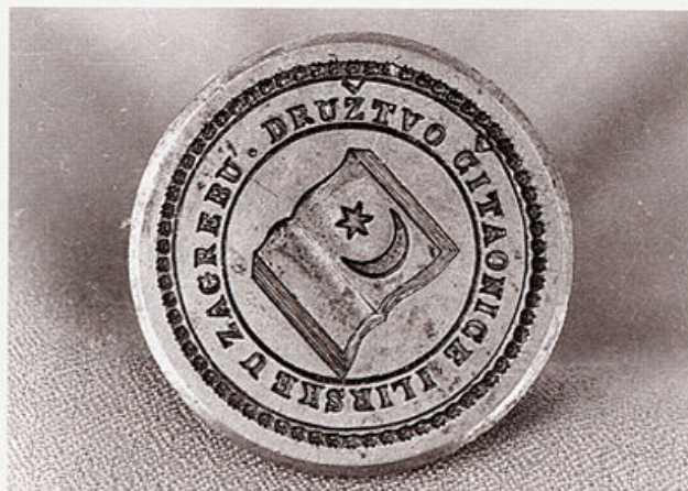
Pečatnjak Društva Ilirske čitaonice u Zagrebu iz 1838-1850. g. (HPM/PMH 14735).