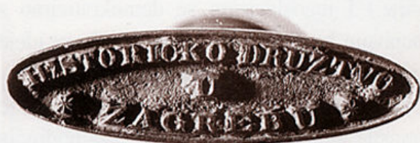
Pečatnjak Historičkog društva u Zagrebu s kraja 19. st. (HPM/PMH 14736).