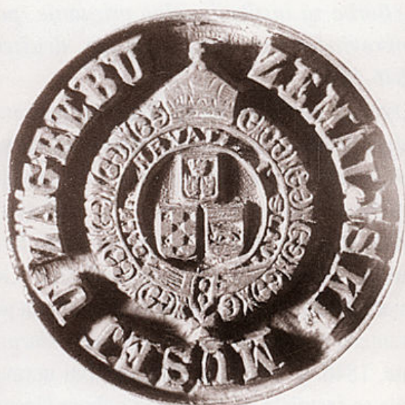
Pečatnjak Zemaljskog muzeja u Zagrebu iz 1854-1866. g. (HPM/PMH 14733).