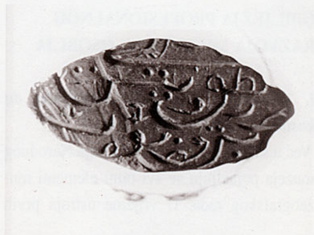
Turski pečatnjak (HPM/PMH 14727) koji je 1856. g. za Narodni muzej nabavio M. Sablja