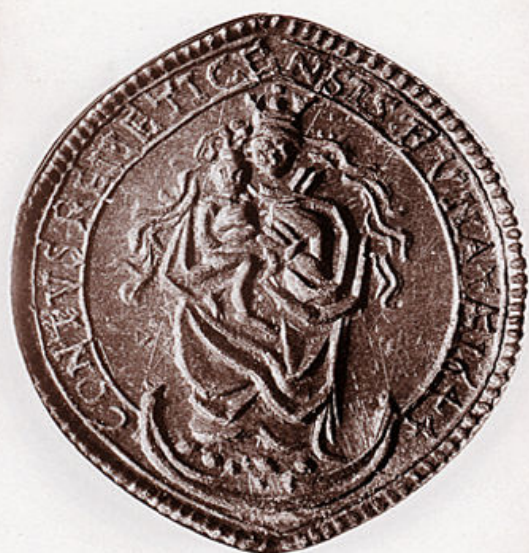
Pečatnjak samostana u Remetincu iz 1644. g. (HPM/PMH 2889); pripada najstarijem dijelu fundusa Narodnoga muzeja, kamo je dospio poklonom 1852.

Narodnog doma bile “pohranjene” starine, u drugoj “bijahu izloženi sisari, ptice i druge prirodnine”, u trećoj je bila smještena zbirka kukaca i leptira, gdje je “radio i u radu oslipeo Mijat Sabljara, otac i tvorac našega muzeja”, u četvrtoj “bijahu izložene okamine”, dok su posljednje dvije sobe “zapremile razne slike”. Sudeći prema istim izvorima, od otvorenja muzejske izložbe naglo se počeo povećavati i broj darovatelja pa se uz numizmatičku i arheološku građu ubrzo otvorila knjižnica , u čiji su sastav, također, ušli rukopisi, listine i slike. Pritom je narastao i broj prirodoslovnih zbirki — minerala, ruda, okamina, ptica, ljuštura, kukaca, kostura i raznih drugih zooloških, botaničkih, entomoloških i geognostičkih predmeta. 15 (“List mesečni” objavio je u br. 10. za listopad 1847. g. da se Muzej sastoji od 13 “sbirki”: 1. Zemljovida i mestopisa; 2. Minerološke, 3. Botaničke, 4. Zoologičke, 5. Arhaologičke, 6. Numismatičke, 7. Pečata i sadrenih slika, 8. Archiva, 9. Rukopisa, 10. Narodne knjižnice, 11. Cabinetu physikalnog 12. Artističke sbirke 13. Kiposhrana. 16 ) U to su vrijeme i