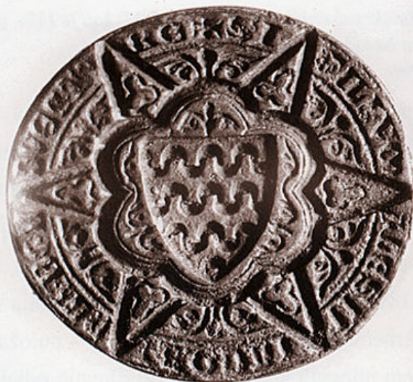
Osobni pečatnjak Aleksija Jakova (HPM/PMH 2879) postao je vlasništvo Narodnog muzeja 1871. g. posredovanjem muzejskog povjerenika iz Trsta

Već u samim počecima djelovanja Narodnog muzeja pojavljuju se svi bitni elementi muzeografskog rada. U vrijeme ustroja prvih