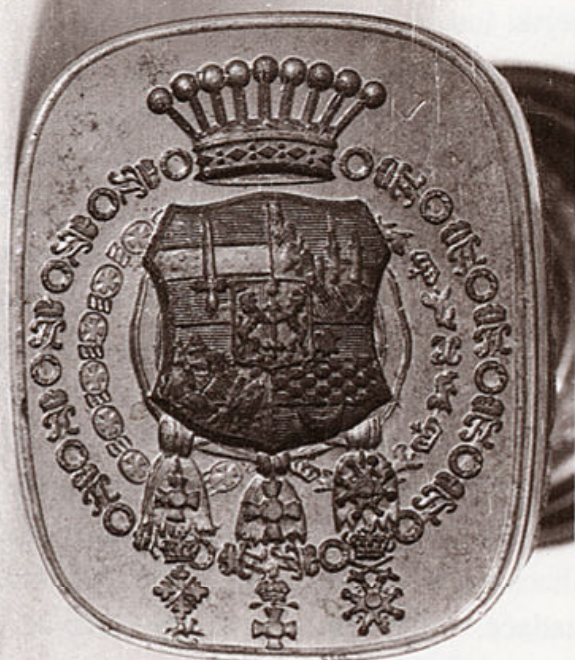
Pečatnjak bana Josipa Jelačića (HPM/PMH 25700) nalazi se u Narodnome muzeju od 1937. g. te pripada najatraktivnijem dijelu njegova fundusa

unutar Muzeja. Glavna se obilježja toga zakonskog akta mogu sažeti u nekoliko osnovnih točaka: a) razmjerno povećanju broja odjela unutar Narodnog muzeja, povećavala se količina i raznolikost specifičnih poslova u Muzeju, kao i broj uposlenoga muzejskog osoblja; b) termin kustos , ili muzealni čuvar privremeno nestaje iz uporabe, a glavne stručne poslove u Muzeju, osim ravnatelja , obavljaju pristavi , muzejski pomoćnici i preparator ; c) različiti su statusi ravnatelja u pojedinim muzejskim odjelima - dok je u dva Prirodoslovna odjela funkcija ravnatelja manje - više volonterska i počasna, u Arheološkom je odjelu ona redovit , plaćen , stručni rad ; d) posao muzejskog pristava posredno se definira kao specifično, stručno i plaćeno zanimanje za čije se obavljanje zahtijeva i posebna stručna naobrazba ; e) poslovi muzejskog pristava još se uvijek djelo-