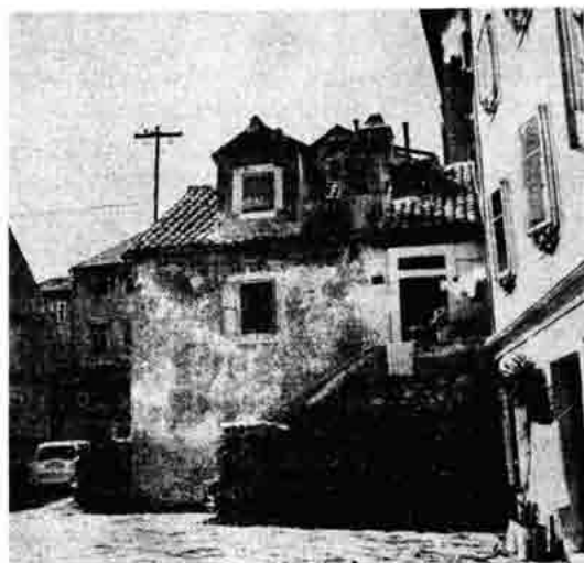
Sl. 12. – Mali trg »Dvorac«, stara kuća, osebujni pučki arhitektonski spomenik porušen iz nehata 1987.