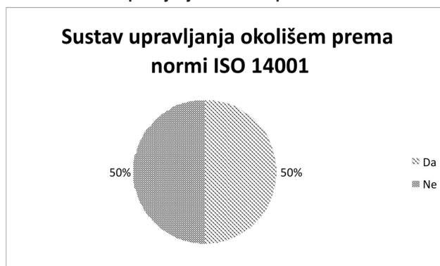
Slika 3. Sustav upravljanja okolišem prema normi ISO 14001

Rezultati su pokazali kako 50% ispitanih poduzeća u potpunosti u praksi primjenjuje sustav upravljanja okolišem prema normi ISO 14001 te je time norma dio njihove poslovne strategije, dok druga polovica ispitanih poduzeća (50%) ne primjenjuje sustav upravljanja okolišem prema normi ISO 14001.