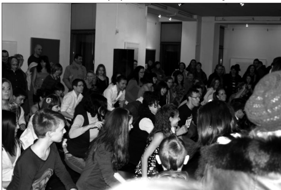
Slika 1. Salsa u Galeriji „Vjekoslav Karas“ u Karlovcu 2012. godine