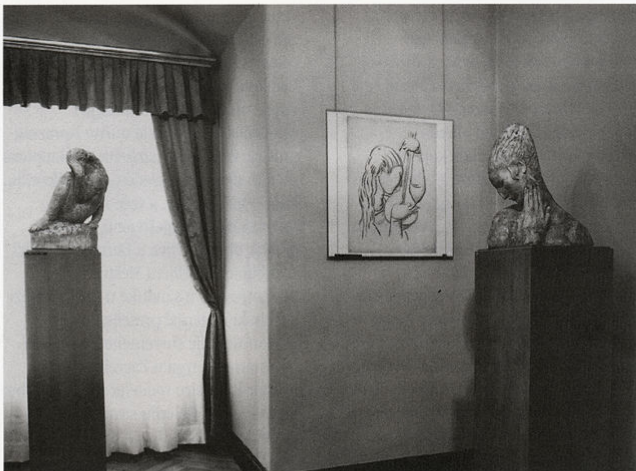
Stalni postav djela Ivana Meštrovića u kući Atelijera Meštrović, 1969. godine.

uređenja i postava muzeja i izložbe odnose se ponajprije na tematski i estetski kriterij te na izvedbeni materijal izabranih djela Ivana Meštrovića, što je prilagođeno zadanim otvorenim i zatvorenim prostorima Atelijera Meštrović. Svaki od tih prostora određuje posebnosti u pristupu i doživljaju prostora i izložaka. S povećanjem nadsvijetla i prozora u gotovo staklenu stijenu, dogradnjom galerije i posebnim načinom električnog osvjetljenja izložaka u atelijeru je ostvareno toplo i intimno ozračje i cjelovit doživljaj umjetnina. Dipl. ing. arh. Miroslav Begović dobio je za projekt arhitektonskoga i interijerskog rješenja s izvedbom Nagradu grada Zagreba za 1963. godinu. Stalni postav u atriju, atelijeru i dvorištu nije se mijenjao do danas.