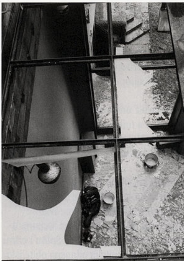
Oštećenje atelijera Atelijera Meštrović u raketiranju Banskih dvora u Zagrebu, 7. listopada 1991. godine.