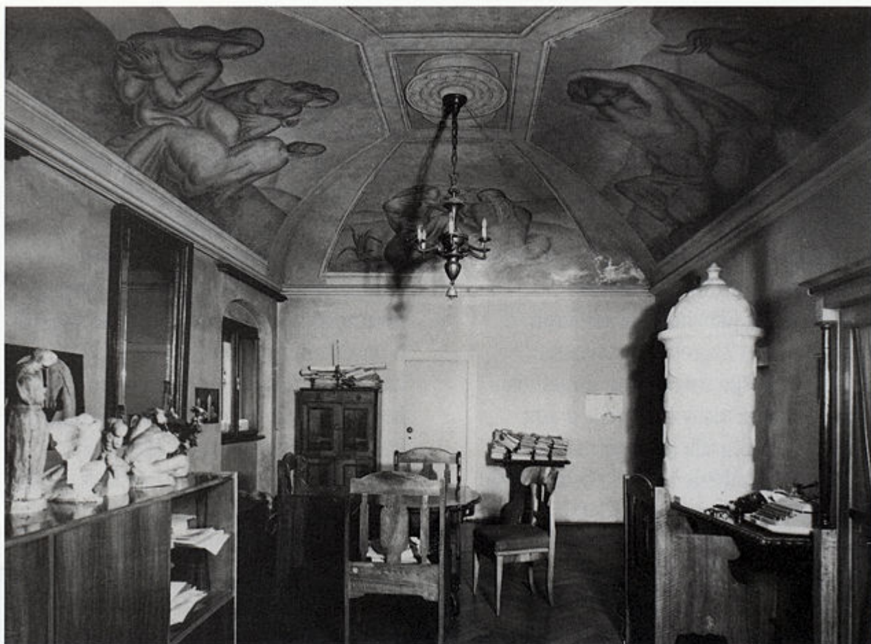
Spavaća soba Ivana Meštrovića kao radni prostor kustosa u Atelijeru Meštrović prije adaptacije u izložbeni prostor.

predviđenih za izlaganje. Izložene su skulpture lijevane u Ljevaonici umjetnina Likovne akademije u Zagrebu (petnaest skulptura 1962. i dvije 1963. godine). Skulptura Povijest Hrvata (1932) izložena je u gipsu do 1964, kada je izlivena u broncu i otada je izložena u bronci. Skulptura Majka u razmišljanju (1930) također je bila izložena u gipsu do 1964, kada je kipar Grga Antunac prenio skulpturu u prilepski mramor. Dana 6. rujna 1963. godine "svečano je otvorena stalna izložba skulptura Ivana Meštrovića u atriju, atelijeru i dvorištu Atelijera Meštrović u Mletačkoj ulici 8 u Zagrebu. Izložene su 44 skulpture (26 umjetnina u bronci, 7 u mramoru, 5 od različitih vrsta kamena, 4 u drvu i 2 u gipsu) i 1 crtež. Izložene je umjetnine