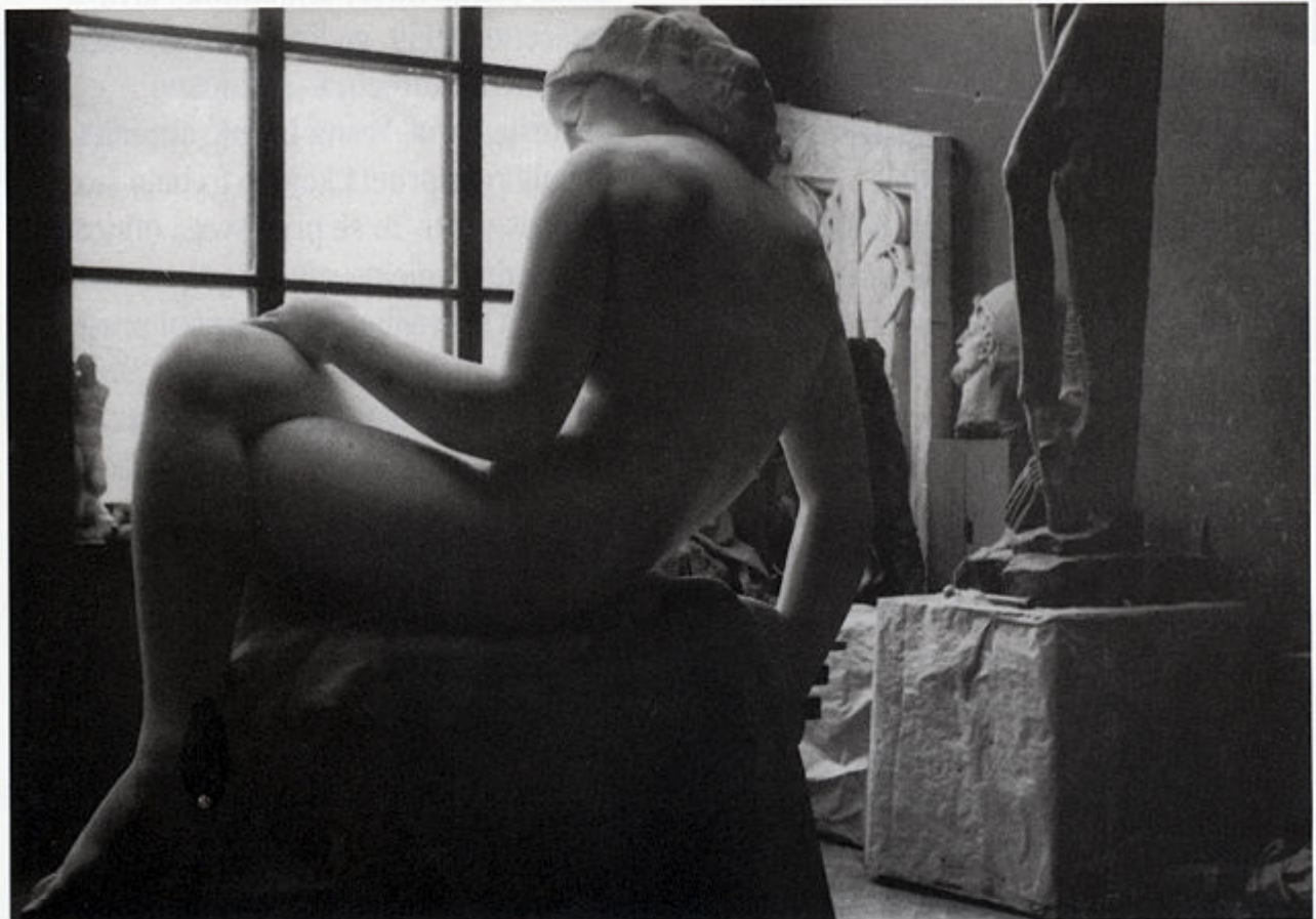
Skulpture Ivana Meštrovića u atelijeru u Mletačkoj 8 u Zagrebu, 1932. godine.