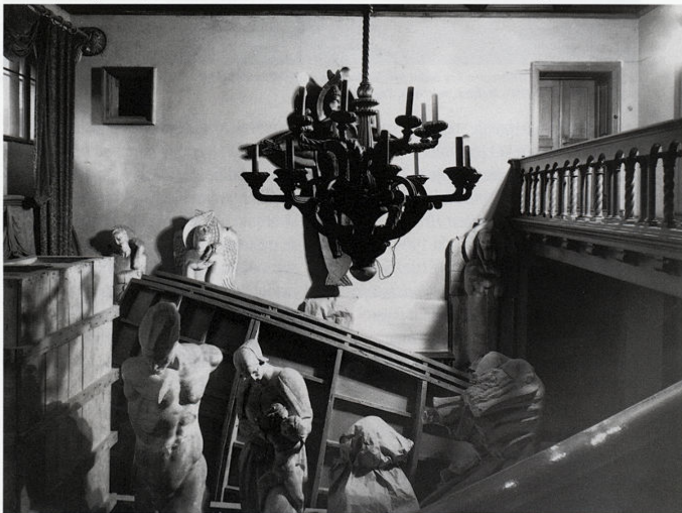
Skulpture Ivana Meštrovića smještene u prizemlju kuće prije adaptacije u izložbeni prostor Atelijera Meštrović u Zagrebu.