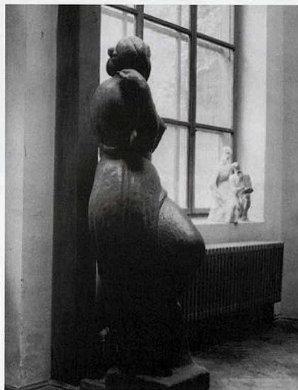
Skulpture Ivana Meštrovića u atelijeru prije adaptacije u izložbeni prostor Atelijera Meštrović u Zagrebu.

Konzervatorski zavod u Zagrebu, prema rješenju Savjeta za prosvjetu, nauku i kulturu od 8. travnja 1954. godine, preuzeo je nadzor i privremenu upravu nad zbirkom u Mletačkoj 8. Odlukom Narodnog odbora grada Zagreba, donesenom na 12. sjednici Gradskog vijeća od 28. studenog 1958. i na 12. sjednici Vijeća proizvođača od 27.