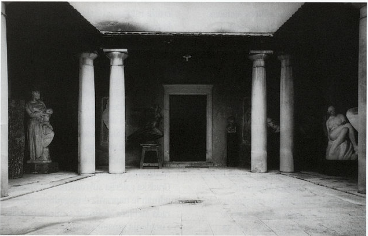
Skulpture Ivana Meštrovića u atriju prije adaptacije u izložbeni prostor Atelijera Meštrović u Zagrebu.