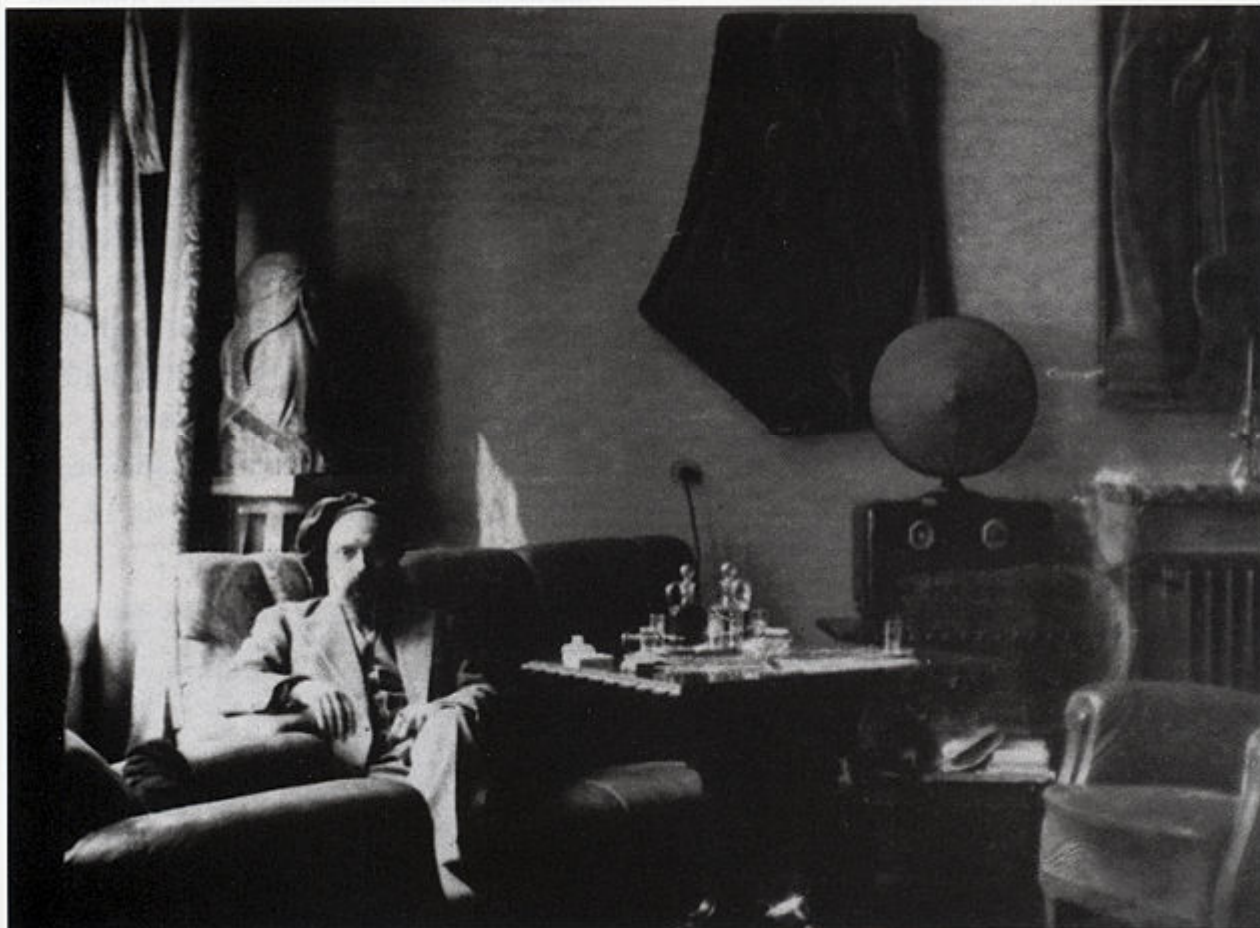
Ivan Meštrović u kući u Mletačkoj 8 u Zagrebu, 1932. godine.

Prema prijepisu iz 1955. godine, darovni ugovor sastavljen je na tri tipkane stranice, a sastoji se od deset članaka. U prilogu se kao sastavni dio darovnog ugovora nalaze tri popisa umjetničkih djela na četiri stranice, koje darovatelj daruje Splitu i Zagrebu. U članku I.