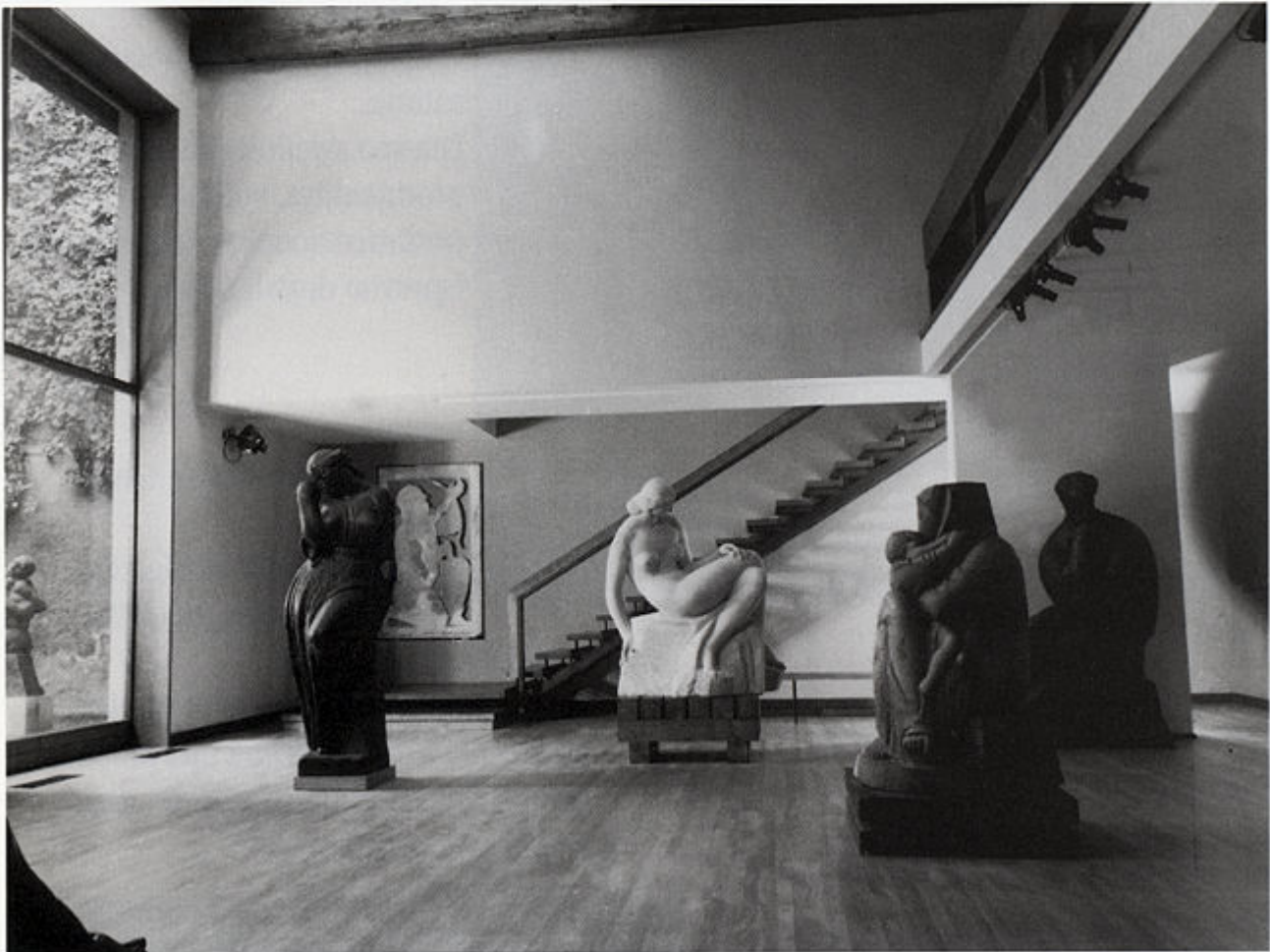
Izložbeni prostor atelijera

Kako oblikovati i povezati nekoliko prostora u stiješnjenome gornjogradskom ambijentu poluotvoreni prostor atrija, zatvoreni prostor atelijera i slobodni prostor, vrt - za snažnu