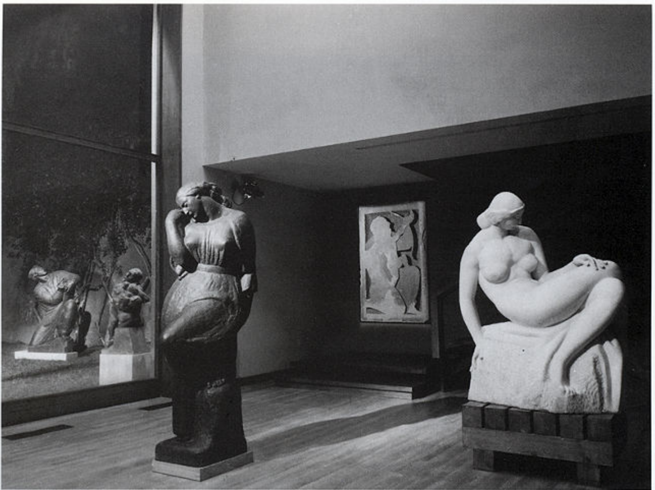
Izložbeni prostor ateliera Meštrović - osvijetljen isključivo umjetnom rasvjetom u večernjim satima