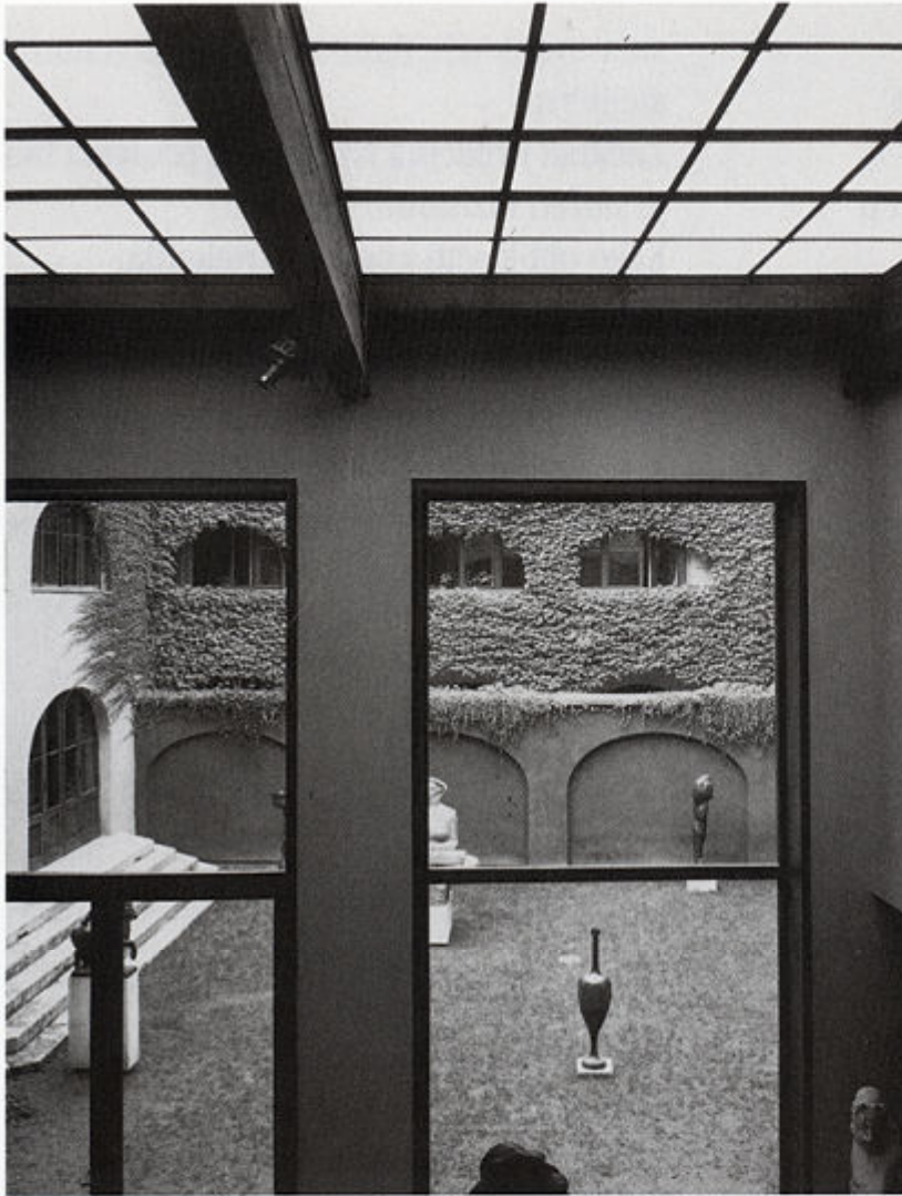
Pogled s galerije u dvorište