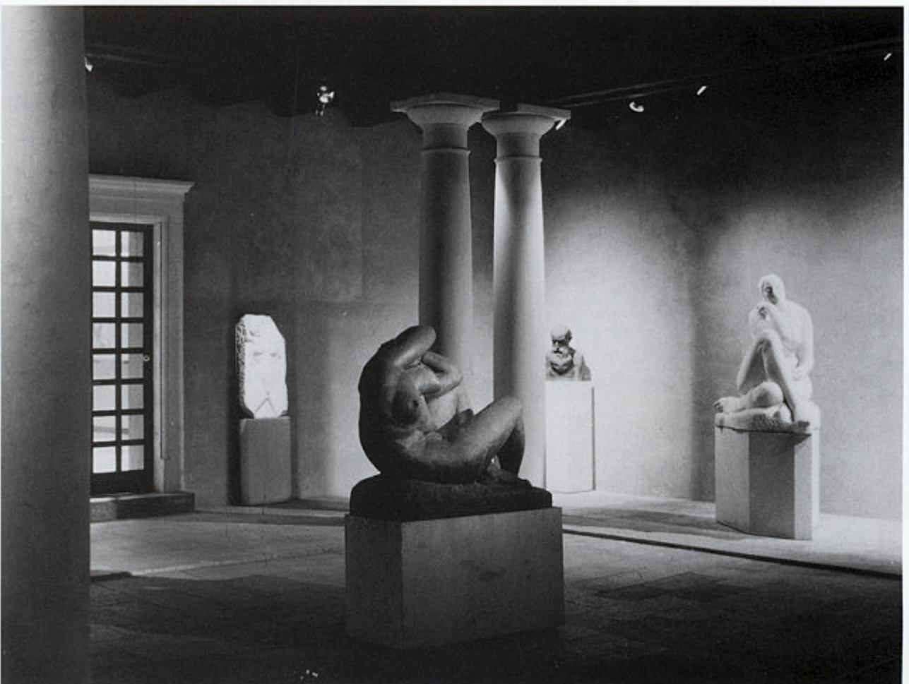
Izložbeni prostor ateliera - atrij osvijetljen umjetnom rasvjetom (reflektorima) u večernjim satima