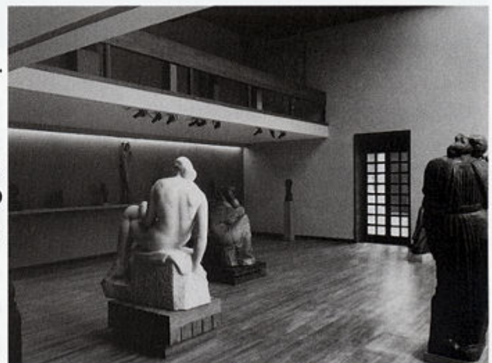
Izložbeni prostor atelijera - s pogledom na atrij (specijalni projektor - reflektori koji osvjetljavaju konturu skulpture)

2. Usmjereni, koncentrirani rasvjeta postignuta je reflektorima tipa projektora koji pridonose voluminoznosti i daju realan prikaz skulpture.