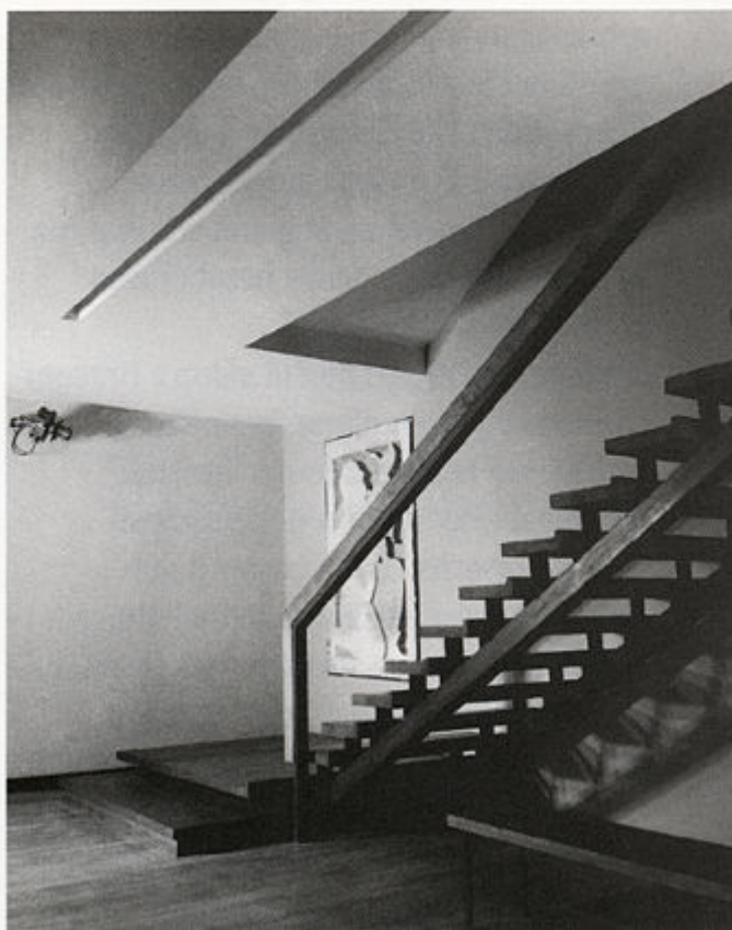
Detalj izložbenog prostora ateliera