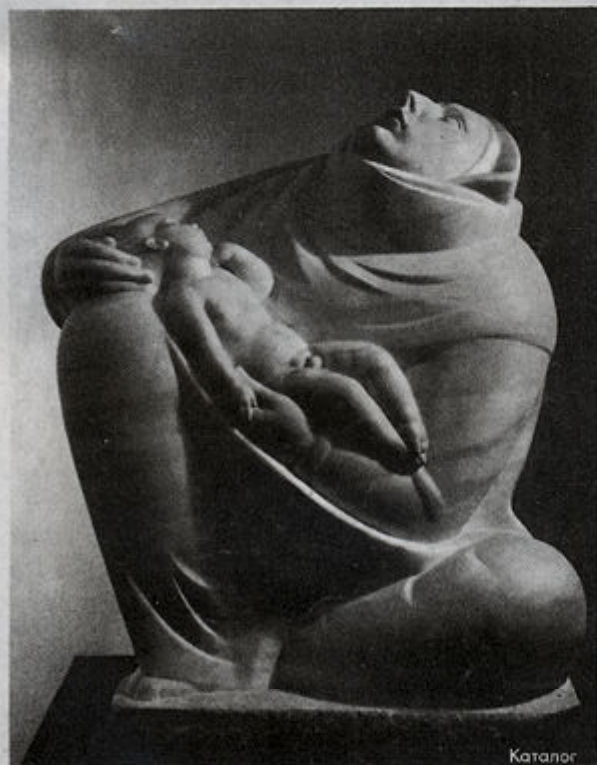
Naslovnica kataloga izložbe Ivana Meštrovića u Lenjingradu, 1989. godine.

podjednako reprezentativne izložbe kao što je bila ova Ivana Meštrovića. Iz Nacionalne galerije Berlin dobili smo izložbu 100 remek-djela Nacionalne galerije (Galerija se u to vrijeme renovirala pa je dragocjena kolekcija majstora suvremene umjetnosti, posebno ekspresionizma, mogla biti izložena u Umjetničkom paviljonu u Zagrebu još 1986). Izloženi su radovi Jeana Arpa i Sophie Taüber-Arp, Mađa Beckmanna, Constantina Brancusija, Giorgija de Chirica, Lovisa Corintha, Salvadora Dalija, Ota Dida, Mađa Ernsta, Lyonela Feningera, Alberta Giacomettija, Juana Grisa, Georgea Grosza, Ferdinanda Hodlera, Ernsta Ludwiga Kirchnera, Paula Kleea, Kate Kollwitz, Ferdinanda Legera, Aristidea Maillola, Joana Miróa, Paule Modersohn-Becker, Amadea