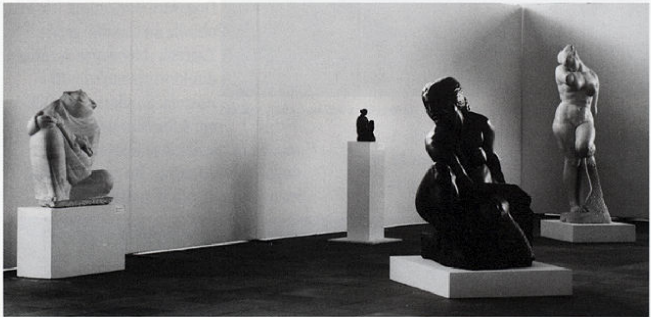
Izložba djela Ivana Meštrovića u Muzeju XX. stoljeća u Beču, 1987. godine.

Muzeja savremene umetnosti u Beogradu). Posljednja izložba u Milanu nije imala samo 63 nego 71 djelo jer je zbog posebnog zanimanja organizatora izložba proširena. Naime, organizatori su željeli više djela u mramoru mediteranskog ugođaja pa je izložbi dodano još nekoliko aktova u mramoru kao što su Sanjarenje iz 1927. iz Splita; Čekanje iz 1928. iz Atelijera Meštrović; Žena kraj mora i Na odmoru iz 1933.