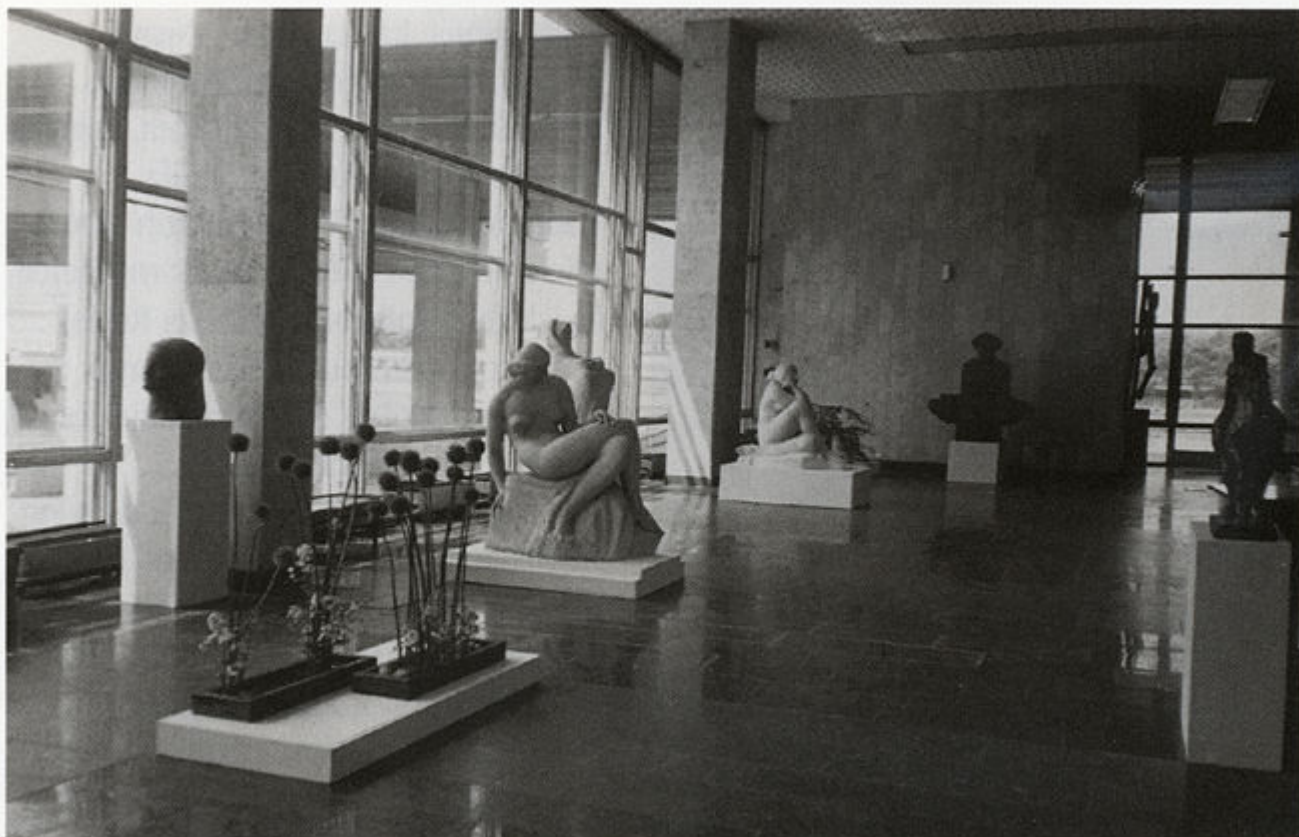
Izložba djela Ivana Meštrovića u Novoj Tretjakovskoj galeriji u Moskvi, 1989. godine.