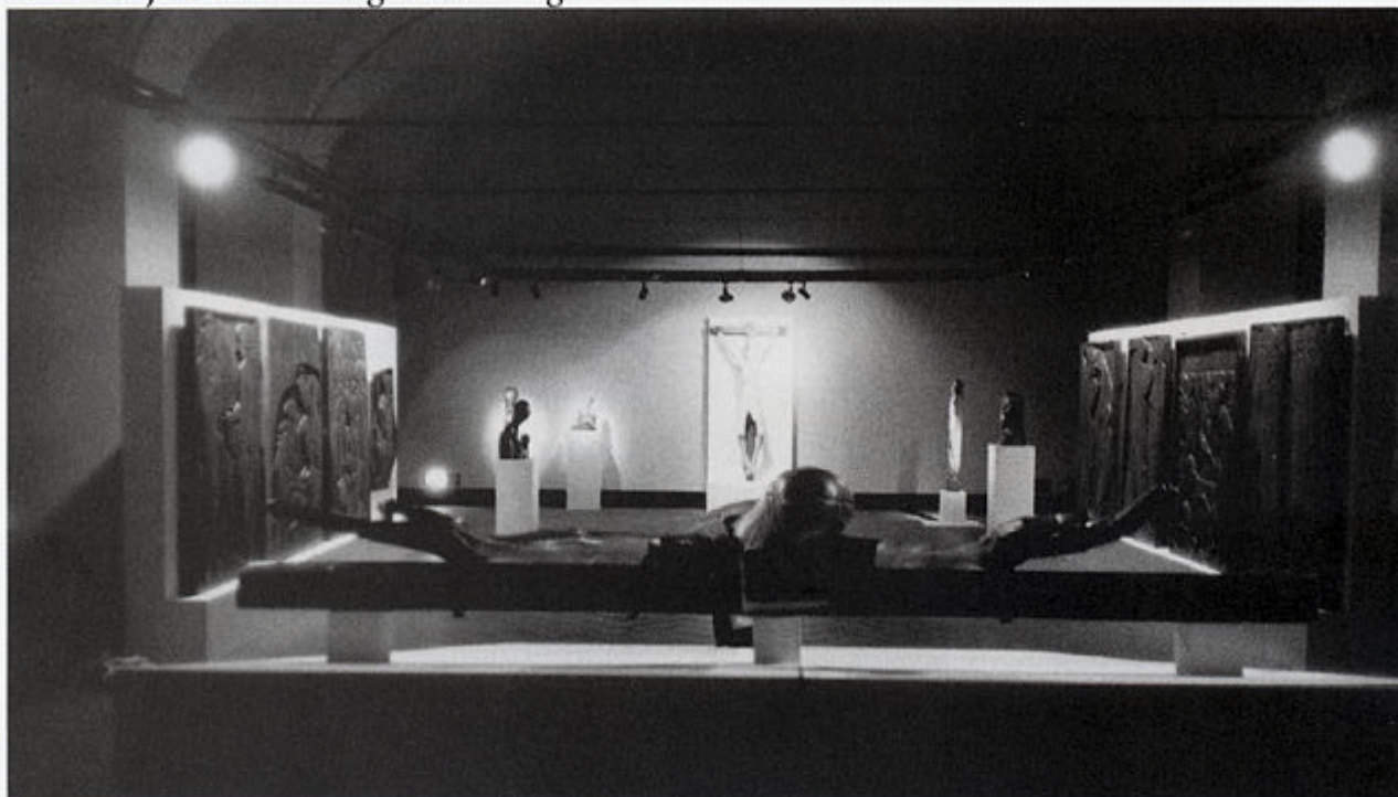
Izložba djela Ivana Meštrovića u Palazzo Reale u Milanu, 1987. godine.

muzejom, postojao je ugovor o dugoročnoj suradnji, što znači da smo razmjenom dobili ili trebali dobiti