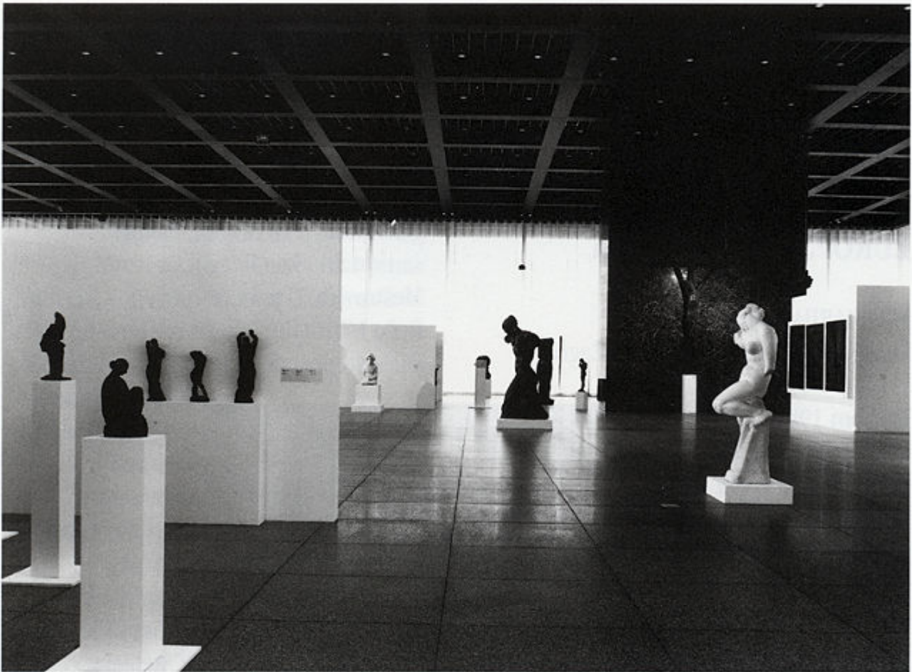
Izložba djela Ivana Meštrovića u Nacionalnoj galeriji u Berlinu, 1987. godine.