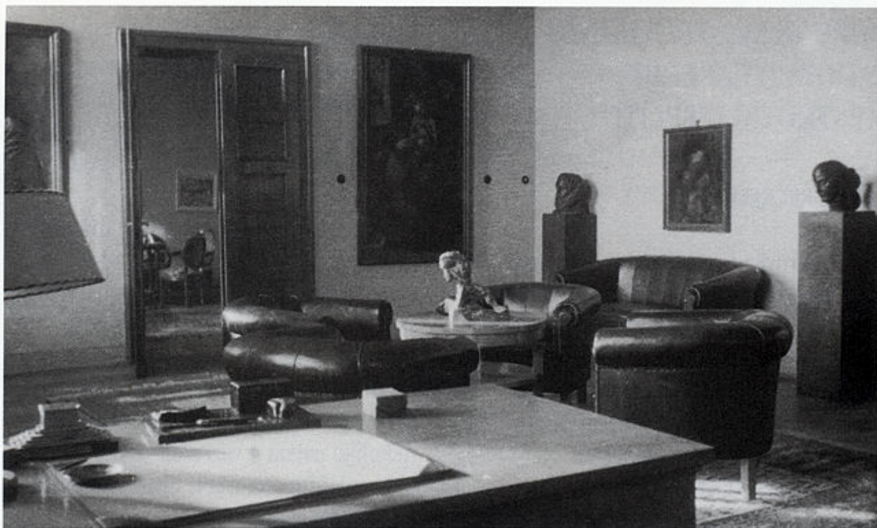
Radna soba Ivana Meštrovića u vili na Mejama u Splitu.