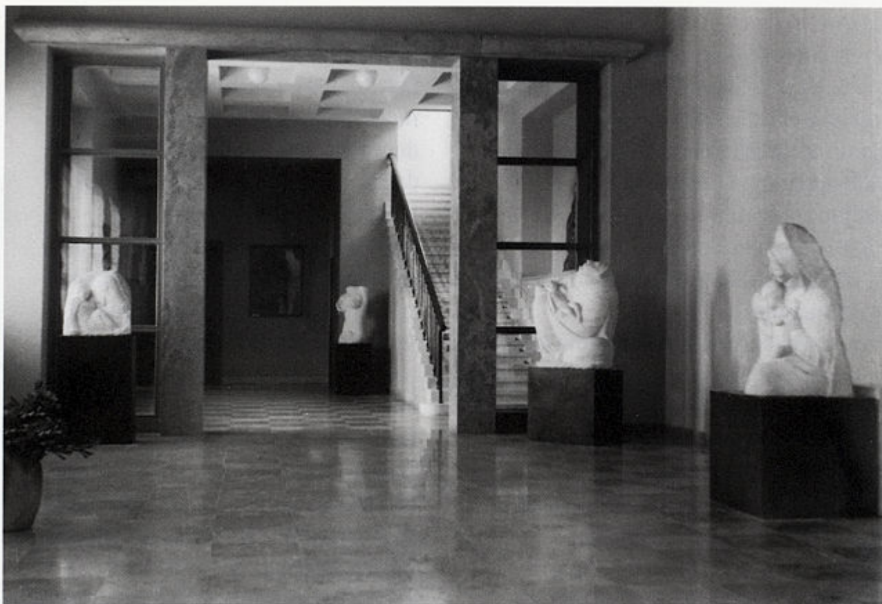
Stalni postav (u središnjoj prostoriji u prizemlju prije 1962.) djela Ivana Meštrovića u Galeriji Ivana Meštrovića u Splitu.