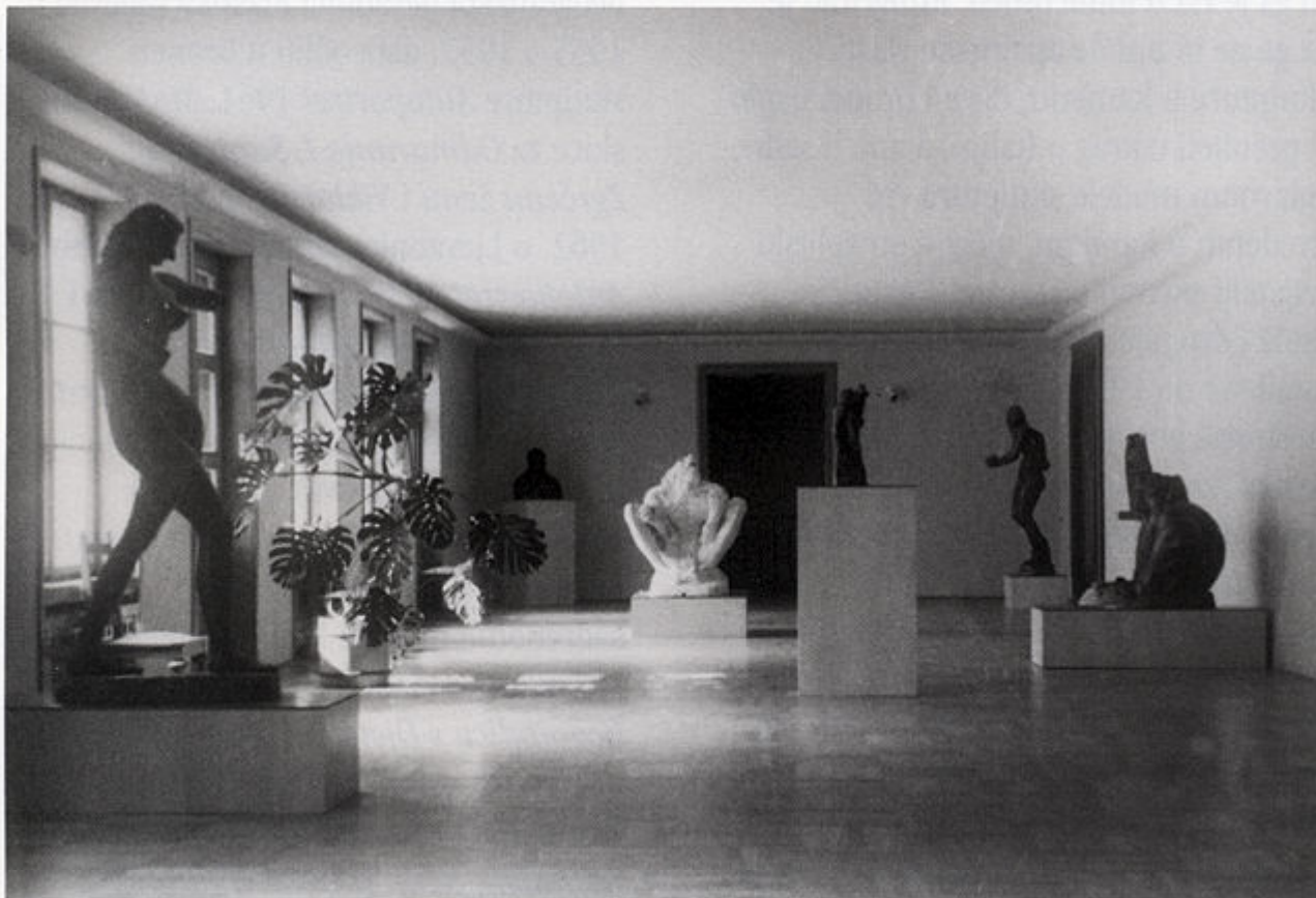
Stalni postav, od 1962. 1983., (u središnjoj dvorani na katu) djela Ivana Meštrovića u Galeriji Ivana Meštrovića u Splitu.

Za prvi izložbeni postav u Galeriji Meštrović moglo se raspolagati samo dijelom palače na Mejama jer su u njoj još bili brojni stanari, pa se nije ni osjećala potreba za većim brojem izložaka. Oslobođanjem cijele palače od stanara osjetila se potreba dopunjavanja muzejskog postava daljnjim skulpturama koje bi upotpunile pregled Meštrovićeva stvaralaštva u svim razdobljima. Galerija je raspolagala i velikim brojem