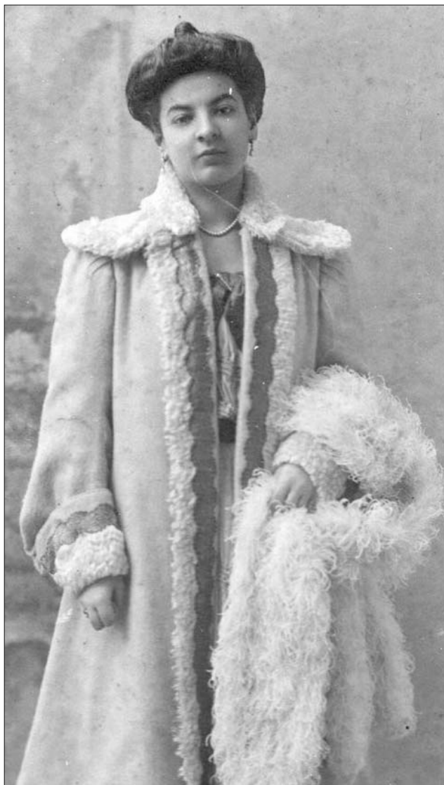
Fotografija Dore Pejačević iz 1905. (Zavičajni muzej Našice)