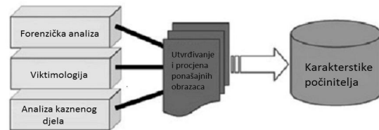
Slika 4. Koraci metode Analize bihevioralnih dokaza

Prvi korak ove metode se naziva forenzička analiza (u daljnjem tekstu: EFA) i odnosi se na pregled, testiranje i interpretaciju fizičkih dokaza (Petherick, Turvey, 2008a). U tom se koraku svi fizički dokazi koji se tiču slučaja pregledaju kako bi se procijenila važnost i utvrdila njihova sveukupna priroda i kvaliteta. EFA informira profiler na kojim dokazima treba temeljiti svoj profil, koji dokazi nedostaju, koji su dokazi možda krivo interpretirani te kakvu vrijednost imaju u daljnjim analizama.