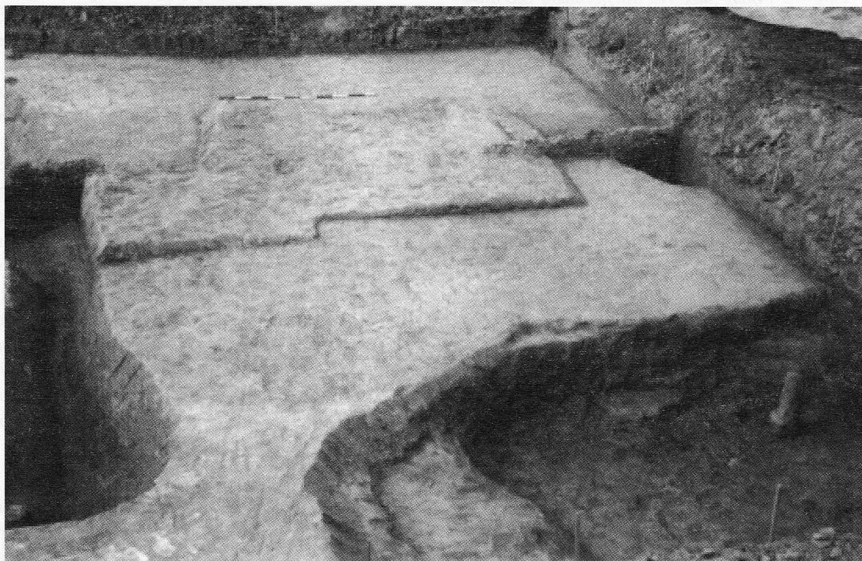
Slika 3: Brezovljani, 2002., podnica nadzemne kuće, radna jama i dio rova