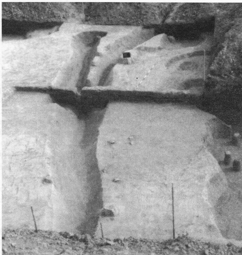
Slika 2: Brezovljani, 2002., rov i dio zemunice