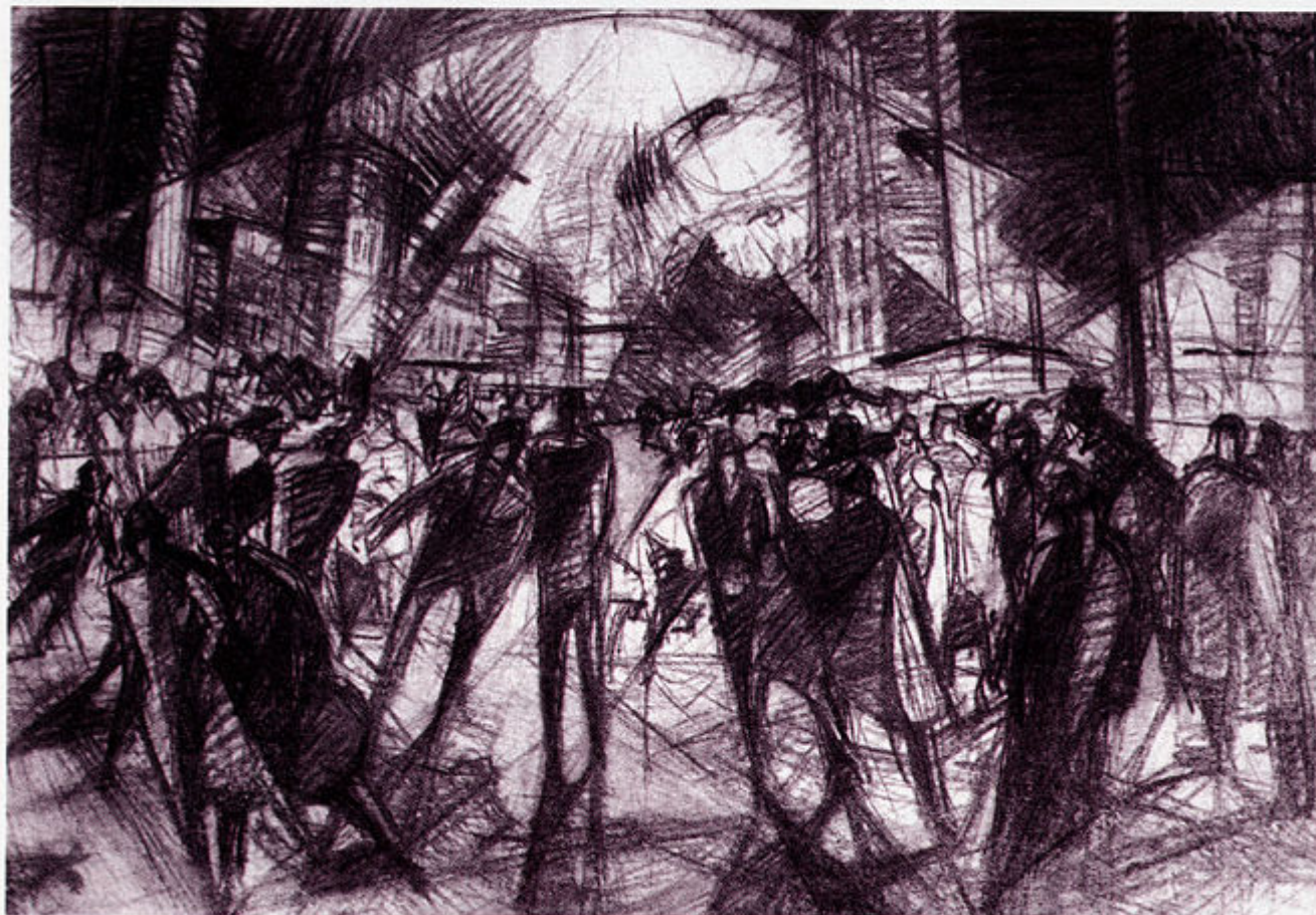
Korzo, 1937. ugljen/papir. Rad R. Venuccija. Vl. M. Stipanov.

vrpce, TV-emisije). U izdanju Moderne galerije izašla je iz tiska bogato ilustrirana monografija ovog slikara, jer je iscrpan katalog retrospektivne izložbe odavno razgrabljen, a publikacija se i dalje traži.