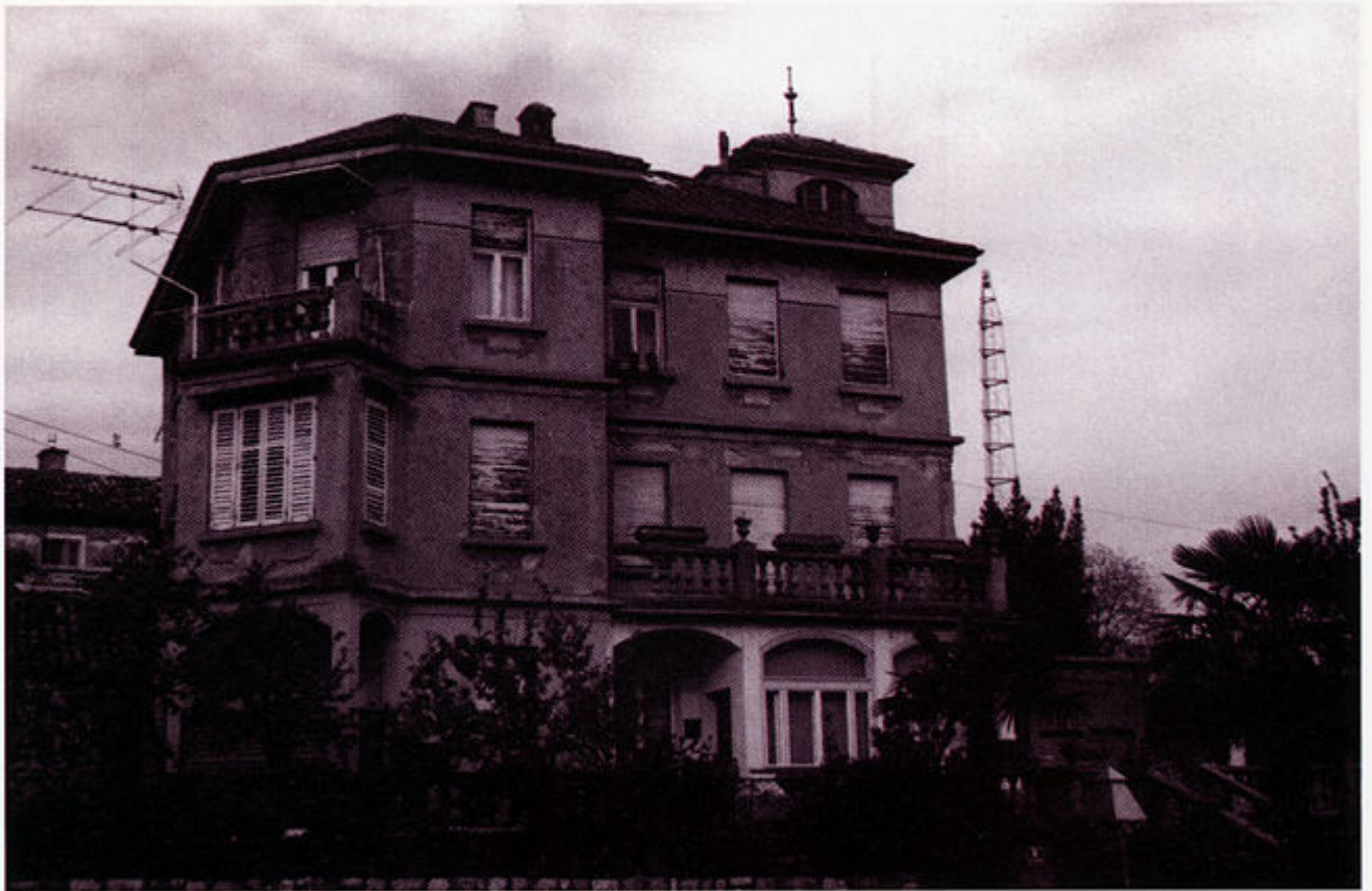
Stan R. Venuccija u Rijeci, I kat (s balkonom). Fototeka Moderne galerije, Rijeka

slaba zdravlja, surađivala koliko je mogla i spremno pružala sve tražene informacije i njoj dostupne podatke.