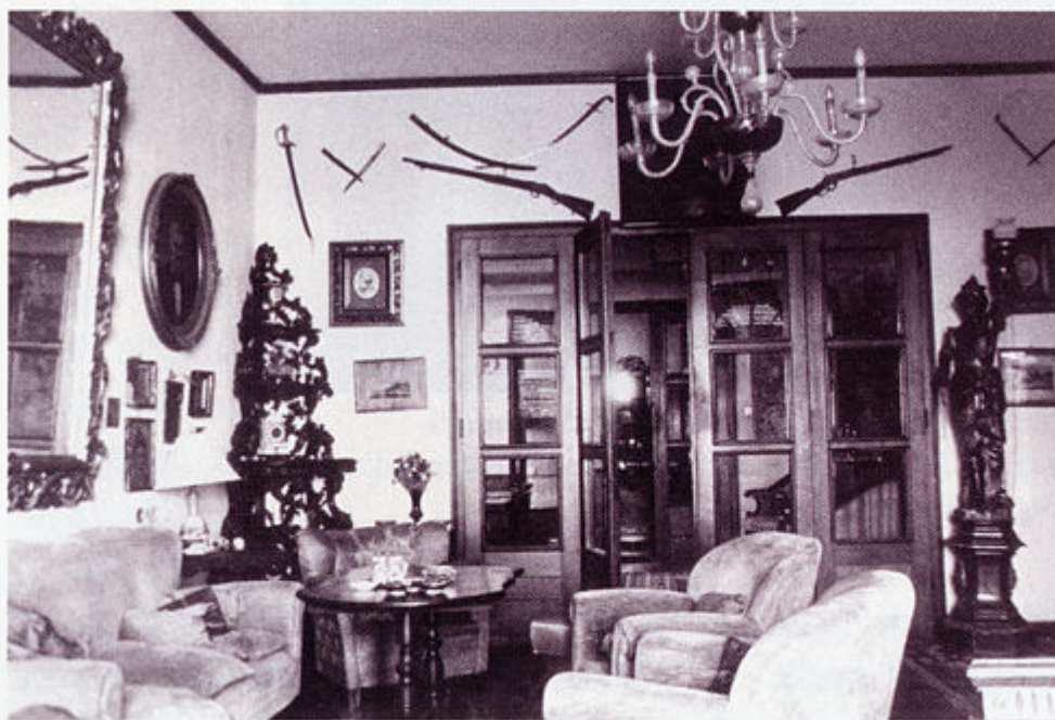
Interieur vile Ružić s brojnim slikama, pokućstvom, oružjem te ostalim predmetima i uspomnama vezanim za poznate obitelji.

predstavljaju, prema njegovim vlastitim riječima, biblioteka i arhiv obitelji Mažuranić, smješteni jednim dijelom u ormarima koji su pripadali dru Želimiru Mažuraniću, nasljedniku kuće Ivana Mažuranića, u Jurjevskoj 5 u Zagrebu, kao i obitelji Kušlan. Na brojnim su knjigama posvete znamenitih ljudi Ivanu, Antunu,