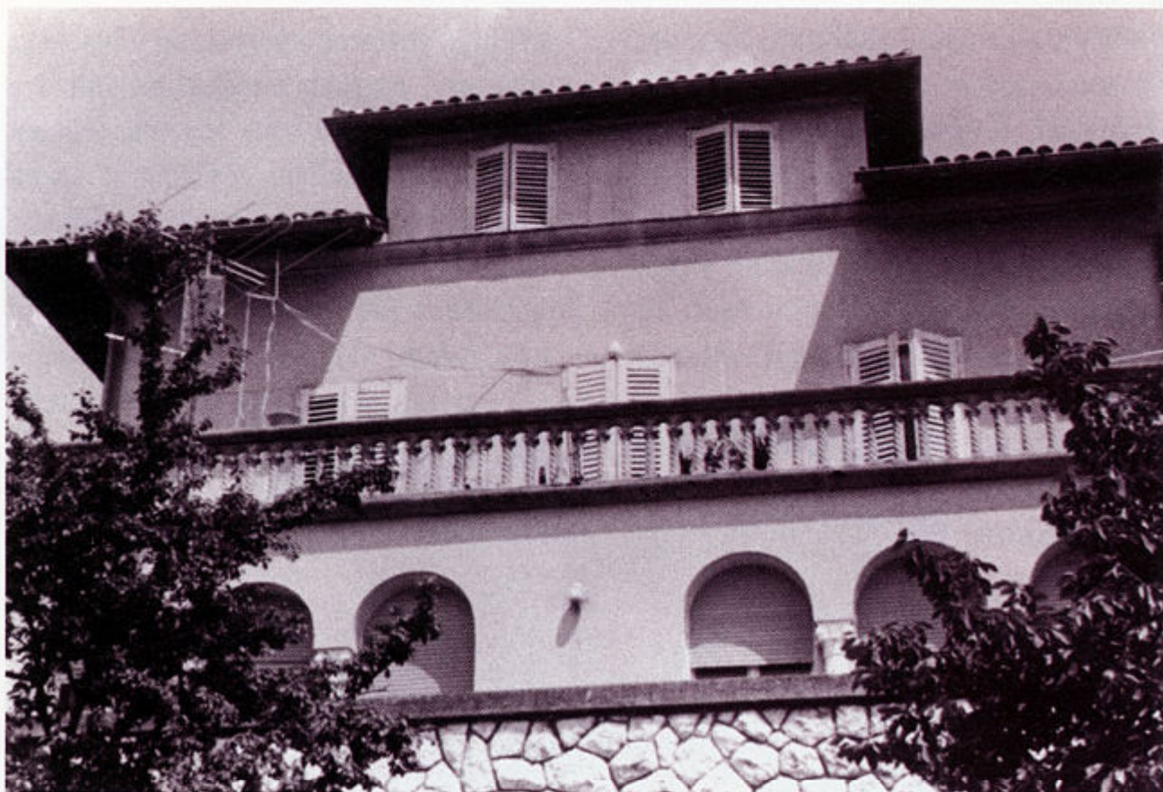
Vila Ružić na Pećinama, Rijeka.

guvernera Bosne i gradonačelnika Zagreba (1885.). Majka mu je bila Nada Brlić, kći dra Vatroslava Brlića i Ivane Brlić Mažuranić. S