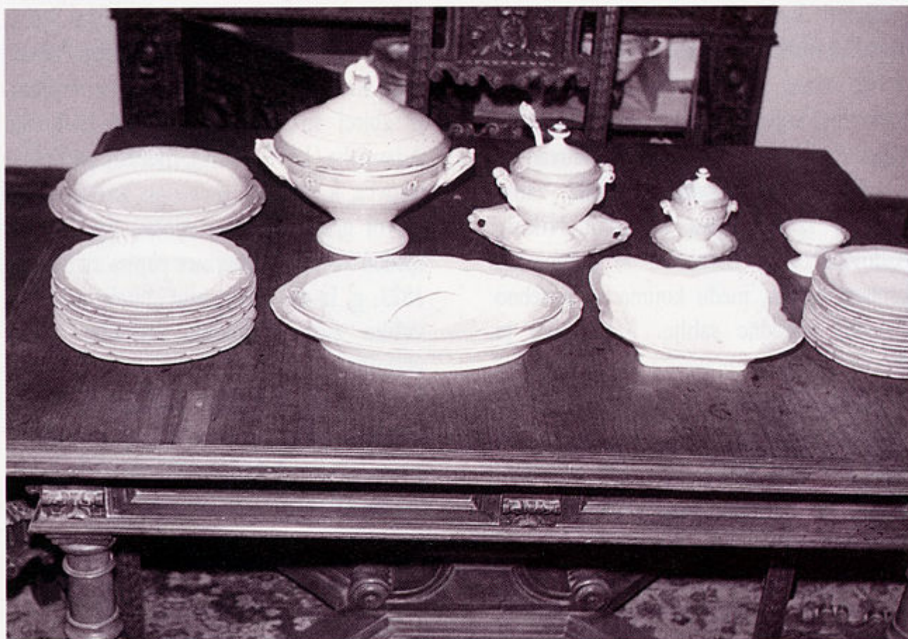
Servis za jelo Ivana Mažuranića izraden u Češkoj u drugoj polovici 19. stoljeća

visi kolorirani crtež modela broda "Bark - Ban Mažuranić", no autor tog crteža ostao je nepoznat. Sam se model nalazi u Slavenskom Brodu, dok je brod izgrađen 1874. g. u Bakru i predstavljao je prvi društveni brod-jedrenjak duge plovidbe, nazvan imenom bana pučanina.