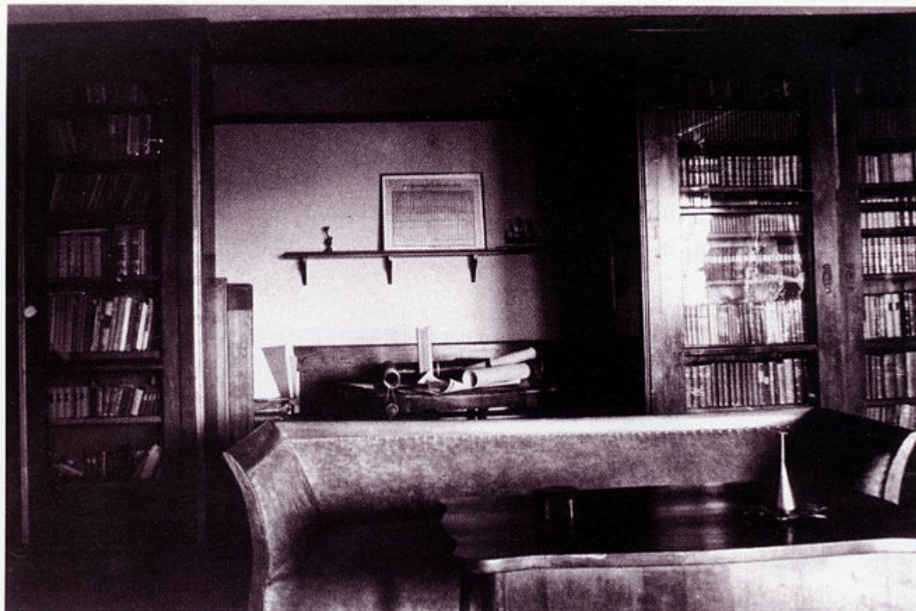
Dio bogate knjižnice i Arhiva obitelji Brlić i Mažuranić.

čitao je Mažuranić neku Flammarionovu knjigu ( Les terres du ciel ). Pri tomu mu je iznenada veoma pozlilo. Ukućani ga prenašahu s jednog naslonjača na drugi, kad li Mažuranića u jedanaest i po sati prije podne udari srčana kap, te umre u 77. godini života." Iz ovoga se, dakle, može pretpostaviti da je ban umro upravo u ovim foteljama koje je, prema pričanju, Ivana Brlić Mažuranić poslala na Rijeku svojoj kćeri Nadi i zetu dru Viktoru Ružiću.