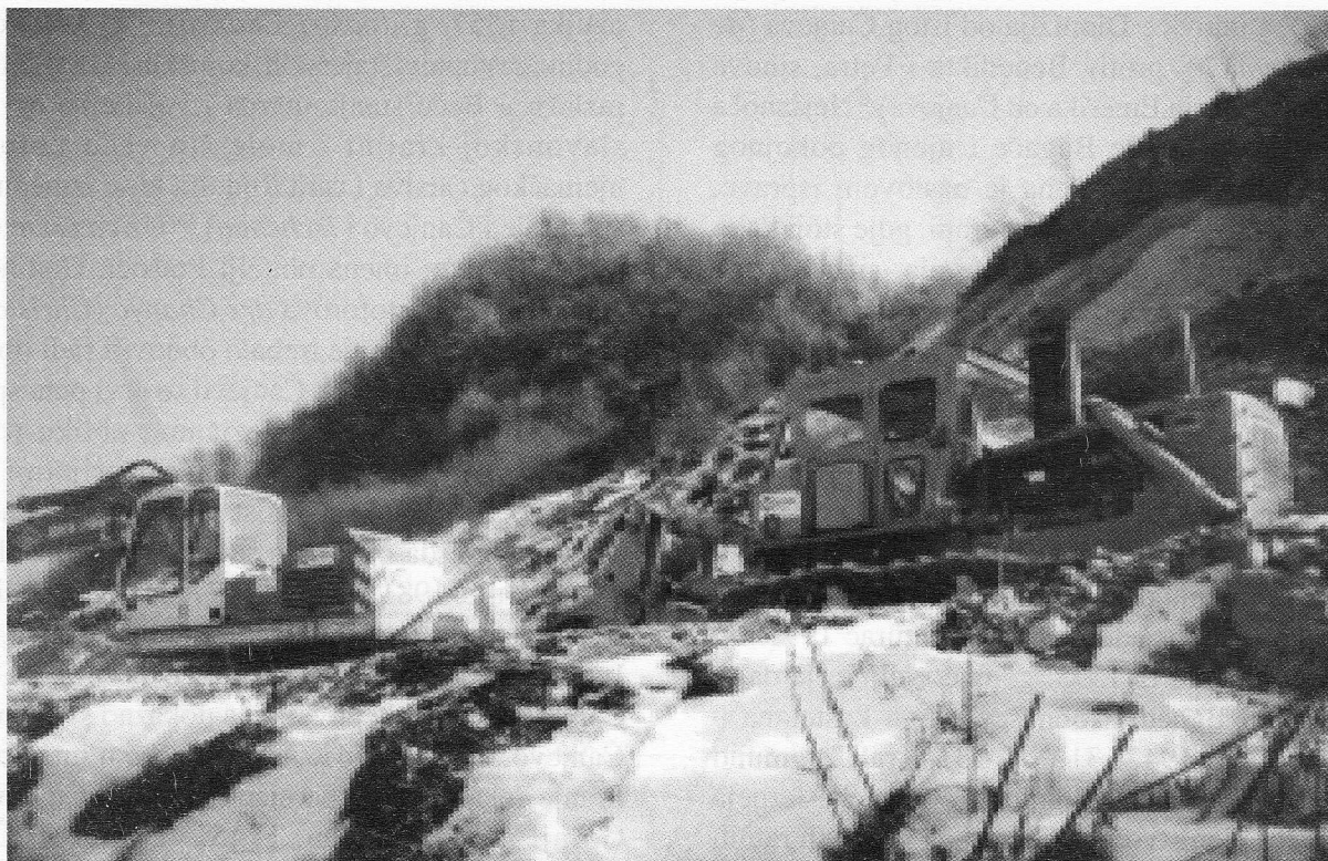
Slika 3: Pogled iz kamenoloma na položaj Starog grada Čanjevo