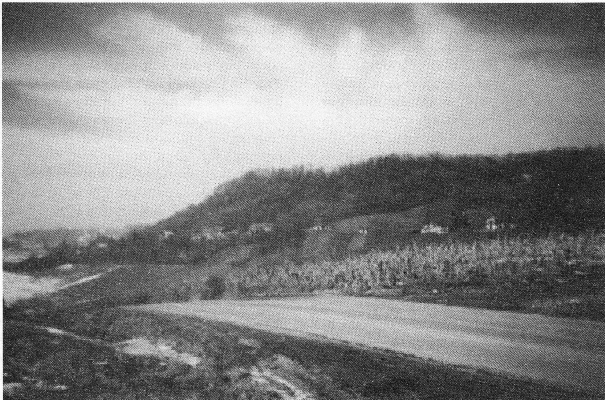
Slika 5: Pogled na lokalitet s jugoistoka