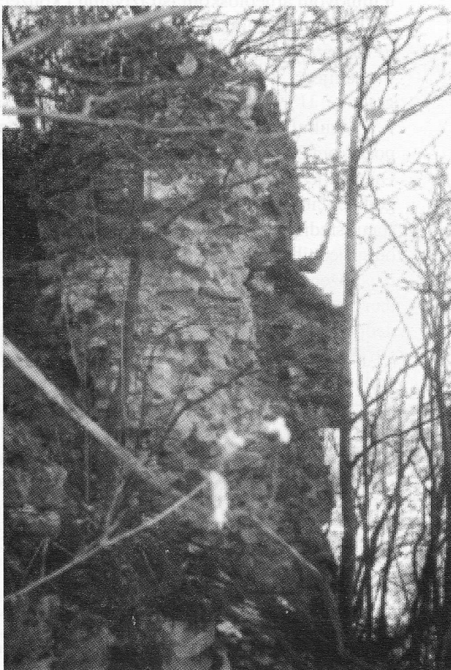
Slika 6: Detalj ostataka зида bedema