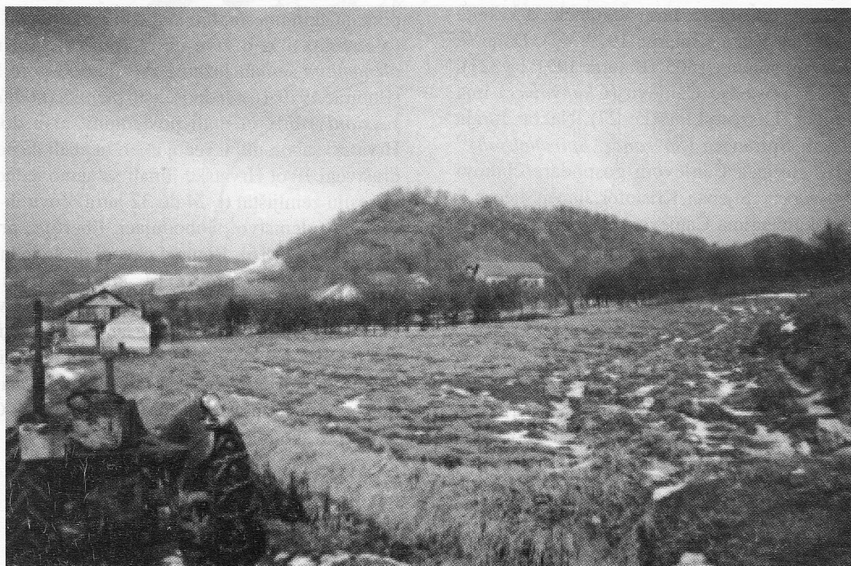
Slika 4: Pogled na lokalitet s juga