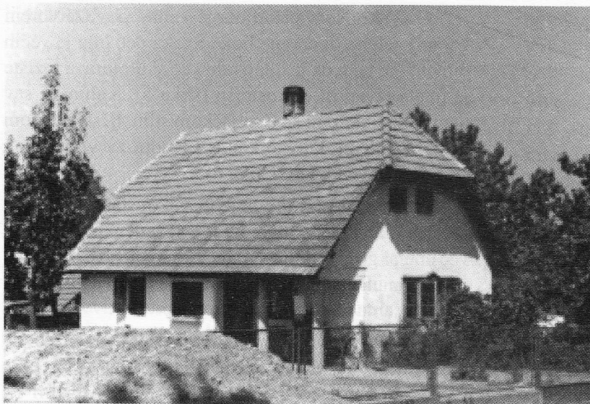
Slika 2: Južno i istočno pročelje kuće. Kolarec, stanje 1990. Jedna od rijetkih kuća u kojoj su izvedene male intervencije