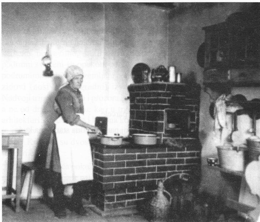
Slika 6: Tipičan izgled izvedene kuhinje, Kolarec (Muzej grada Zagreba - Ostarština Srečka Florschütza)