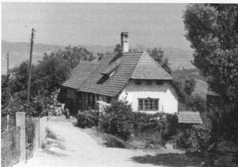
Slika 3: Zapadno i južno pročelje kuće. Kolarec, stanje 1990. Kuća na kojoj su izvedene malobrojne intervencije