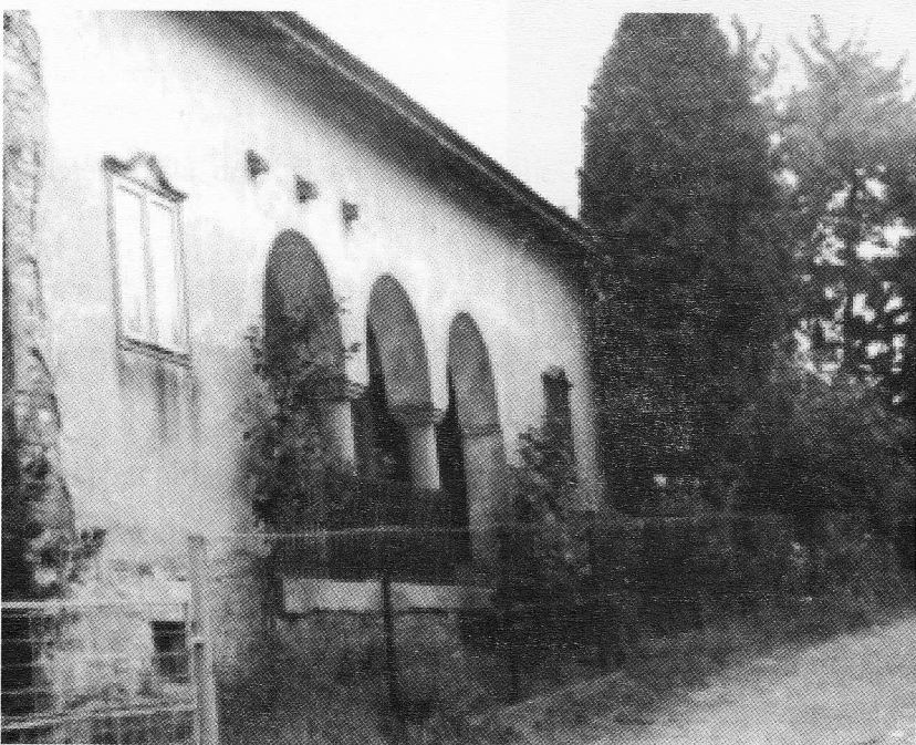
Slika 4: Zapadno pročelje kuće. Kolarec, stanje 1990. Kuća je nekada bila katnica, a namjena je bila gostionica - prodavaonica