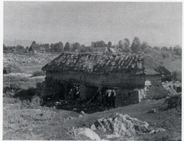
2. Ribnik, općina Gospić: stara vodenica sa 9 mlinskih kamena. Danas više ne postoji. Fotografija iz 1962. god.

S obzirom na negativnu demografsku sliku Lika bi