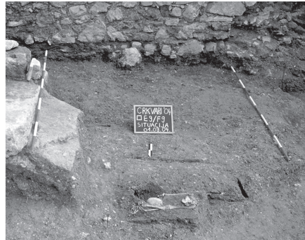
Sl. 2. Oltarna menza i pogled na temelje sjevernog zida crkve

SJ 100 - struktura od kamenog popločenja u □ E9b,d/F9a,c, zapadno od zida SJ 098 (slika 1). Zamijećena je na ∇ 206,95 m. Leži na proslojcima od žbuke i očuvala je donje izvorne slojeve (slika 2), dok su na ostalim mjestima istraživane površine srednjovjekovni slojevi gotovo u potpunosti oštećeni učestalim ukopavanjem. Dimenzije 0,76 x 0,64 m. Struktura SJ 100 vjerojatno predstavlja oltarnu menzu kojoj se pristupalo s istočne strane, gdje je dijelom i očuvana niža pristupna razina (poput stuba) koja vjerojatno predstavlja izvornu niveletu prostorije (sakristije?).