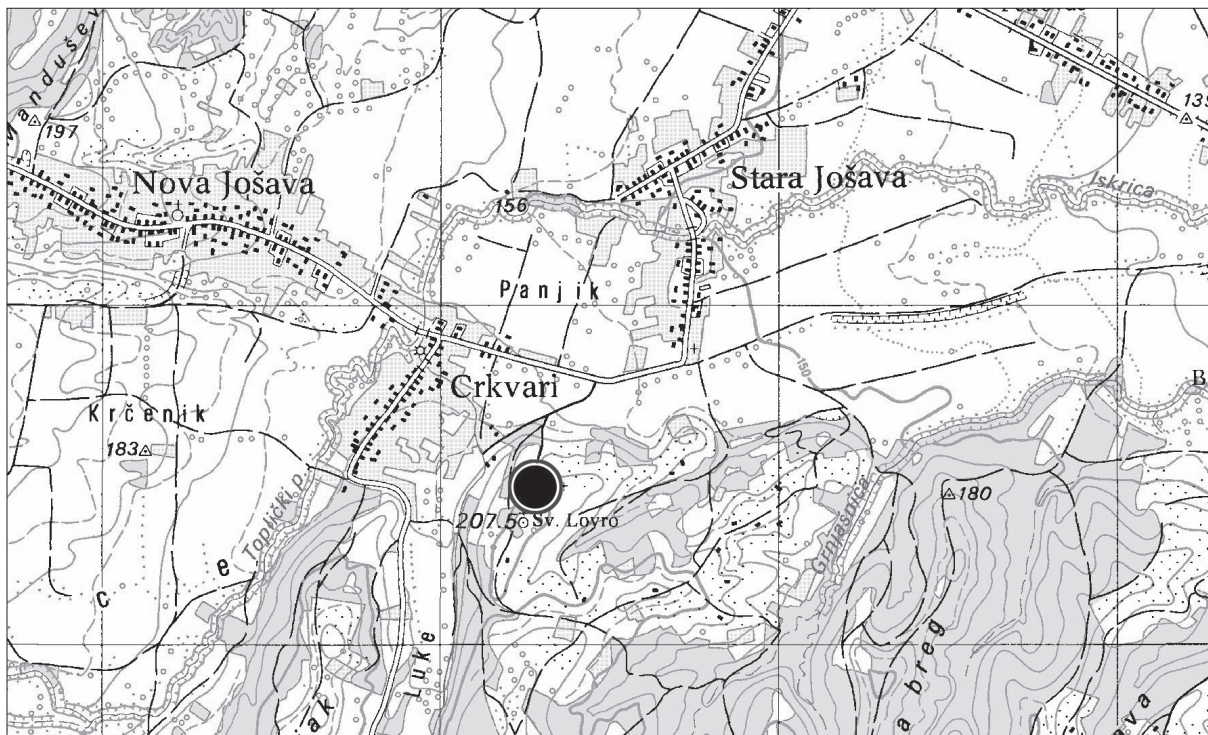
Karta 1. Detalj zemljovida (TK 1: 25000) s naznačenim položajem crkve Sv. Lovre kod Crkvara