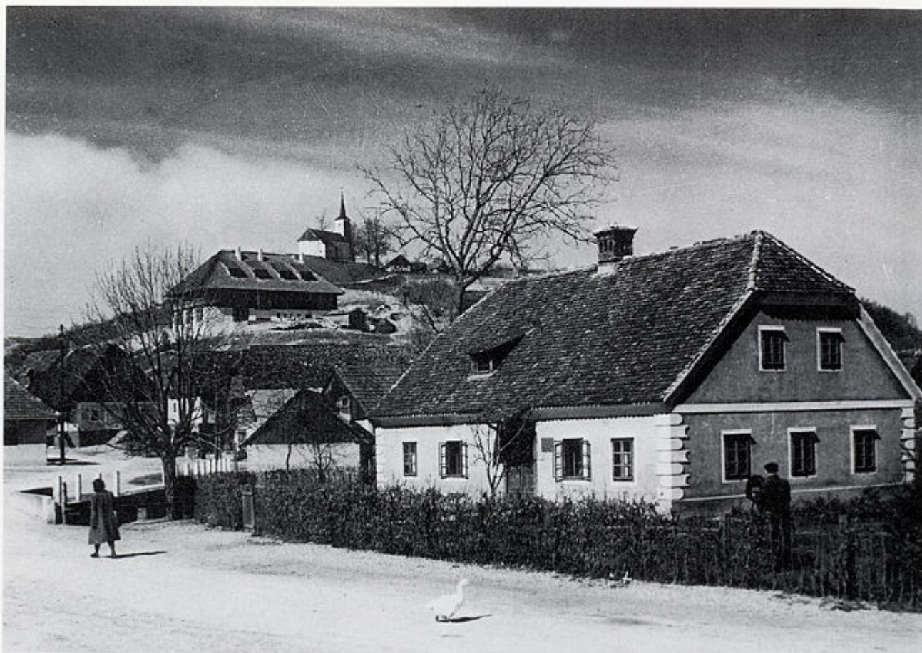
2. Rodna kuća Josipa Broza Tita, u pozadini je hotel "Kumrovec", kasnije Titova rezidencija, a iznad toga je kapela sv. Roka 1951. god.

jedan seoski bunar. Tako su zvona sačuvana i upravo prošle godine proslavila su stoti rodendan. Između dva svjetska rata pri kapeli Svetog Roka djelovala su društva koja su okupljala katoličku mladež, iako je u to vrijeme bio jak utjecaj "Jugoslavenskog sokola". Nakon Drugoga svjetskog rata, opet zahvaljujući doprinosima seljana, kapela je obnovljena i uvedena je električna struja. No, sudbinu kumrovečke kapele uvelike su odredile promjene vezane uz Kumrovec. Budući da su još 1945. u Kumrovec počeli dolaziti mnogobrojni pojedinci i grupe kako bi obišli Titovu rodnu kuću, već 1948. godine na zapadnoj strani Kumrovca, na brežuljku ispod kapele sv. Roka gradi se hotel Kumrovec koji se 1962. godine preuređuje