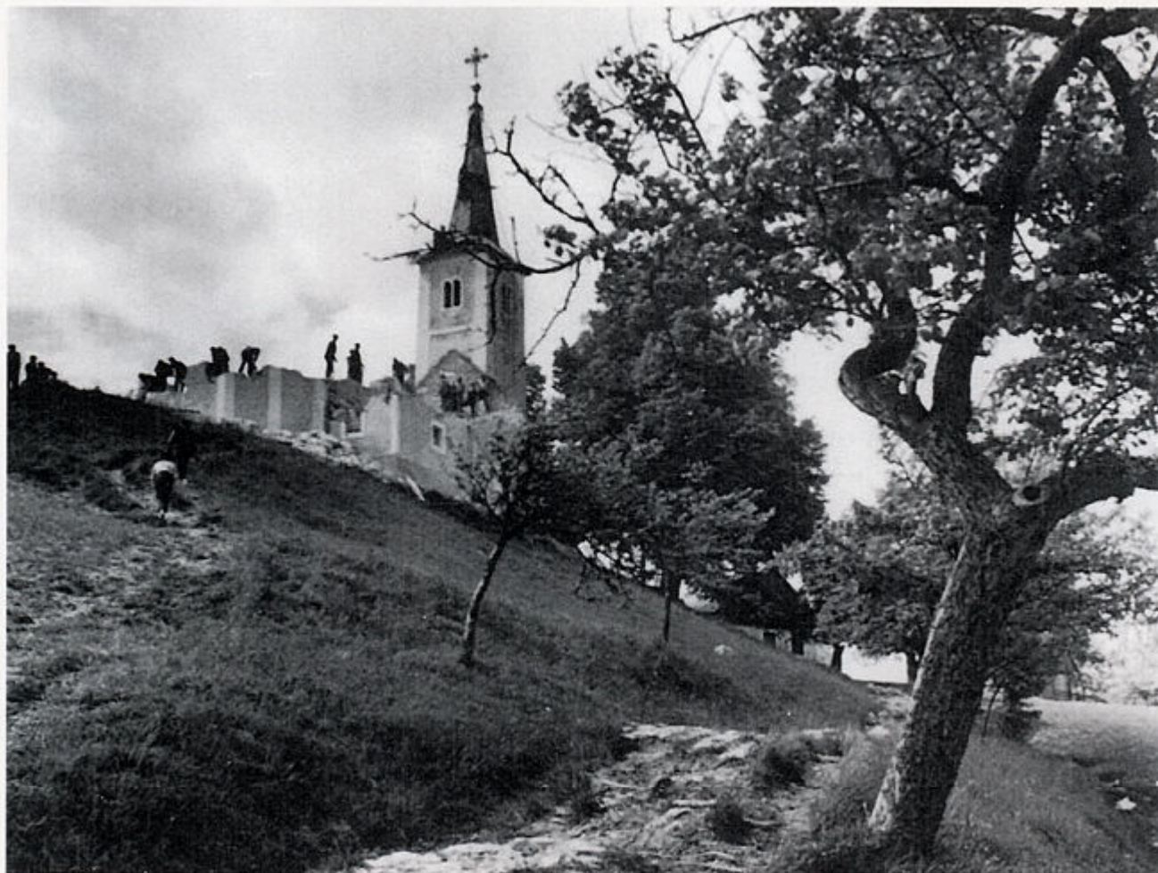
3. Rušenje kapele sv. Roka, 1962.

u narodu vrlo omiljene, kapele Svetog Roka, kojoj su se svake godine na Rokovo slijevale rijeke hodočasnika iz ovoga našeg sutlanskog kraja pa i šire - vjernici iz susjedne Slovenije. Nakon rušenja na mjestu gdje se nalazila kapela postavljen je spomenik A. Augustinčića "Nika-partizanka". Novu kapelu Kumrovec je dobio u selu Ravno Brezje 1963. godine. U međuvremenu, stara kapela se nije puno spominjala, sve do 1994. kad je u sklopu našeg muzeja postavljena izložba "Stari sveti Rok", s velikim dijelom sačuvanog inventara iz stare kapele. Iste godine, u suradnji s Regionalnim zavodom za zaštitu spomenika kulture iz Zagreba provedena su i arheološka istraživanja temelja stare