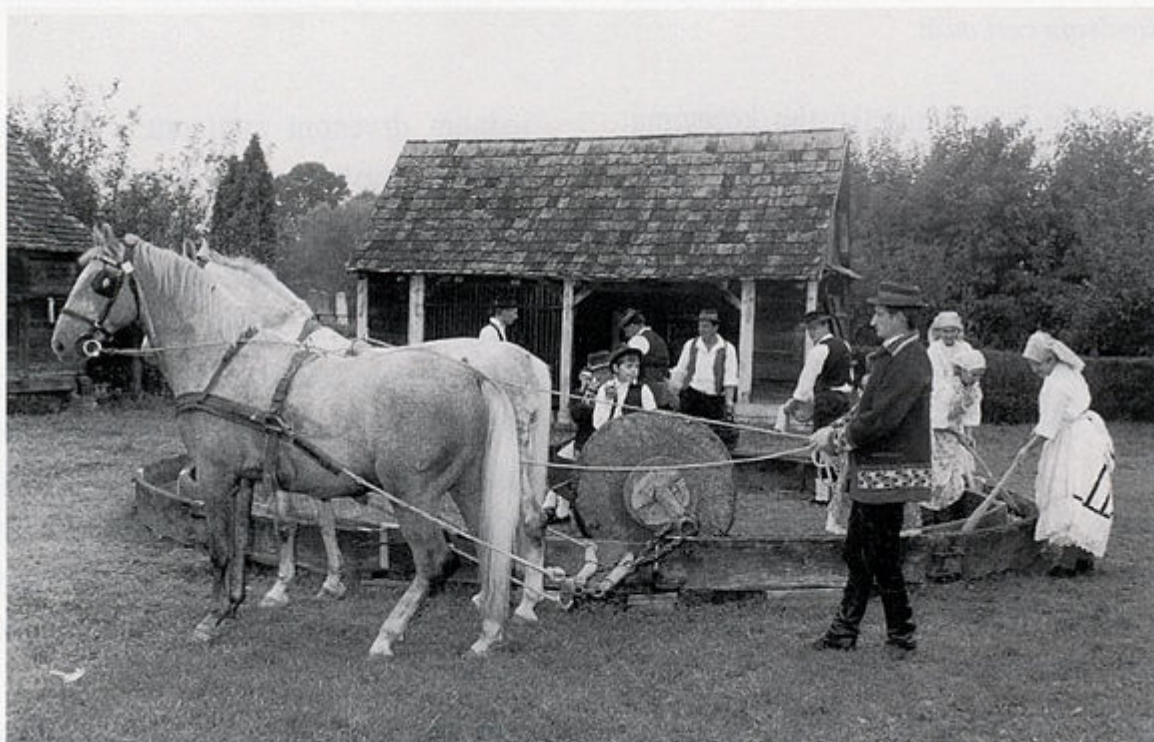
3. Demonstracija rada "izimače", Beravci