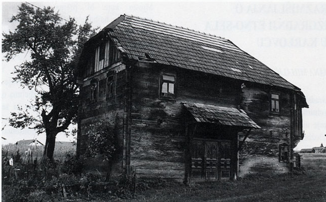
1. Čardak, selo Šišljević, 1966. god.