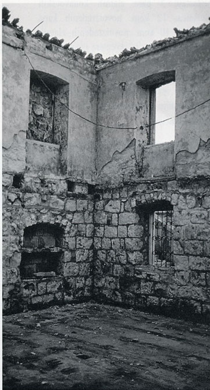
4. Spaljena zgrada Zavičajnog muzeja, snimak iz 1993. god.

Početkom rata na Hrvatsku u proljeće i ljeto 1991. godine dio etno-grade, izložen u prostoru Zavičajnog muzeja je sklonjen, odnosno skriven u cisternu istog objekta. To je prostor 5x4x4 m koji je ispod nivoa ceste, relativno suh, s dvostrukim svo-