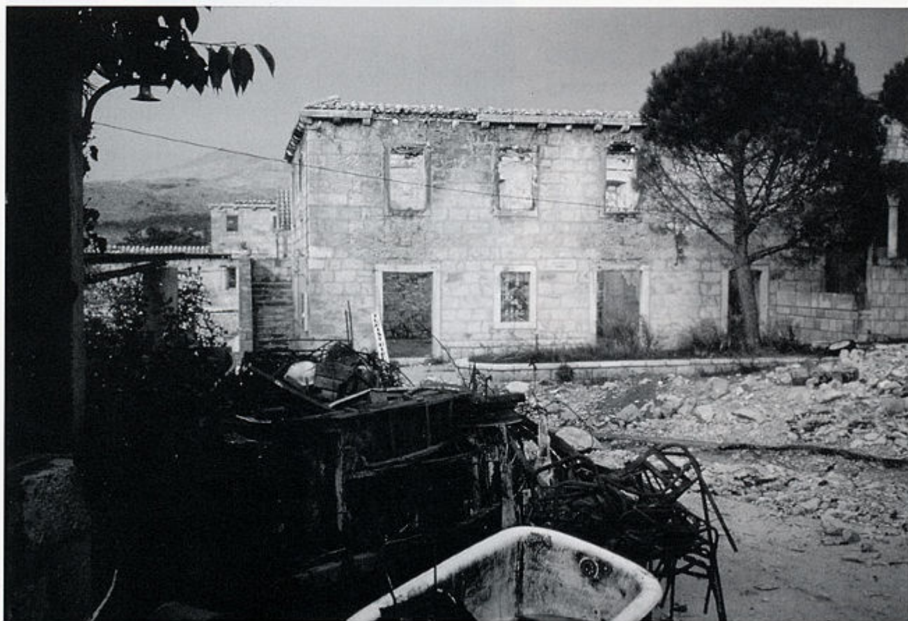
5. Zgrada Zavičajnog muzeja Konavle, 1993. god.

Kuću Zavičajnog muzeja treba namjeniti stalnoj izložbi tekstila i nošnje: to je prijedlog nove muzejske ekspozicije koji ima kvalitetu ne samo značajnog veza i nošnje u Hrvatskoj, već i veliku simboličku vrijednost spašenoga muzejskog materijala.