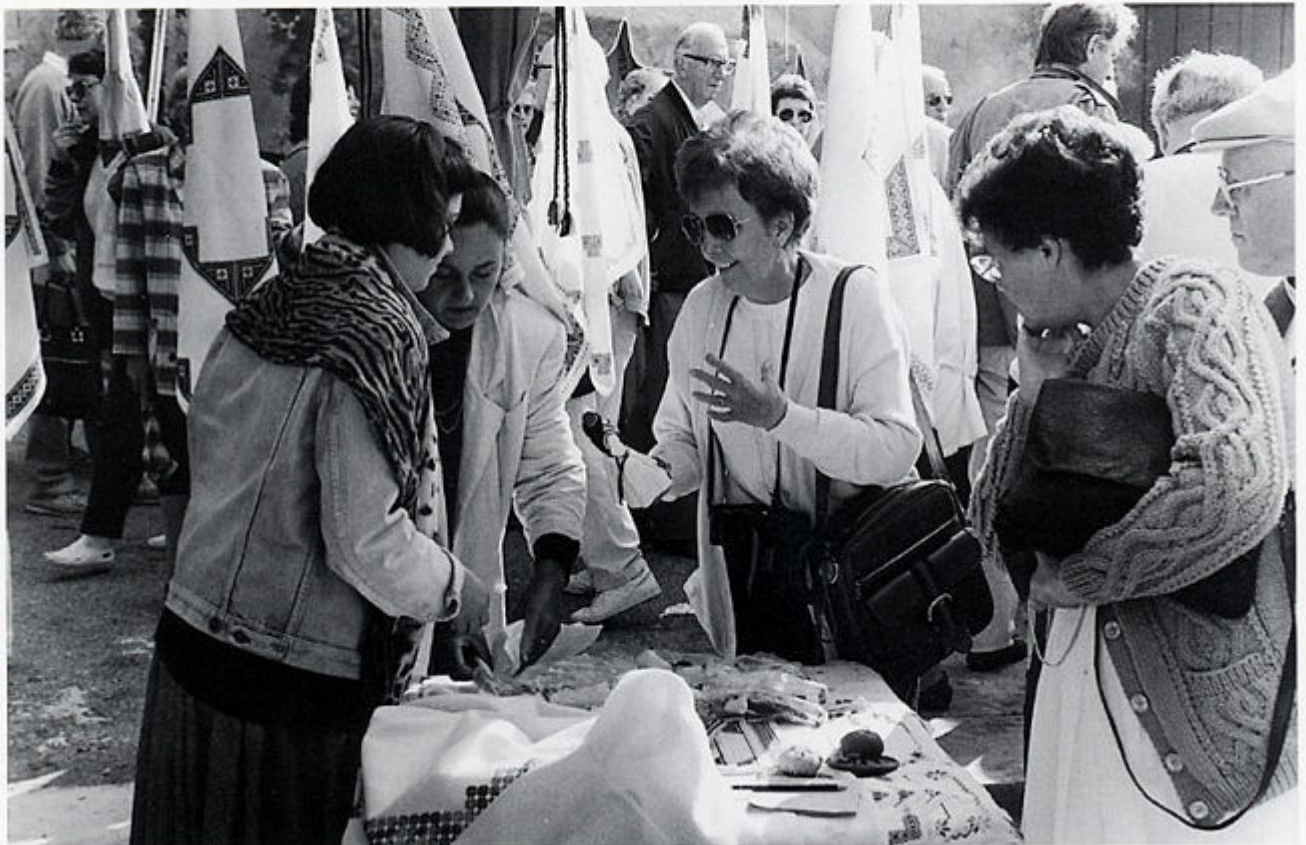
1. "Fešta" ispred crkve sv. Nikole u središtu mjesta. Čilipi, 1989.

To je bila zbirka lokalnog značaja: skupljena donacijama i privremenim posudbama stanovništva predstavljala je tek mali dio sveukupnih kućnih inventara obiteljskih zajednica Konavala. Muzejski predmeti nisu bili registrirani ni valorizirani kao niti cjelokupna zbirka. Nije postojao stalno zaposlen stručni muzejski kadar. Zapošljavanjem etnologa (1985.godine) na mjesto voditelja programa Čilipi i Zavičajnog muzeja stvorile su se pretpostavke za kvalitetnijim i osmišljenijim djelovanjem muzeja unutar turističke ponude. Usmjeren na turizam, kroz obaveznu destinaciju grupa koje su obilazile dubrovačko zaleđe, muzej je ispunjavao funkciju prikazivanja, čuvanja i održavanja baštine.