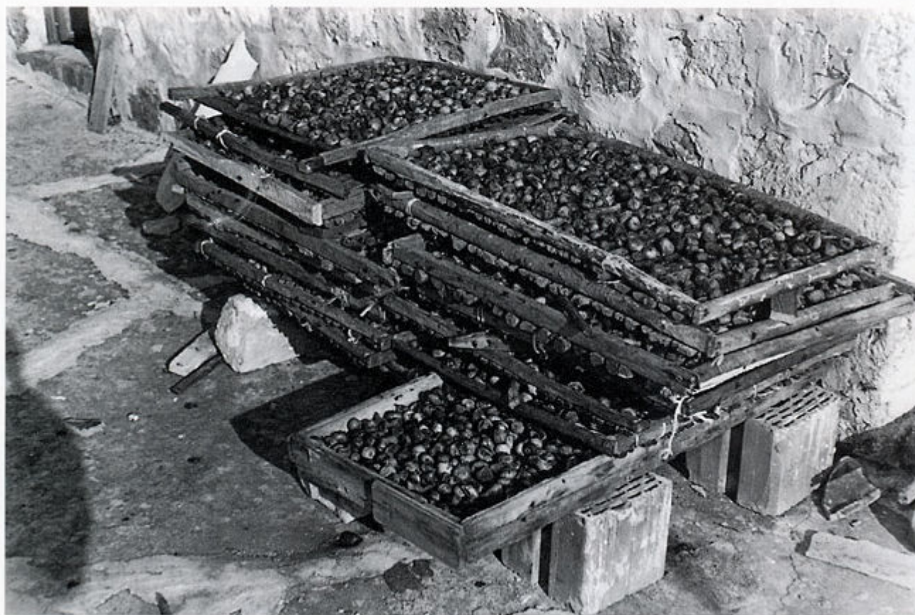
3. Sušenje smokava u Kuni Konavoskoj, 1989. god.