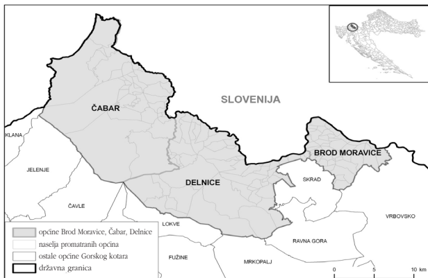
Slika 1. Položaj općina Čabar, Delnice i Brod Moravice

Područje istraživanja čini krajnji sjeverozapadni dio Gorskoga kotara u hrvatsko-slovenskom pograničnom području (slika 1.). Promatrani prostor obuhvaća tri jedinice lokalne samouprave: Grad Delnice, Grad Čabar i Općinu Brod Moravice 1 . Na području navedenih općina nalazi se 134 naselja, i to 38 u Općini Brod Moravice, 41 u Gradu Čabru i 55 u Gradu Delnice (DZS, 2011.b). S obzirom na prirodno-geografska obilježja i povijesno-geografski razvoj, sva veća naselja i važnije prometnice smješteni su u sjeveroistočnom (dolina Kupe i Čabranke –naselja Čabar, Prezid, Brod na Kupi) i jugoistočnom dijelu promatranoga prostora (središnji ili delnički koridor – naselje Delnice), a zapadni je dio gotovo nenaseljen (risnjačko-snježnički gorski blok) (Njegač i Pejnović, 2002.). Sve tri općine graniče sa Slovenijom, i to sa slovenskom povijesno -geografskom regijom Kranjskom, odnosno Notranjskom na krajnjem sjeverozapadu i Dolenjskom na sjeveru i sjeveroistoku. Važniji obližnji slovenski gradovi su Stari Trg i Cerknica, Postojna, naselja Prezid, te Ribnica, Černomelj i Metlika. Hrvatsko-slovenska granica prolazi obroncima planine Snježnik te dolinama Čabranke i Kupe. Na području promatranih općina nalazi se pet graničnih prijelaza – međunarodni granični prijelazi Prezid i Brod na Kupi, granični prijelaz za pogranični cestovni promet Čabar i Zamost, te sezonski granični prijelaz Prezid (Carinska uprava RH (CURH), 2011.).