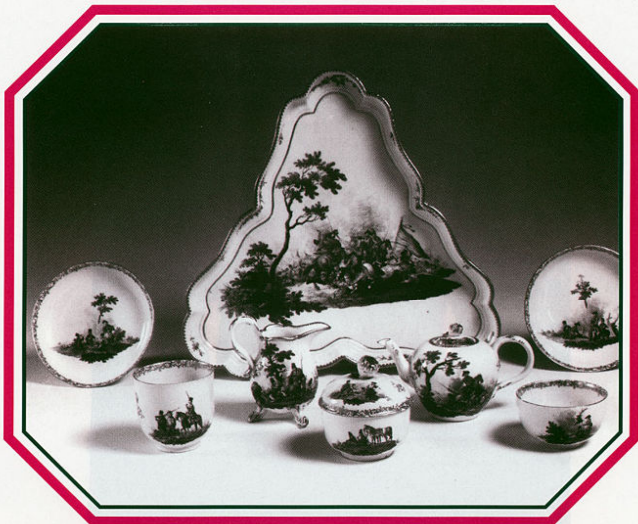
Meissen servis za zajutrak, oko 1776. nabavljeno za muzej preko L. Horvatha.

dnih nošnji 1910., 1911. i 1912. godine oko Siska, Petrinje, pa i Gline. Kako se vidi iz arhivskih zapisa, mnogo je predmeta otkupljeno novcem vlade. Pače je njihovu raspakiravanju po dolasku u muzej