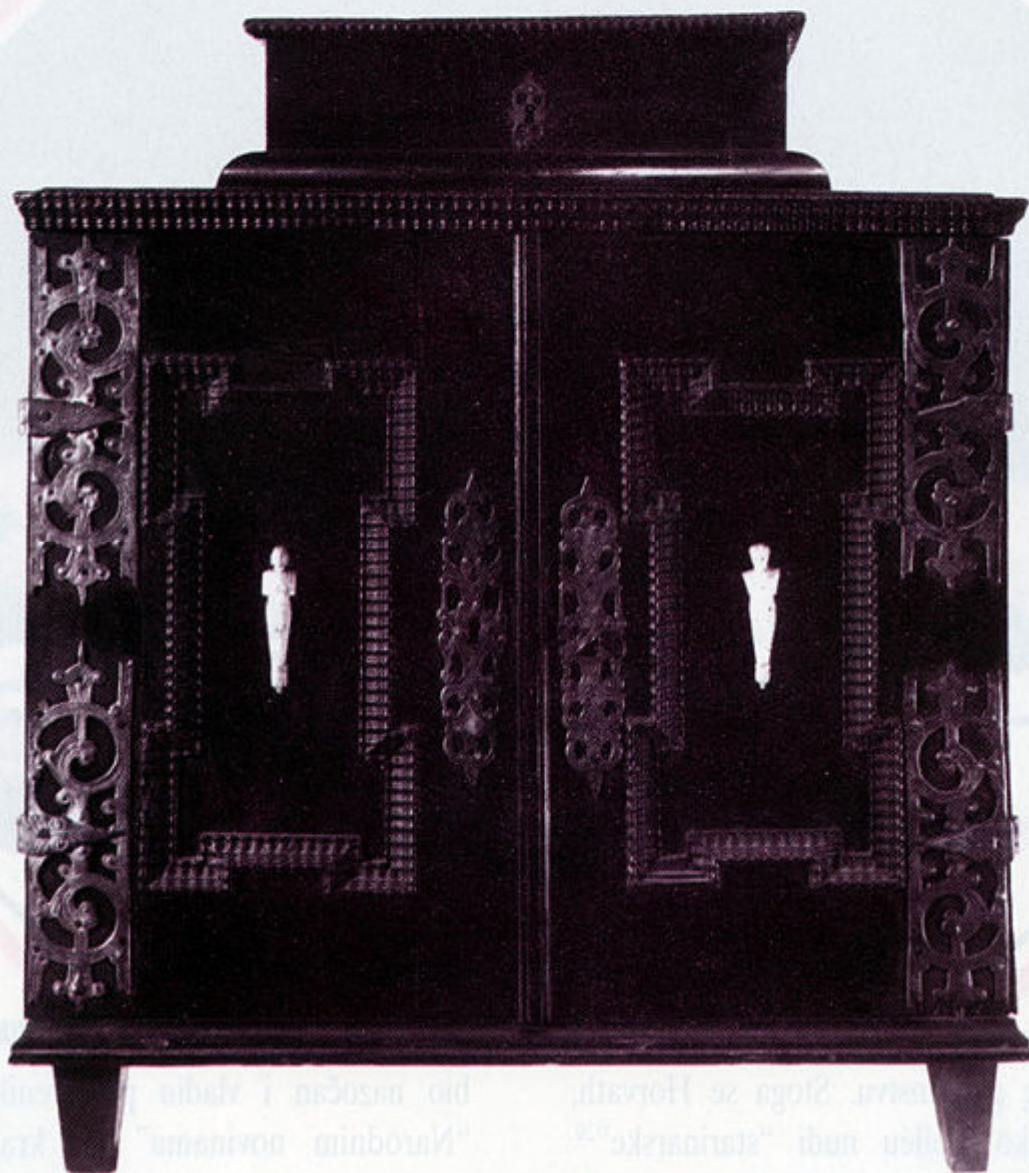
Kabinetski ormarić, druga pol. 17.st. iz zbirke Levina Horvatha, Foto: Z. Mikas

inventarima i arhivu MUO-a, kao i novinski članci napisani u vrijeme izlaganja poznate Horvathove zbirke posavskog veziva.