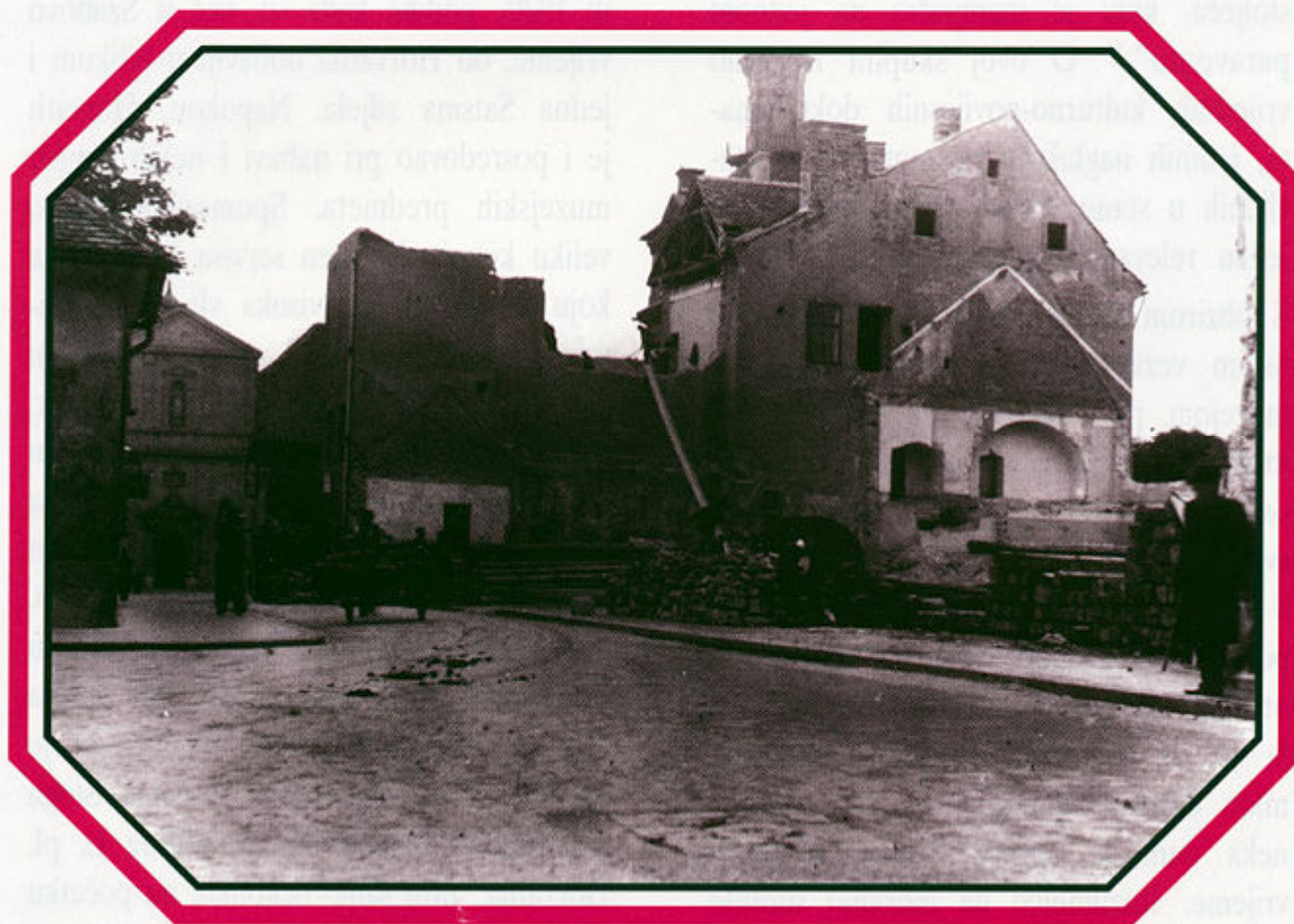
Rušenje kuće Helenbach 1941. godine ( nekadašnja kuća Levina Horvatha), Vranicanijeva ulica, Zagreb.

napokon, i trgovca starinama (Nije li i sam Mimara, osnivač naše najveće donatorske muzejske kuće, prodavao i preprodavao da bi došao do još vrednijeg, a za nj, svakako ekskluzivnijeg umjetničkog djela?). O tome svjedoče i brojni aukcijski katalogi koje je Horvath nabavljao i proučavao, a prema Szabovim riječima,