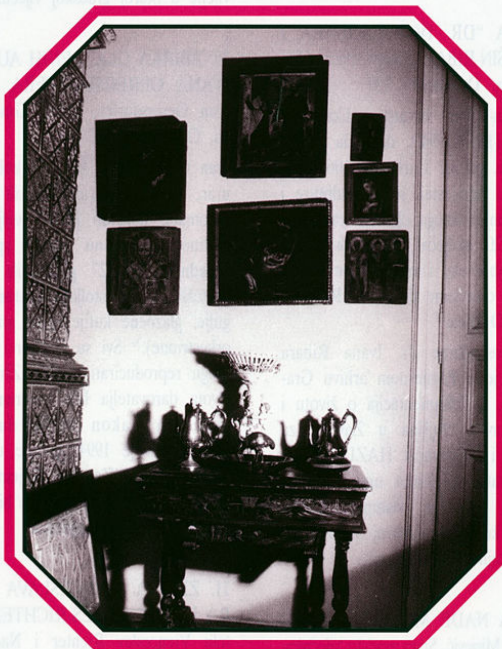
Detalj Zbirke Magjer, Tomislavov trg 8