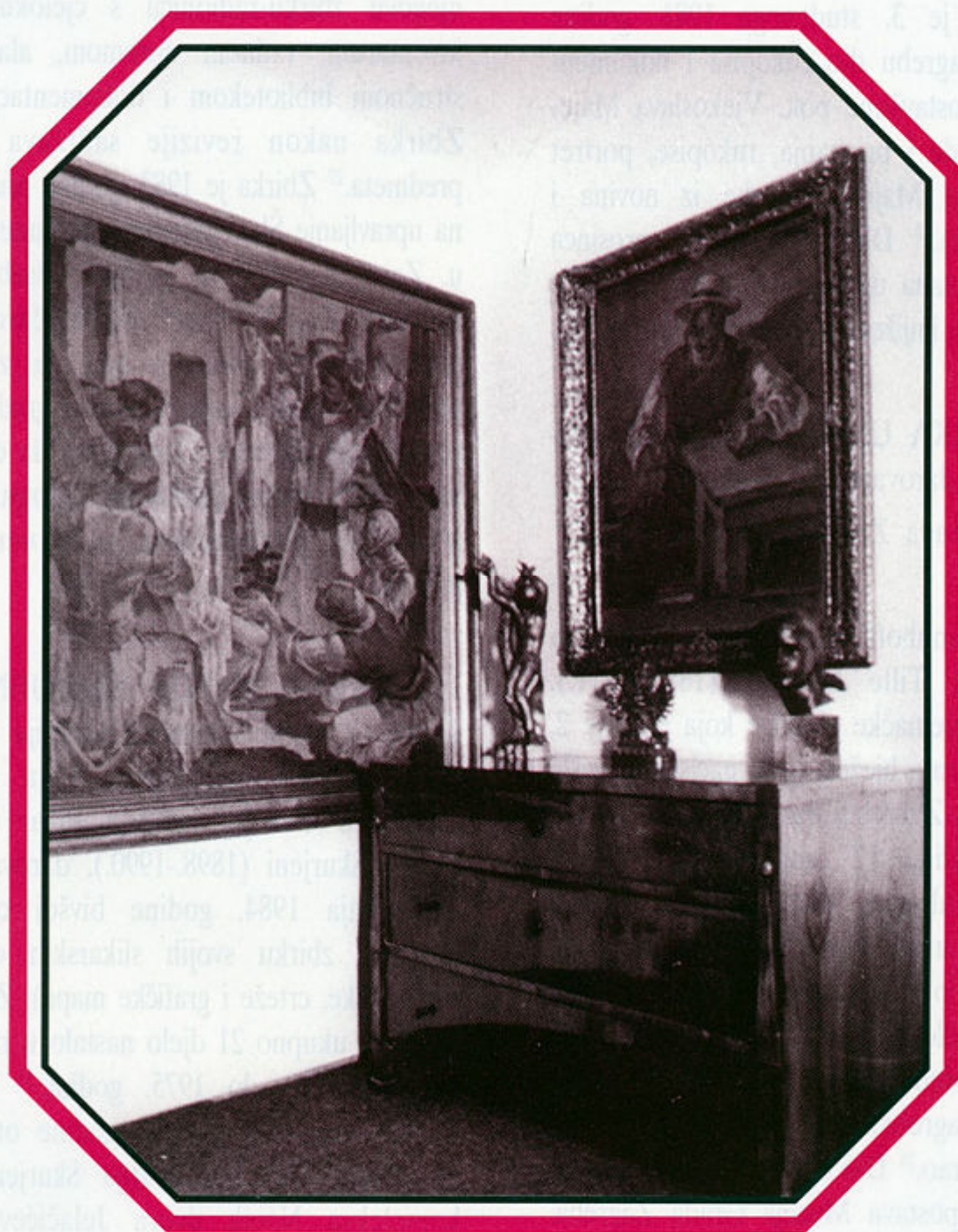
Zbirka Kljaković Magjer, Rokov perivoj 4.