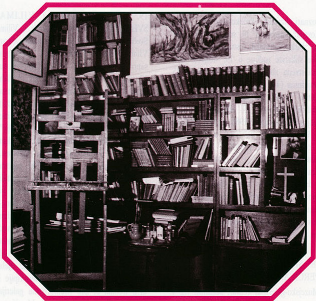
Zbirka Dr. Ivana Ribara