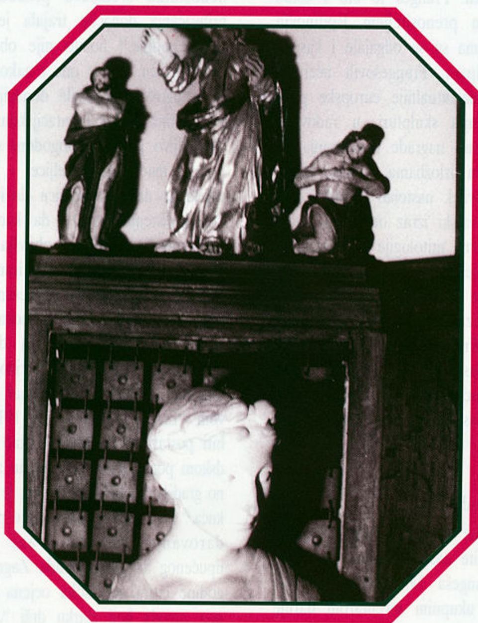
Zbirka Frangeš, Rokov periojv 2. Detalj interijera s drvenom oplatom, željeznom rešetkom (rad V. Kovačića), baroknim, polikromiranim skulpturama svetaca nepoznate provenijencije i kopijom antičke glave (vjerojatno rad Frangešovih učenika). 1995. godine, Foto: M. Lenković

naših muzeja u kojima je bilo prezentirano Frangešovo djelo već nam godinama nisu dostupni. 16 Važnost ove zbirke zbog toga je još veća jer nam na najbolji način