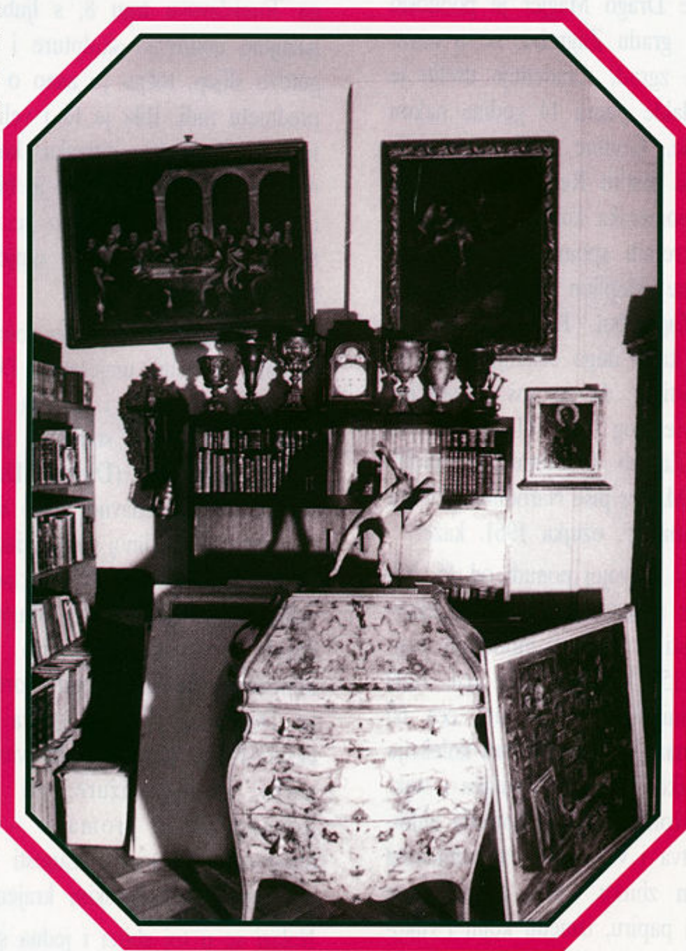
Ambijent Zbirke Magjer-Ostrogović, 1995. godine.

Ostrogović-Magjer, on je bio nećak prve žene Drage Magjera, "Mostarac u Splitu", kako mi je rekla - uglavnom zanimljivih eksperimenata izrazitoga kolorista,