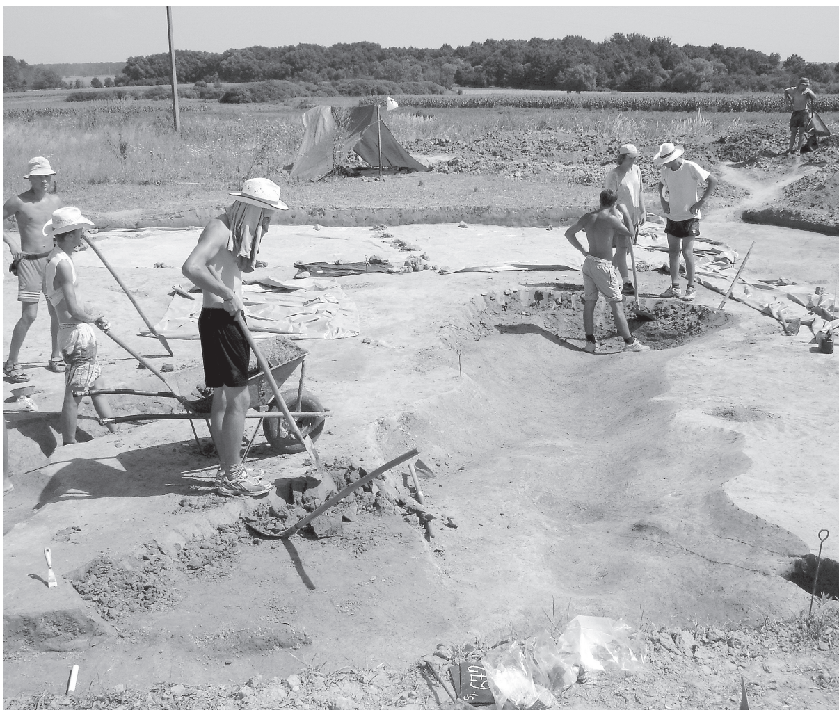
Slika 2. Veliki kanal SJ 671, 672 tijekom istraživanja 2004. g.