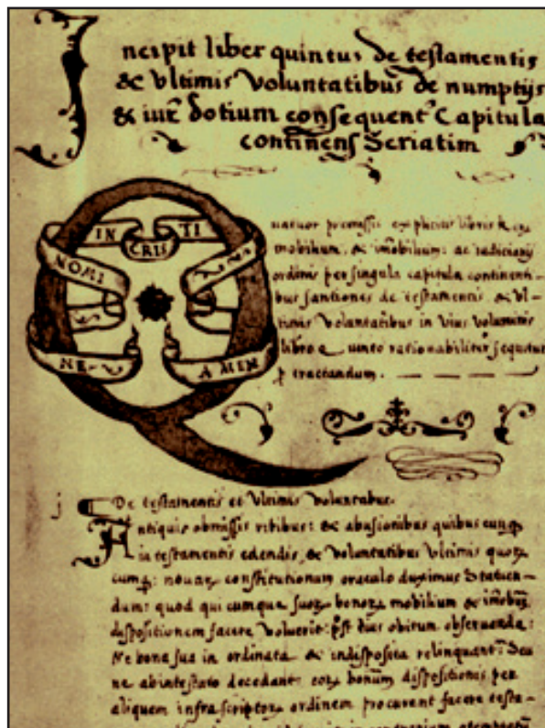
Slika 5. Stranica iz Šibenskog statuta, 1379. godine

ventivne poruke. U najstarijim dalmatinskim statutima, tj. u Korčuli (1266.) i Dubrovniku (1277.) spominju se travari i kazne za njihove propuste Erbaria vel maleficium erbariae . Ako bi liječenjem osakatili ili usmrtili bolesnika, u oba slučaja slijedila im je smrtna kazna (5, 6). Slično je bilo na Braču (1305.) i Hvaru (1331.), s time da su kazne bile relativno blaže, a ovisile su o prosudbi gradskoga kneza i suca (2, 11). Najoštriji su bili statuti Splita (1312.), Trogira (1322.), Skradina (1350.) i Šibenika (1379.) u kojima za artes magicales vel herbariae slijedi igni comburetur , tj. spaljivanje na lomači (2, 8, 10). Vještice i vračarice osobito su prokazane i u zakonima i statutima kvarnerskih gradova. Doživljavaju se kao utjelovljenje zla i nedokučivih mračnih sila te su kao takve nedvojbeno u svezi s bolestima i nedaćama. Protiv njih je već Vinodolski zakon (1288.) izuzetno okrutan. Dokaže li se za nekog muškarca ili ženu da spravljaju otrove i čarolije koji mogu nanijeti štetu i bolest čovjeku ili životinji, kazna je prvi put globa knezu od 100 libri. Ne uzmognu li platiti ili to ponove, slijedi spaljivanje na lomači (12, 13).