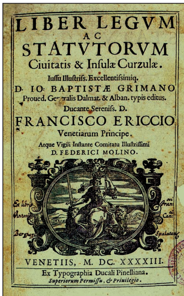
Slika 2. Naslovnica Statuta otoka i grada Korčule, prvog tiskanog izdanja u Mlecima, 1643. godine

O čuvanju čistoće u kvarnerskim gradovima prve su odredbe datirane 1388. u Vrbničkom (14) i Senjskom statutu (15). Dok se u prvome samo obvezuje na održavanje čistoće, u Senju se za bacanje vode ili druge prljavštine na neku osobu koja ide ulicom prekršitelj kažnjava novčano, a isto slijedi i mesarima za nesavjestan rad, tj. iznošenje koža iz mesnica.