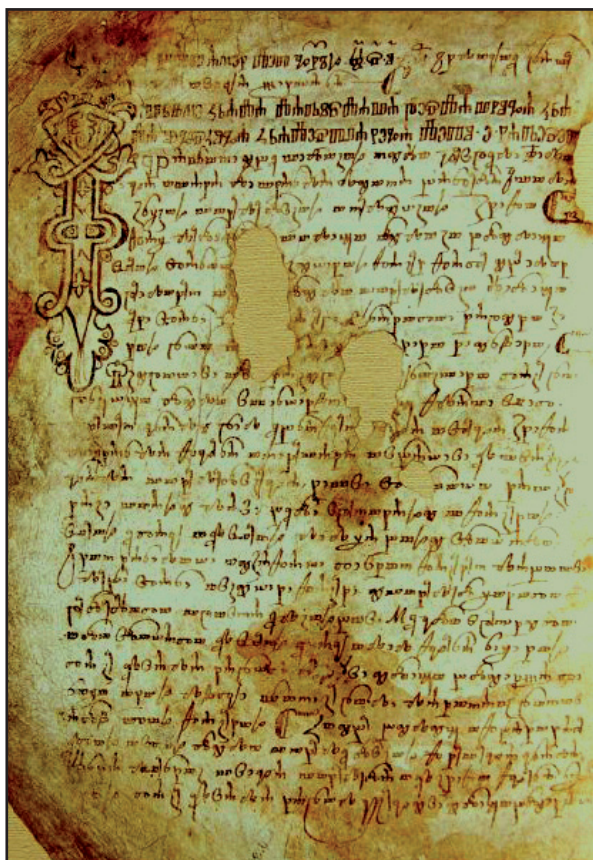
Slika 3. Stranica iz Vinodolskog zakona, 1288. godine

Glede bludnica stav je više-manje jednak u svim europskim srednjovjekovnim sredinama. Njihov se "zanat" načelno tolerira te im se u pravilu određuje mjesto stanovanja u zabitnijim dijelovima grada ili izvan gradskih zidina. Takva je situacija i u gradovima duž jadranske obale od Dubrovnika do Rijeke čiji Statut nešto kasnije, tj. 1530. određuje bludnicama mjesto stanovanja izvan gradskih bedema u kućama smještenim dalje od cesta; zatekne li se drugdje, slijedi kazna od 10 libri i izbacivanje iz tog stana te dodatna kazna najmodavcu od 5 libri (20). Premda su te i takve odredbe u ishodištu čudoredne naravi, ne treba puno mašte da bi se u njima naslutile i određene pre-