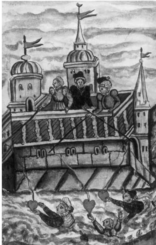
Sl. 3. Dvorske djevojke i kavaliri; hrabri kavaliri skaču u potok oko dvorca kako bi uhvatili srca svojih odabranica. Zdenek von Waldstein , kraj 16. st.

U Eleonorino vrijeme se i od njenog dijela dvorske službe, dakle njenih Hofdamen i drugih nositeljica dužnosti tražio poseban moralni stav i držanje. Zaduženja Hofdame postaju sve više religiozna. Tako u vrijeme ratova s Osmanskim Carstvom dame mole uz caricu. 106 Valja naglasiti da pietas Austriaca , čak i prije nego dolazi u zrelu fazu barokne pobožnosti, značajno utječe na promjenu rodniha odnosa. Već je Anna Goreth 1959. u svojoj knjizi „ Pietas Austriaca “ istakla da je za obje linije Habsburga „tipičan element Pietas (...)“ pri čemu je utjecaj žena postao