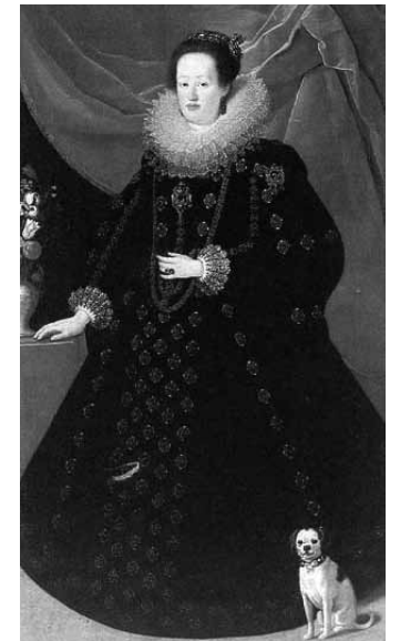
Sl. 2. Carica Eleonora Gonzaga starija. Portret: Justus Sustermans, 1623./1624.

Carica Eleonora iznimno dobro ilustrira dinastički odnos prema vjeri i katoličanstvu. Samo geslo, fortunante deo , 103 koje se pojavljuje na zlatnim kovanicama izvrsno svjedoči o caričinom stavu i usmjerenju. S druge strane, iako se carica posvetila oblikovanju duhovnog aspekta dinastičke politike, što pretpostavlja i adekvatnu sliku u javnosti, njezin je politički angažman postojan i dugotrajan. Isprva je bila orijentirana na pomaganje i zagovaranje vlastite obitelji. Beč i Pfalz-Neuburg, odnosno Düsseldorf nikada nisu bili bliži nego u njezino doba. 104 Dakako, Leopold i njegovi pobočnici, bilo da se radilo o Liechtensteinu, Wratislawu, Lobkowitzu ili Eugenu, kreiraju politiku Monarhije. Carica je u to doba još stajala po strani. No, ne zadugo. Leopoldova smrt (1705.), a zatim i Josipova, ispraznila je bečko prijestolje do Karlova dolaska. Prazninu je trebala popuniti upravo Eleonora jer joj je Leopold I. oporučno ostavio prijestolje u slučaju njegove smrti i maloljetnosti njegovih nasljednika. Oporuka je bila prilagođena ovakvoj situaciji. Eleonora je