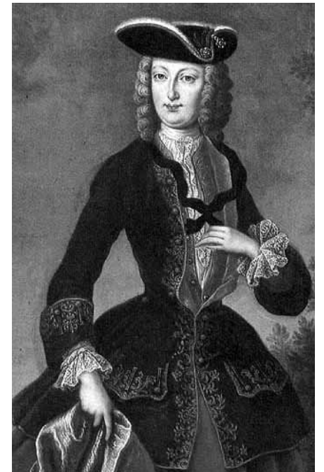
Sl. 4. carica Elizabeta Kristina, nepoznat autor, 18. st.