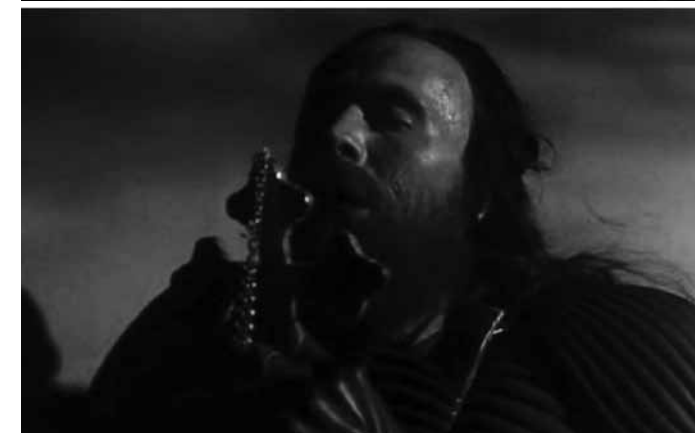
Slike 2, 3, 4. Tri lica Dracule; Max Schreck („ Nosferatu “ iz 1922.), Christopher Lee („ Dracula “ iz 1958.) i Gary Oldman („ Bram Stoker's Dracula “ iz 1992.).