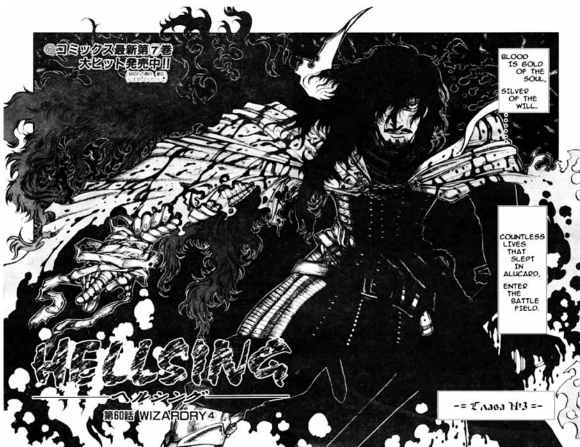
Slika 6. Tabla iz stripa „Hellsing“

pouzdanih izvora o njegovom životu otvorila je put mitologizaciji. Saski trgovci, njegovi ljuti protivnici, pamte ga kao krvnika i njihova se priča širi Europom. Povjesničar Wilkinson spominje Vlada u svojem pregledu rumunjske povijesti, po kojem književnik Bram Stoker radi bilješke za svoj roman. Roman i njegov junak postižu veliku popularnost i postaju inspiracija brojnim drugim umjetnicima. Dvije najmlađe umjetnosti, film i strip, zbog svoje masovnosti čine Draculu besmrtnim. Međutim, u historiografskome diskursu 1970-ih godina javljaju se podaci o pravome Draculi, što uvelike utječe na daljnje umjetničke portrete. Fikcija i povijest stapaju se u jedno. Štoviše, Stokerov Dracula polako prestaje biti u središtu zanimanja. Percepcija i umjetnički prikazi mijenjaju se prema društveno-povijesnom kontekstu. Priča o Draculi – Vladu, zapravo je priča o fikcionalizaciji prošlosti. Povijesni izvori; anali, ljetopisi, kronike, epovi, romani, slike, arhitektura, glazba, romani, filmovi ili stripovi, mediji su koji autorima omogućuju subjektivan tretman prošlosti kao i njezinu masovnu eksploataciju. Historiografi u tome moru informacija nastoje razlučiti istinu od mašte, što u mnogim slučajevima, poput Vlada III., može biti izrazito težak posao, kada se susretnemo s nekoliko različitih slojeva „fikcije.“