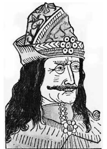
Slika 1. Vlad III., drvorez, Nürnberg, 1488. godina.

Proces fikcionalizacije lika Vlada III. nije počeo s Bramom Stokerom. Povijesni izvori koji govore o Vladu, kronike i usmena predaja, mogu se također smatrati nekom vrstom fikcionalno-umjetničkog prikaza, jer su najčešće pisani/prepričavani sa određenom tendencijom. Znanstvenom analizom se nastoji razlučiti povijesnu zbilju i umjetne koncepcije kroničara, ili informacije koje je autor primio iz sekundarnih izvora. Govoreći o Vladu III., imamo dvije skupine izvora. One koji ga prikazuju u negativnom i pozitivnom svijetlu. Budući da je Vlad III. bio u čestim sukobima sa saskim trgovcima u Transilvaniji, 3 njihove kronike prikazuju ga kao krvoločnog, brutalnog vladara koji se na jezovit način obračunava sa svojim protivnicima. 4 S druge strane, ruske kronike, kao i rumunjska narodna usmena predaja govore o vlaškome grofu kao pravednom vladaru koji se proslavio bitkama protiv Osmanlija. 5