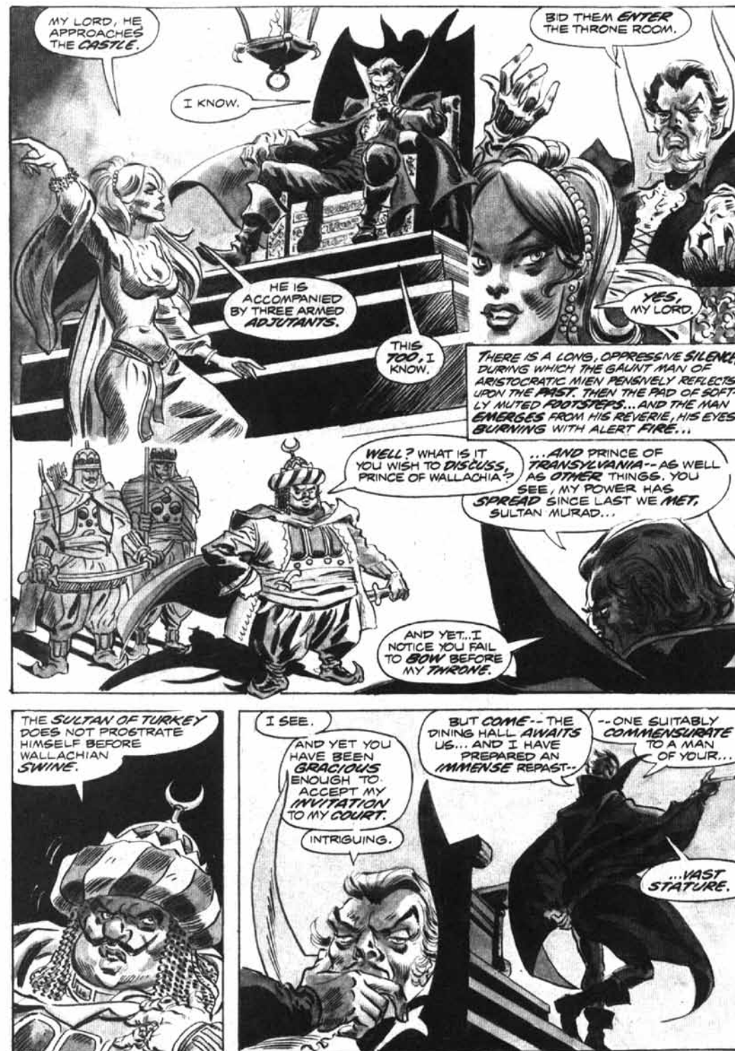
Slika 5. Tabla iz stripa „ Tomb of Dracula “

Za gotovo potpunu demistifikaciju i defikcionalizaciju stripovskog Vlada III. pobrinuli su se scenarist Yves Huppen, i njegov otac, crtač Hermann. Oni su 2006. izdali naslov „ Sur les traces de Dracula: Vlad l'Empaleur “ ( Drakulinim tragovima: Vlad Nabijač ), 27 stripovsku biografiju koja prati život Vlada III. od rođenja do smrti. Kao i u Nastaseovom filmu, nema poveznica između povijesnog Dracule i njegovog fiktivnog imenjaka, ali je isto tako opstala i krvoločna dimenzija, kao dramatski konstrukt. Vlad je prikazan kao žrtva političkog darvinizma, Vlaška postaje „sveti gral“ koji pokušavaju prisvojiti brojne frakcije i pretendenti na prijestolje. Svrgavanja, ubojstva, ratovi, pljačke, paleži i nabijanja na kolac postaju