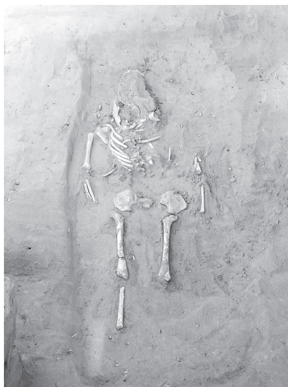
Sl. 2. Grob 42 Fig. 2. Grave 42

Prilozi iz grobova bjelobrdske kulture koji su zabilježeni u iskapanjima u 2004. g., potvrdili su sliku koja je dokumentirana tijekom prijašnjih istraživanja. Kosturni grobovi u pravokutnim grobnim rakama orijentiranim zapad-istok tvore redove, što svjedoči o organiziranom načinu pokapanja na groblju. Prilozi iz grobova svjedoče o bogatoj opremljenosti pokojnica koje su vrlo vjerojatno posjedovale istaknuti društveni položaj unutar zajednice koja je naseljavala prostor sela Zvonimirovo. Istraženi grobovi, prema brojnim priložima, mogu se datirati u 11. stoljeće. Osobito važan podatak predstavlja dokumentirani stratigrafski odnos između grobova 41 i 42. Naime, u grobu 41 pokopana je odrasla osoba, a neposredno ispod toga ukopa nalazio se grob 42 u kojem je u bogatoj nošnji pokopana djevojčica.