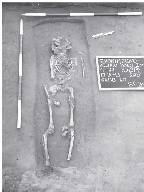
Sl. 1. Grob 40 Fig. 1. Grave 40