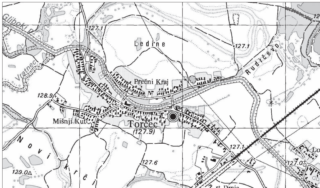
Prilog 1. Karta s označenim položajem srednjovjekovnog nalazišta Torčec - Blaževo pole 6 Appendix 1 - Map with marked location of the medieval Torčec-Blaževo pole 6 site

nčić, stručna suradnica Instituta za arheologiju 3 . Prigodom provođenja probnih arheoloških iskopavanja u 2004. g. vodena je dokumentacija prema službenim obrascima Instituta za arheologiju 4 .