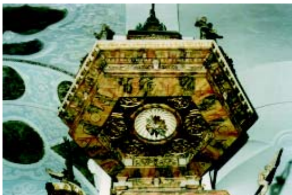
Slika 1.: Nebo baldahina prije konzervatorsko-restauratorskih radova