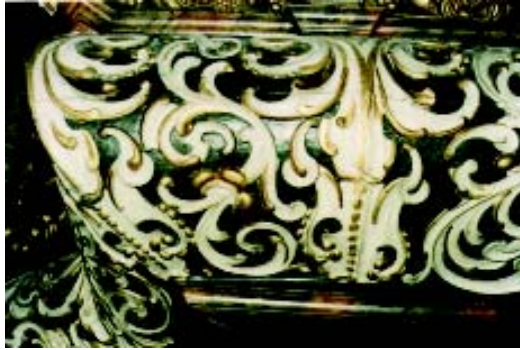
Slika 1. Trbuh propovjedaonice prije konzervatorsko-restauratorskih radova