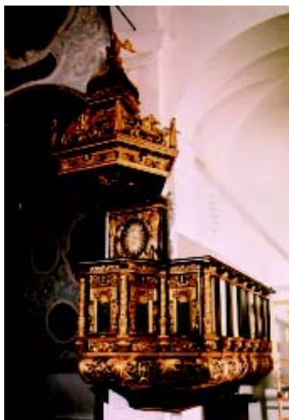
2. Propovjedaonica u fazi pozlatarskih radova: pogled s jugoistoka