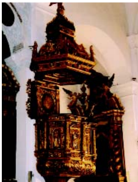
3. Propovjedaonica nakon završenih konzervatorsko-restauratorskih radova: pogled s jugozapada