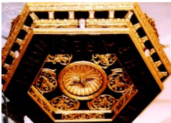
Slika 3. Nebo baldahina po završetku konzervatorsko-restauratorskih radova