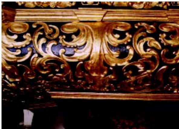
Slika 3. Pogled na trbuh propovjedaonice nakon završenih radova