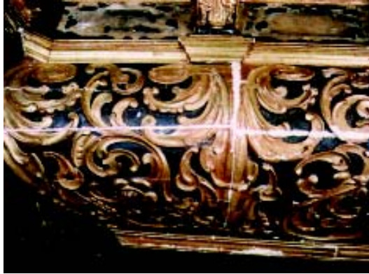
Slika 2. U fazi krediranja oštećenja saniranja pukotina na trbuhu propovjedaonice