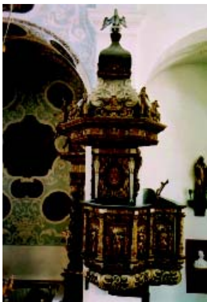
1. Propovjedaonica prije konzervatorsko-restauratorskih radova: pogled s juga