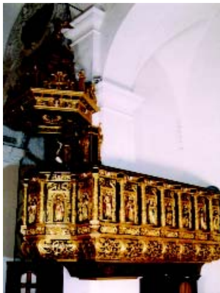
4. Propovjedaonica nakon završenih radova: pogled iz svetišta