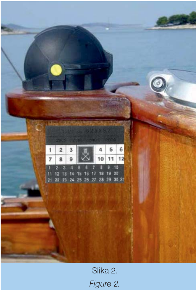
Slika 2. Figure 2.

Vinjeta se lijepi na vidljivom dijelu trupa ili nadgrađa plovila (slika 2.).